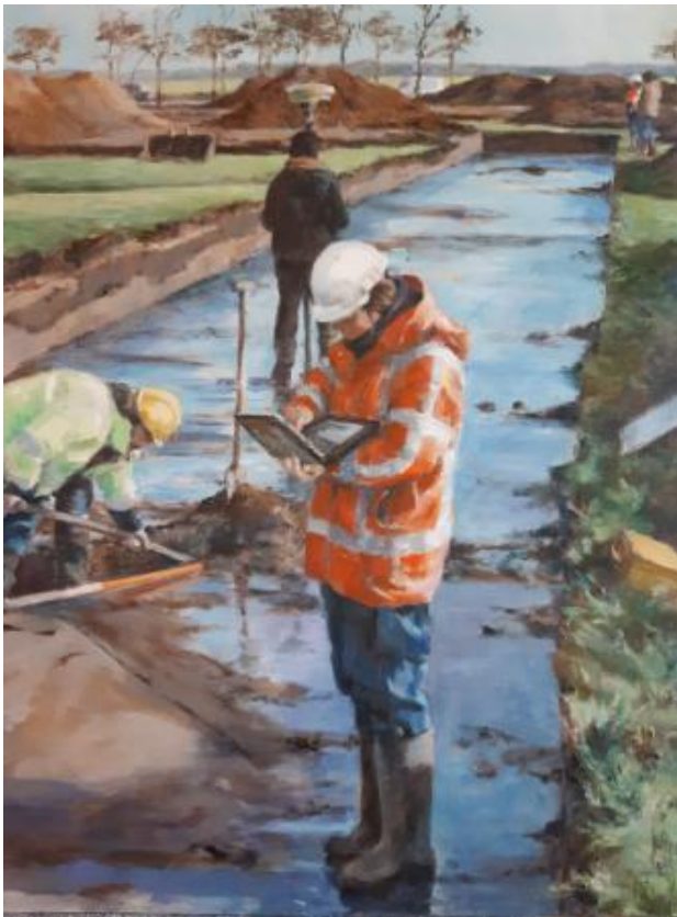
De WP4 , 2021 olieverf op board, 47 x 62 cm