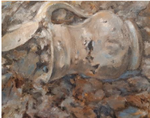
Schenkkan, 2021 olieverf op doek, 24 x 30 cm.