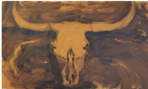
Waterbuffel op papier, 2020 acrylverf op papier, 40 x 60 cm.