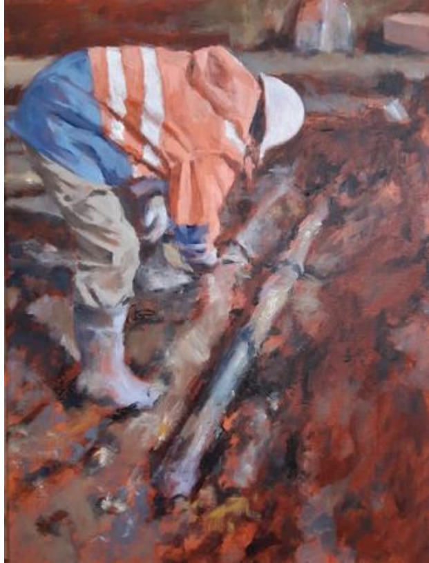
Opgraving van een haakbus, 2021 olie op canvas, 40 x 30 cm