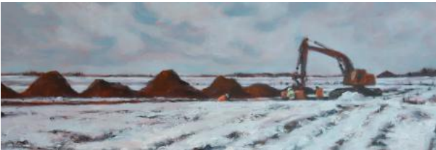
Winterlandschap, 2021 olieverf op paneel, 21 x 61 cm