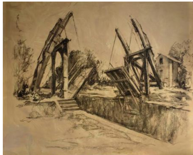
Pont de Langlois, 2018 pastelkrijt en houtskool op papier, 70 x 90 cm