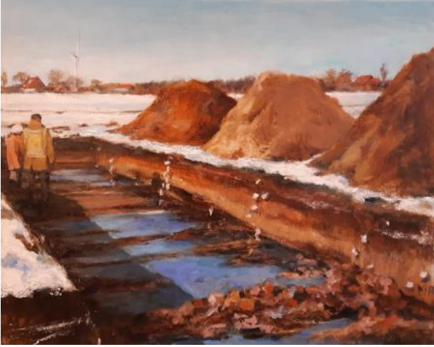
Sleuf met dwarsdoorsnee gracht, 2021 olieverf op doek, 40 x 50 cm