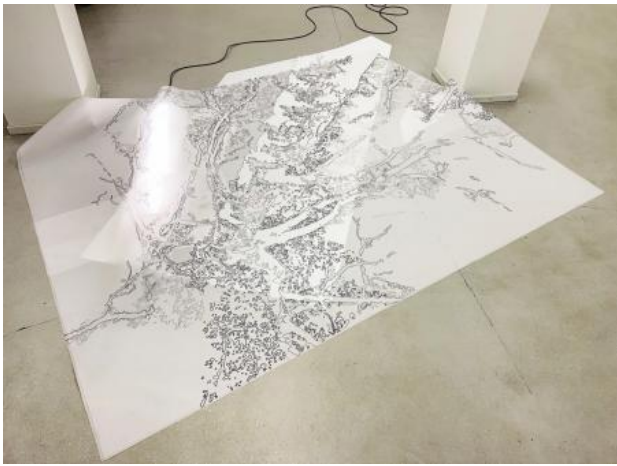
Darstellung einer Rosskastanie, 2022 gemengde techniek, 200x250x10cm