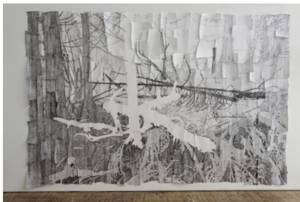
Hybrids present, 2017 Installatie van grafiet op papier, 275x400x10