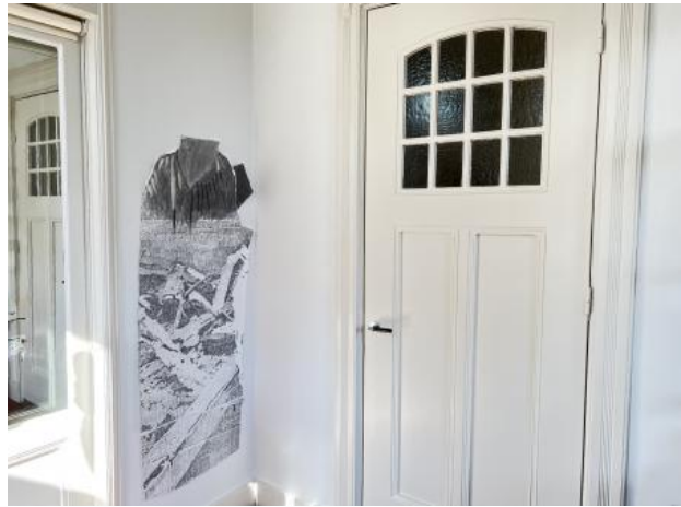
Vessel, 2021 frottage en grafiet tekening, 65 x1x160 cm