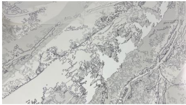
Darstellung einer Rosskastanie, 2022 gemengde techniek, 200x250x10cm