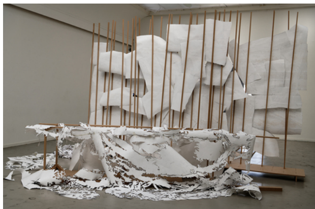
Maalstroom, 2019 andere kant met sjabloon maalstroom onderdeel van de site specific installatie, 8m x 6m x 3m