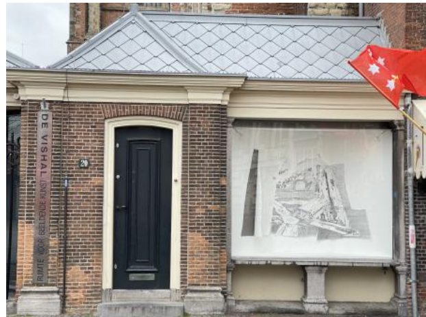
Maalstroom etude M, 2023 frottage tekening met grafiet met wit en grijs papier, 210 x 10 x 120 cm