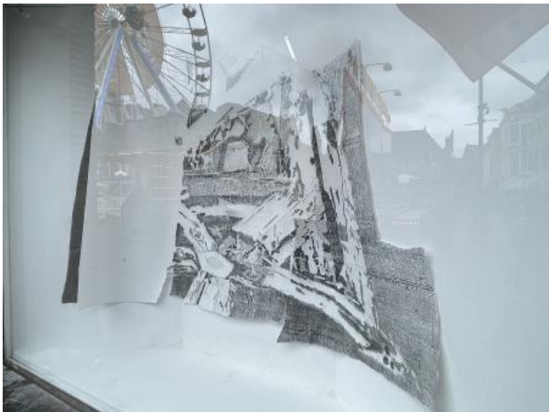
Maalstroom etude M, 2023 frottage met grafiet, uitsnede en gescheurd papier, 210 x 10 x 120 cm