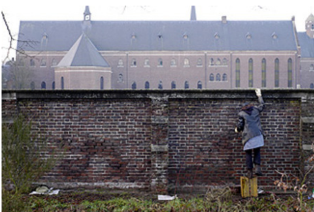
voegen van 364,80 meter kloostermuur, 2016 vanaf 03 maandelijks met de hand voegen, L.364,80m