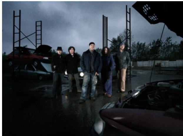
Woeste Grond, verdwijnen autosloop Binck, 2012 autowrakken stapelen stalen stellages, 5m H