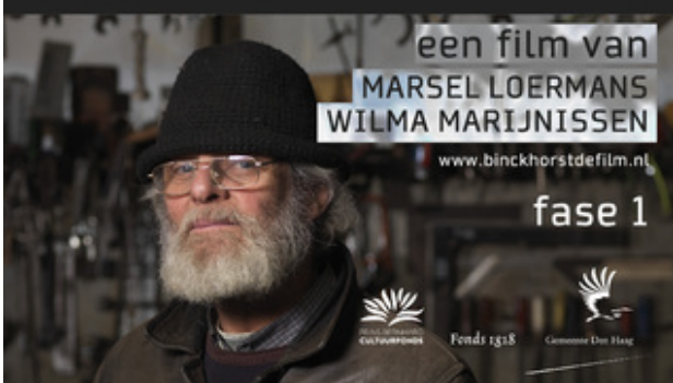
documentaire binckhorst fase 1, 2014 filmportretten in 3 delen, 90 min per deel