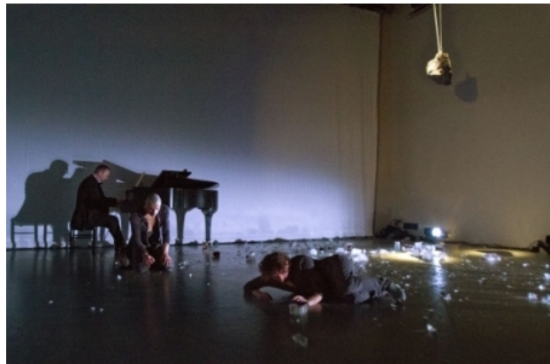
GLACIER deel3 Winterreise Schubert, 2011 kei nat druppelend, vallend ijs gerbra's