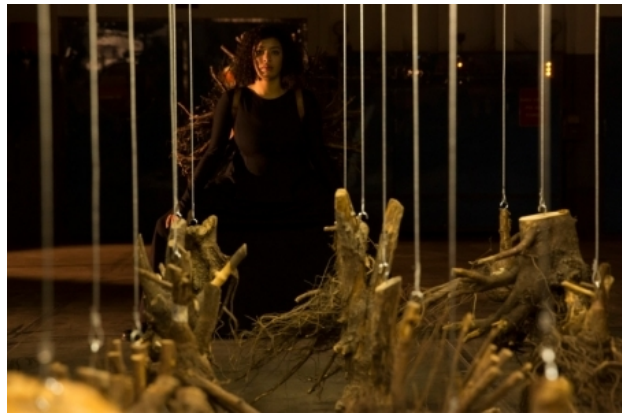
Stabilitas Loci, 2013 boomwortels aan staalkabels, wortel als, 2x(4x1.5x6m)