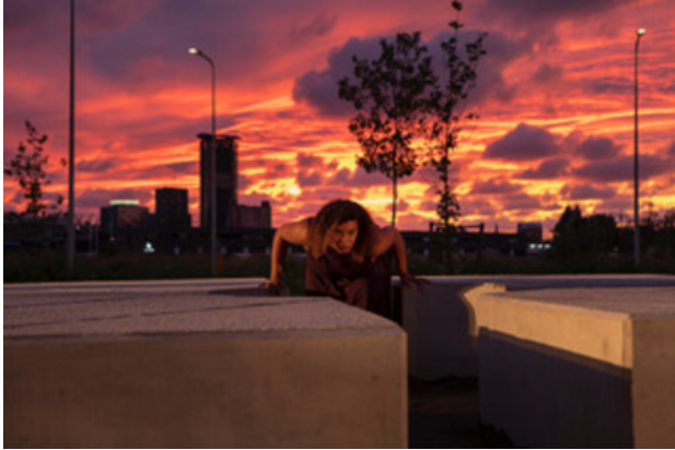
TERRA MATER, 2018 4 delen gewapend gestort beton, in aarden cirkel diameter 12m, gewicht: 4x3 ton = 12 ton, 4.60x.4.60x0.60H

2000 - trainingen Beeldende Vorming voor 2022 onderwijs en welzijn