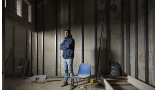
Skatepark Sweatshop 6|7|8 oktober Binckhorstlaan 275, 2517H8 Den Haag 5 oktober gratis alleen op voorstelling