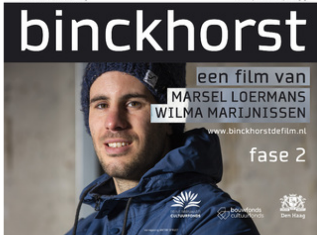
documentaire binckhorst de film, fase 2, 2017