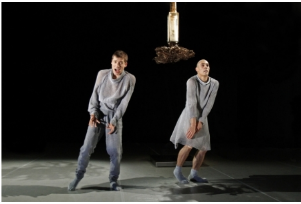
NÉVÉ deel1 Winterreise Schubert, 2010 wortel, stam in ijs in frame, warmteplaat, L 2.20m