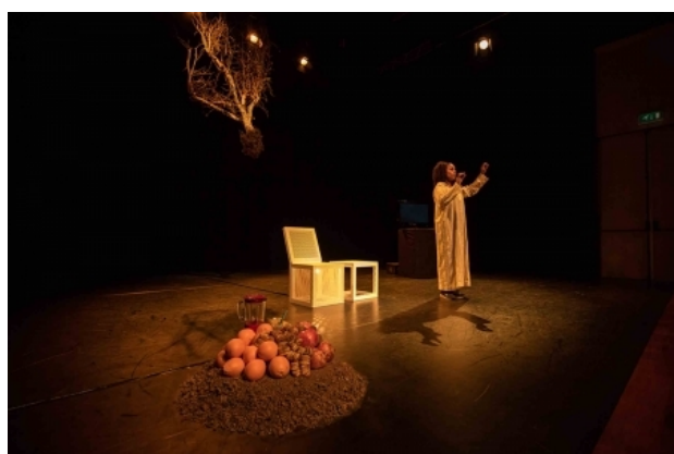
Gnaoui Goed Gedaan, 2015 toneelbeeld granaatappelboom zitelemente