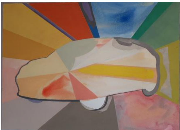
MG 4 electric, 2023 auquarel goache op papier, 32x24 cm.