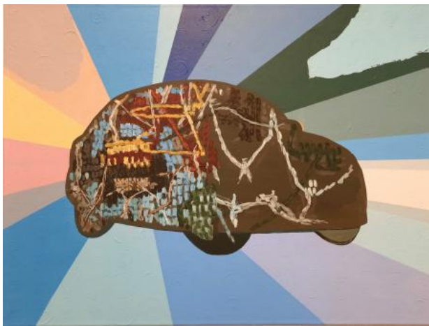
Kracht van betekenis, 2024 acrylverf op doek, 80x60 cm.