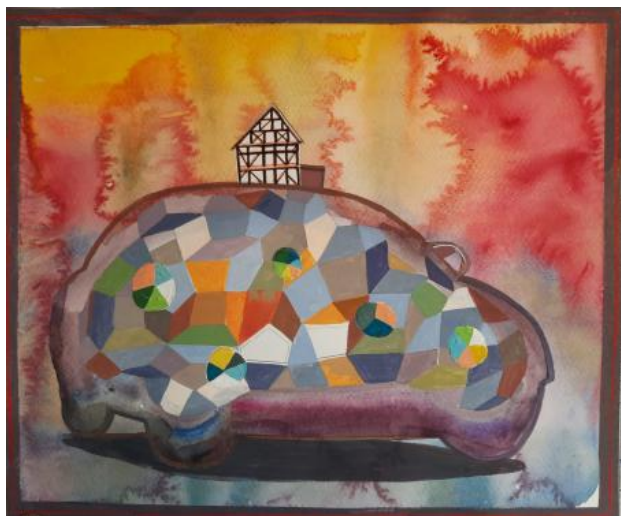
Het grote verschil, 2023 aquarel en gouache op papier, 35x27 cm..