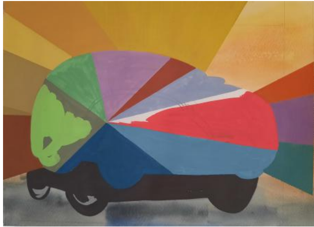
Audi, 2023 gouache op papier, 34x25 cm.