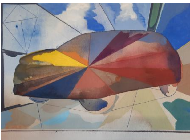
De Vlieger, 2023 aquarel en gouache op papier, 34x25 cm.