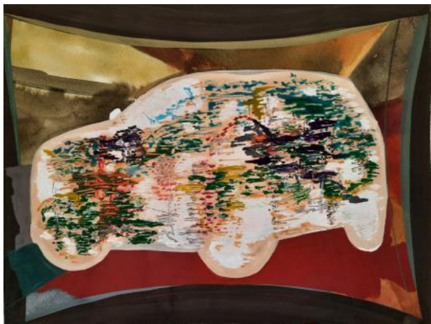
Complete dominantie , 2024 gouache op papier, 35x27 cm.

2007 - Tutor / Universiteit of Pécs / Master's 2008 School of Fine Arts