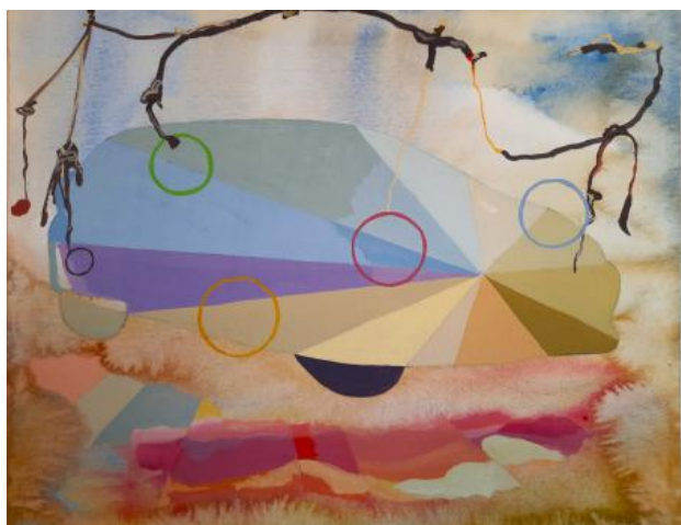
Lucht cirkels, 2023