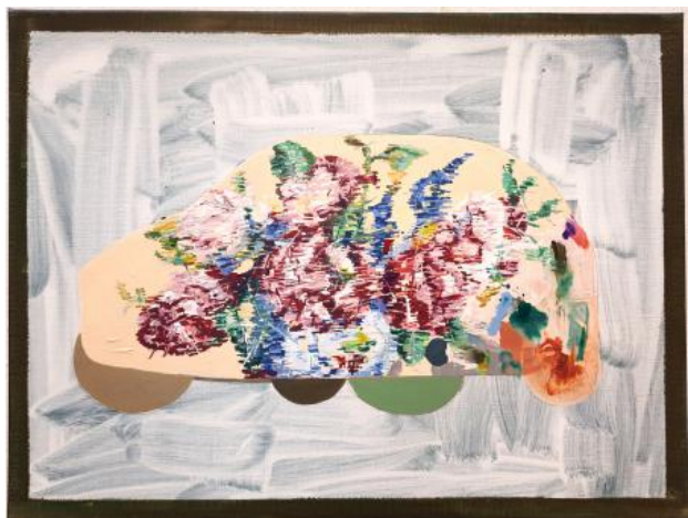
Met de beste bedoelingen, 2024 acrylverf op doek, 61x46cm.