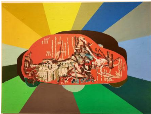
Een ferm standpunt, 2024 acrylverf op doek, 80x60 cm.