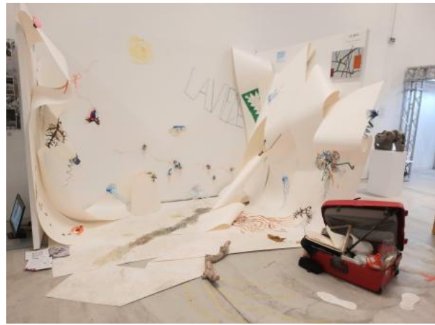
On Mèkh beach / Reversal of the Tidesaleach, 2024 Stucloper, gevonden materialen, collage, tekeningen, schilderijen met lokale aarde, 400x150x250cm