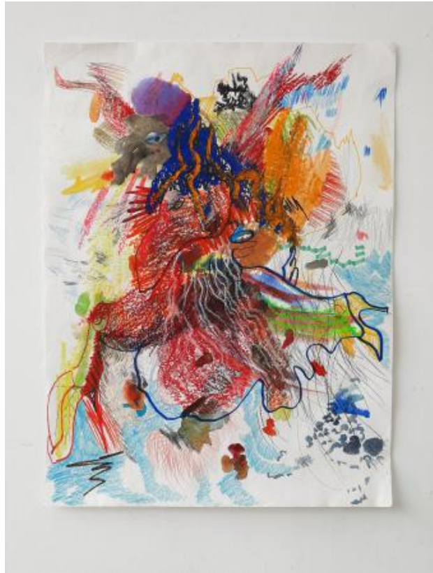
Rock- golvend DH Serie: Waarvandaan No.6, 2024 Potlood, multicoloured potlood, oliepastelkrijt, marker op aquarelpapier, 81x61cm