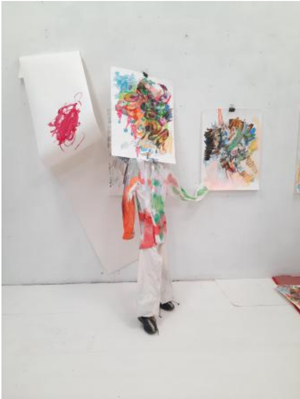
Posing, 2024 studio wall installation