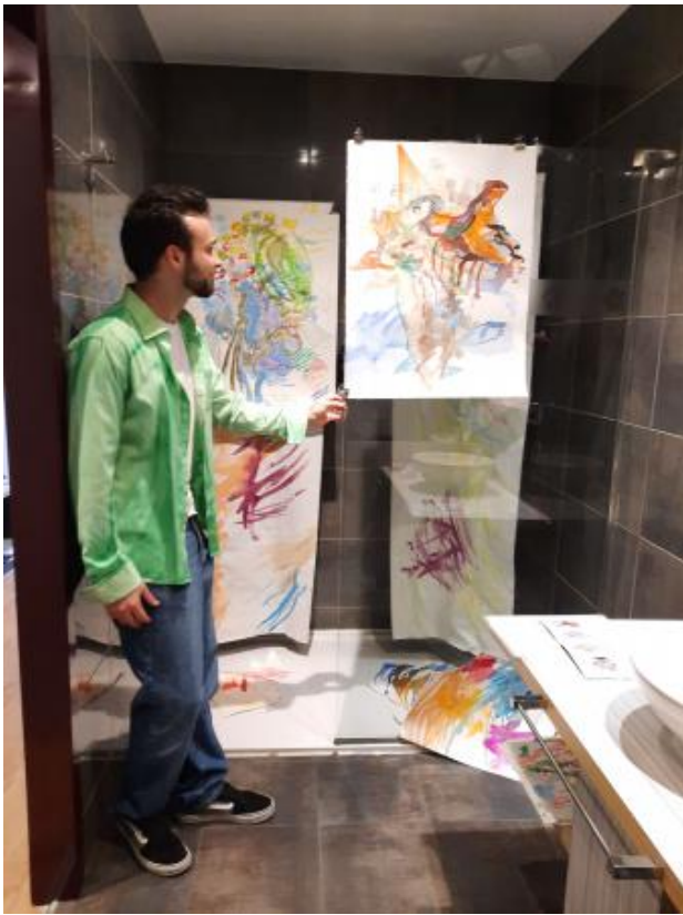
Character meetings, 2024 Tekenmateriaal, acryl op papier, katoendoek en overhemd, a bathroom