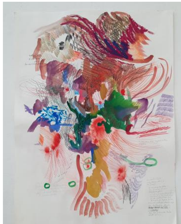
Dan komt alles langs..., 2024 watercolour, colourpencil, biro, gouache, graphite pencil, 81x61cm