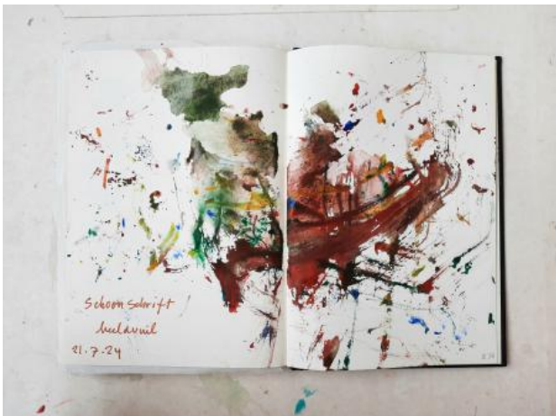
Schoonschrift Beeldvuil 21.7.2024 Pag. 3.38 boek 3 Page 3.38 book 3, 2024 schrijven en tekenen in een notitieboek