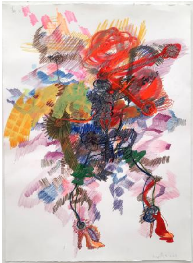
Sois belle et tais-toi (waiting for the other context), 2024 Gouache, kleurpotlood, multicolour potlood, potlood, marker op aquarelpapier. , 77x56,5cm