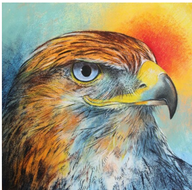
Arend, 2019 pastel op paneel, 40x40 cm