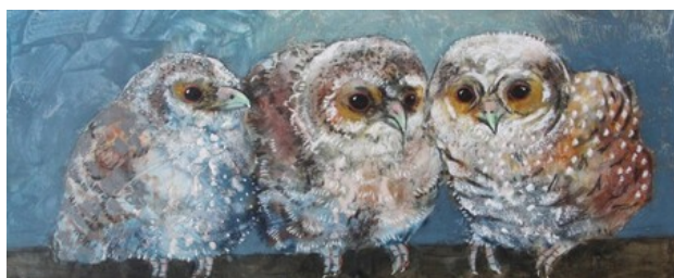
Drie op een rij, 2019 pastel op paneel, 23x60 cm