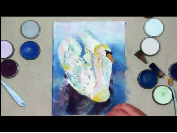
Swan made with PanPastel, 2019 7 minuten