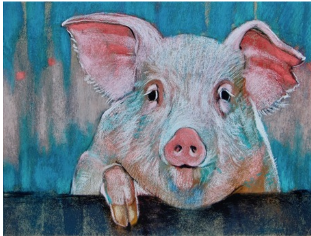
Varken, 2019 pastel , 23x30 cm