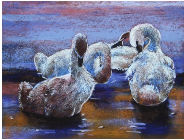
Jonge zwanen, 2019 pastel , 23x30 cm