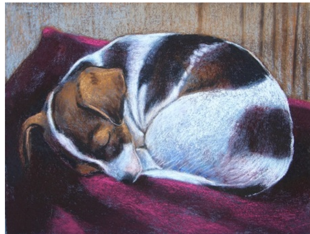
Slapen, 2019 pastel , 23x30 cm