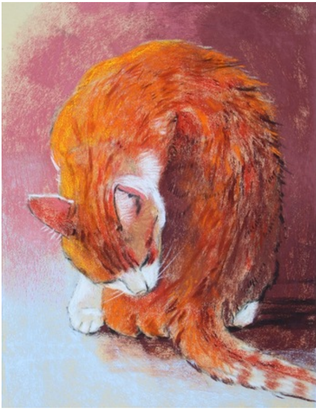
Poes, 2019 pastel , 30x23 cm