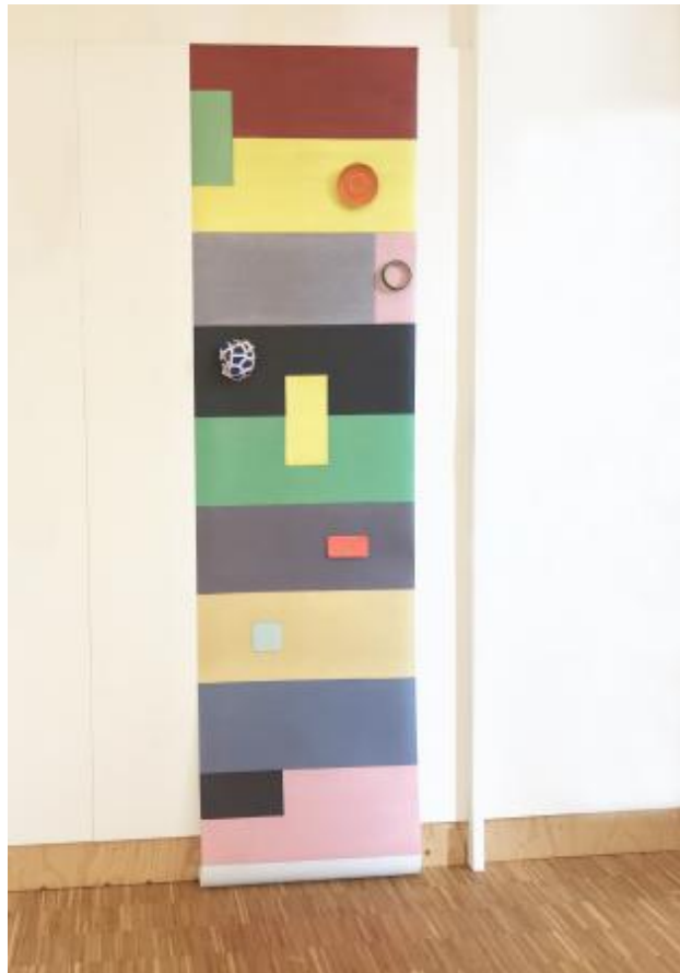
behang ontwerp in opdracht van Studio DNNK, 2022 gemengde technieken, 300 x 80 cm