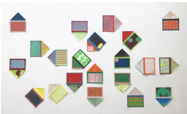
21 happy envelopes, 2024 gemengde technieken, 200 x 210 cm