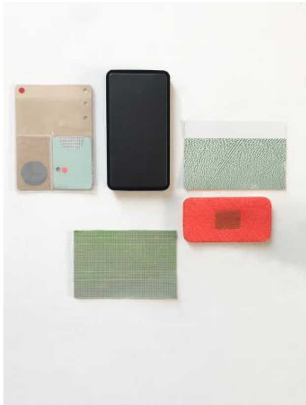
quintet, 2022 gemengde technieken , 50 x 50 cm