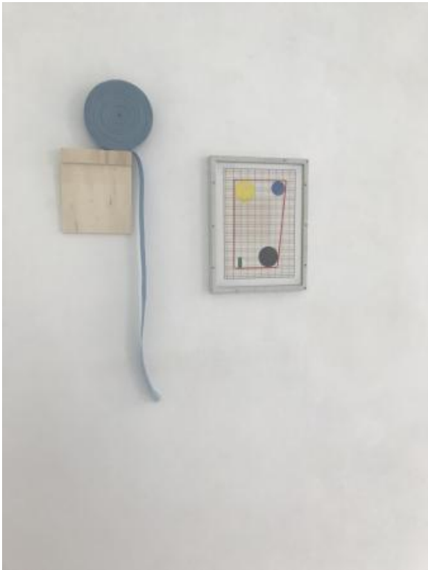
samenspel, 2024 gemengde technieken, 36 x 30

2008 - verantwoordelijk voor www.vitrineonline.nl 2016