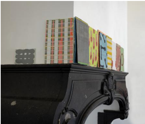
robe bleu, fond rouge, 2021 acryl op papier