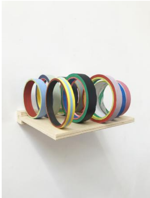
nep tape object, 2024 acryl verf, 20 x 20 x 15 cm