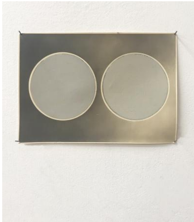
dubbelportret van een cirkel, 2023 acryl op papier, 10 x 15 cm