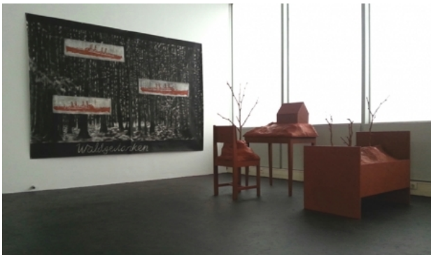
Stuhl, Tisch, Bett., 2015 div. materialen