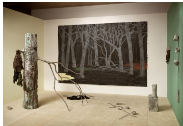
Time past in time present, 2017