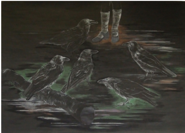
Klein meisje met grote vogels, 2010 gemengde techniek op papier, 147 x 208 cm