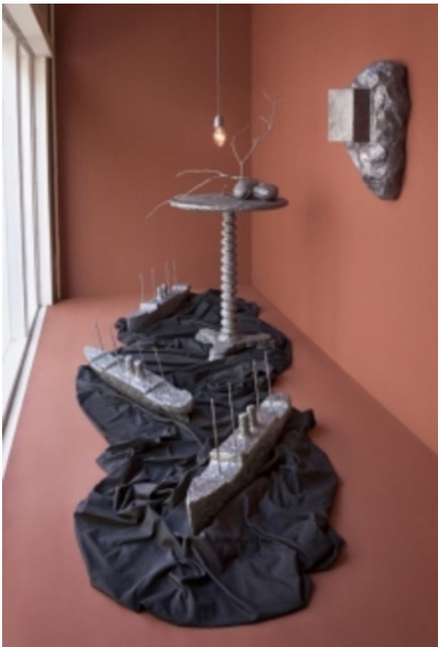
Night crossing, 2017 div materialen

2005 - -- secretaris stichting Ruimtevaart Loopt nog