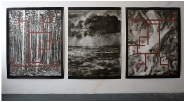
zonder titel, 2013 gemengde techniek op papier, 200x150 cm