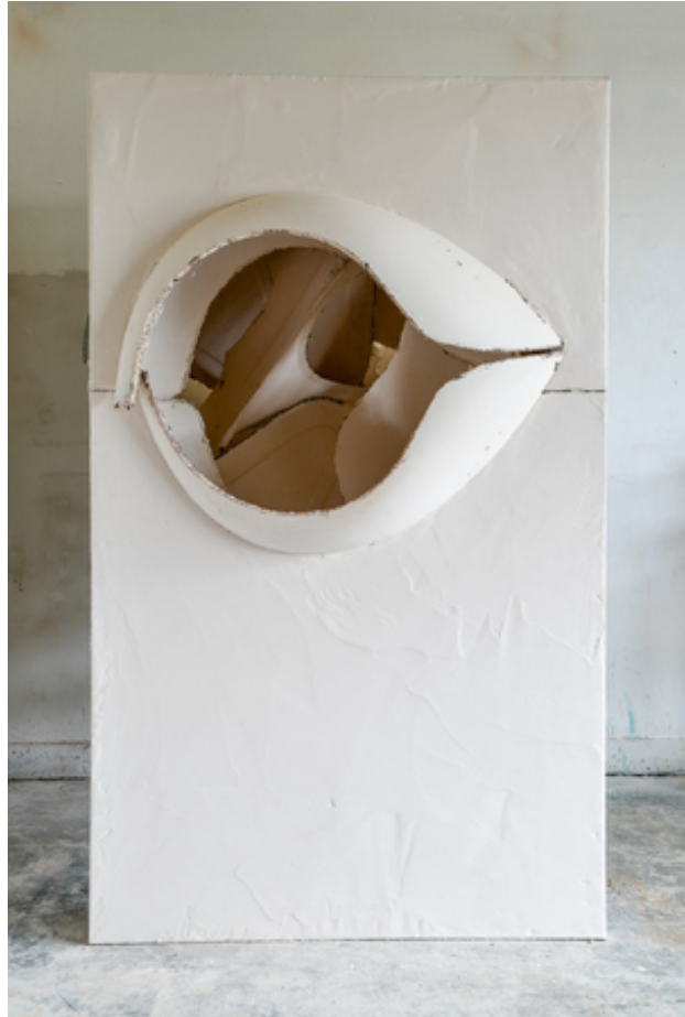
Inner vision, 2020 Acrylic One, 125 x 165 x 245cm.