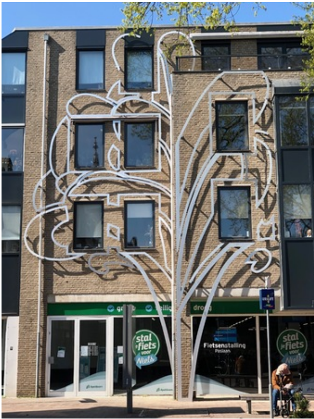
Boom der vrijheid, 2020 Aluminium, 1200 x 700 x 20cm.