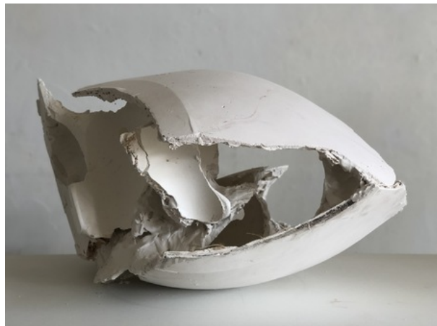
headouselight 011, 2019 gips, 70 x 80 x 35cm.