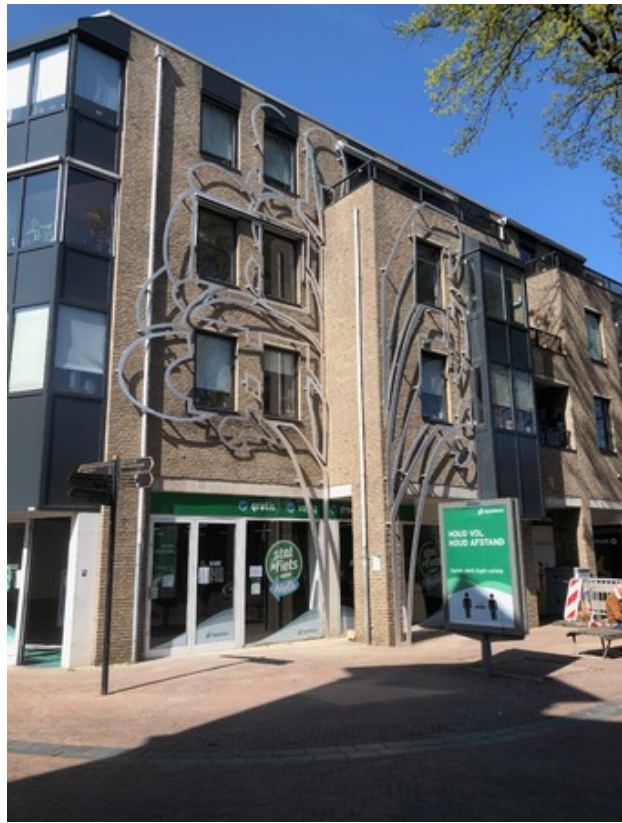
Boom der vrijheid, Zijaanzicht), 2020