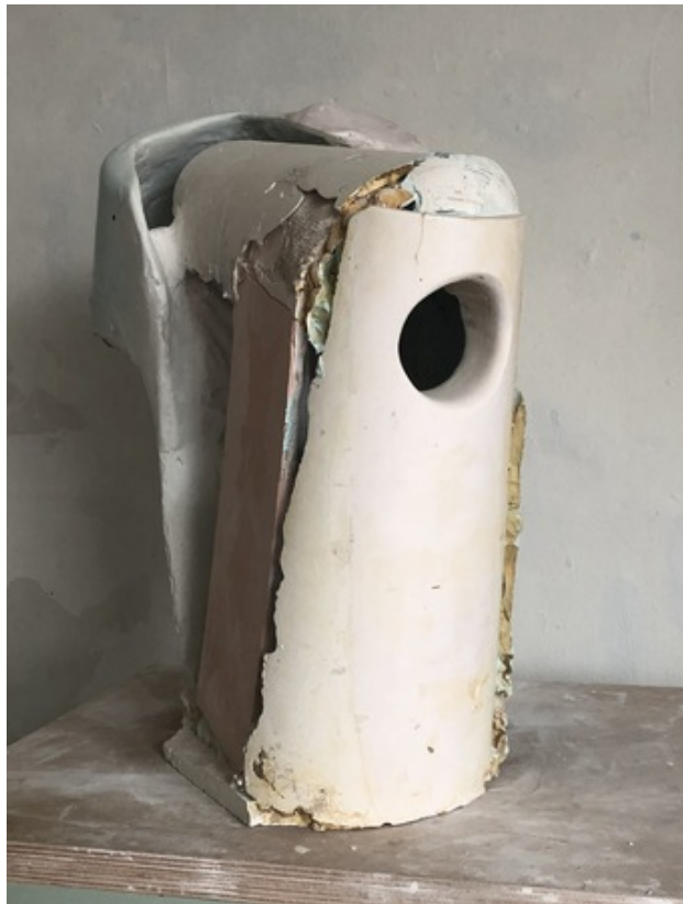
Headhouselight 04, 2018 gips, pigment, 80 x 70 x 40cm.