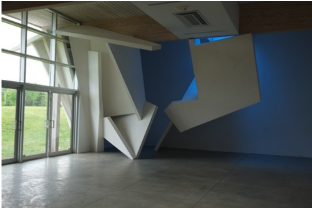
persona, 2017 hout, gipsplaat, gips, blauw folie, 15 x 5 x 3.5 meter