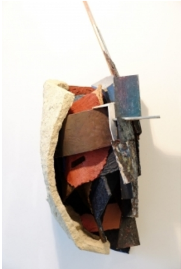
Masker, 2013 hout, karton, olieverf, 140 x 50 x 50cm.