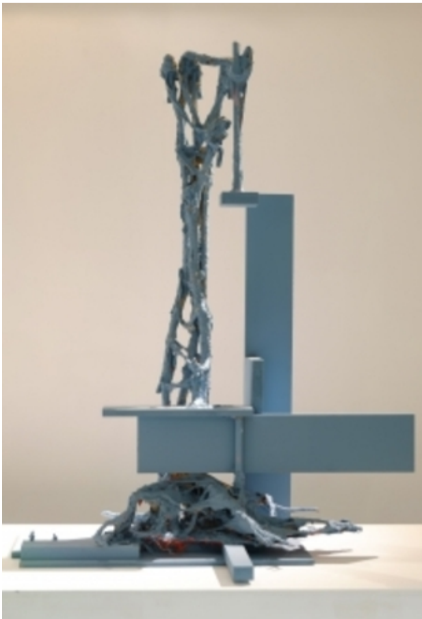
Nature loves modernism, 2013 takken, MDF, latex verf, 140 x 70 x 40cm.