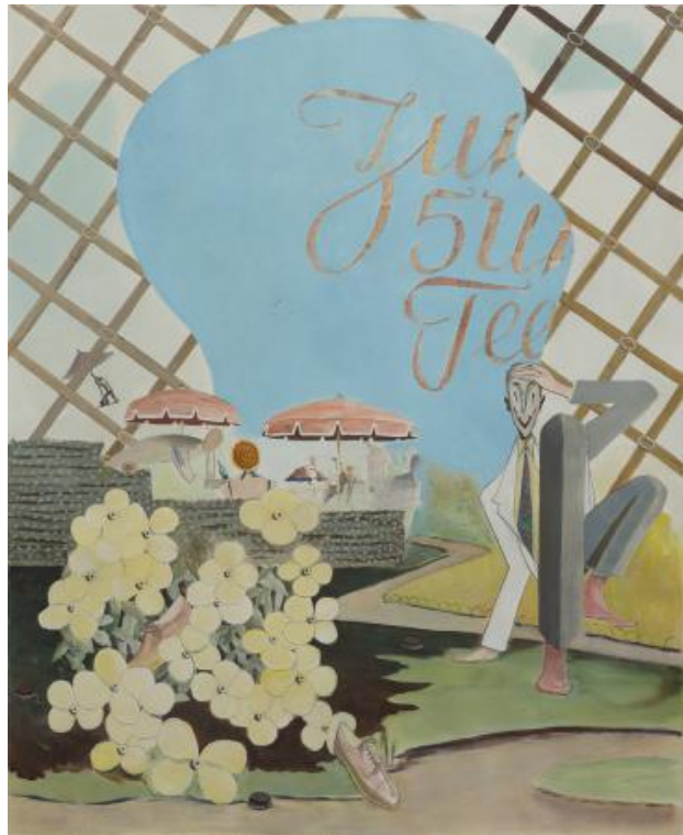
Heile Welt, 2019 acryl op papier, 158 x 130 cm