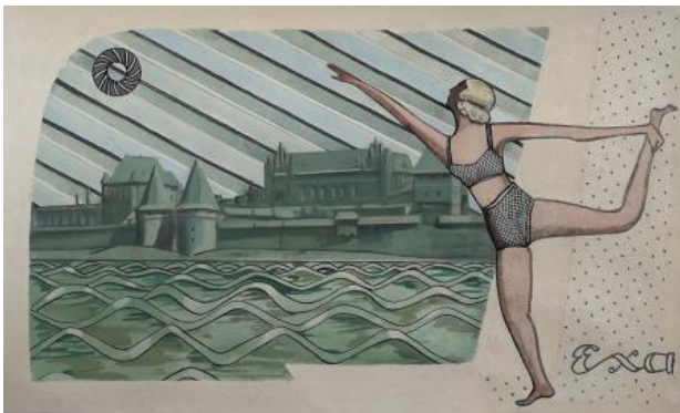
Acht Schwestern (III), 2019 gouache, 31,5 x 52,5 cm