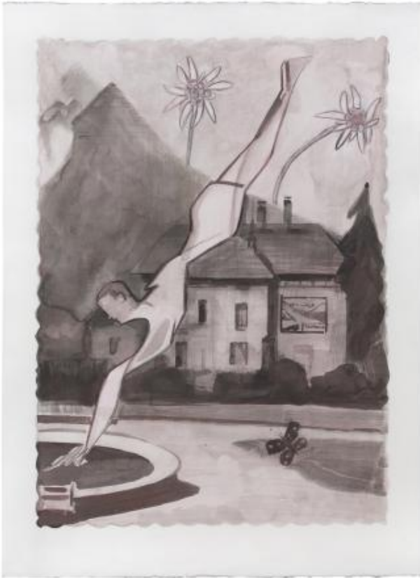
Ballade (V), 2021 inkt en kleurpotlood, 76 x 56 cm

-- -- -- illustratiewerkzaamheden Loopt nog