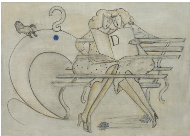
Duo, 2019 gouache, 30 x 41 cm