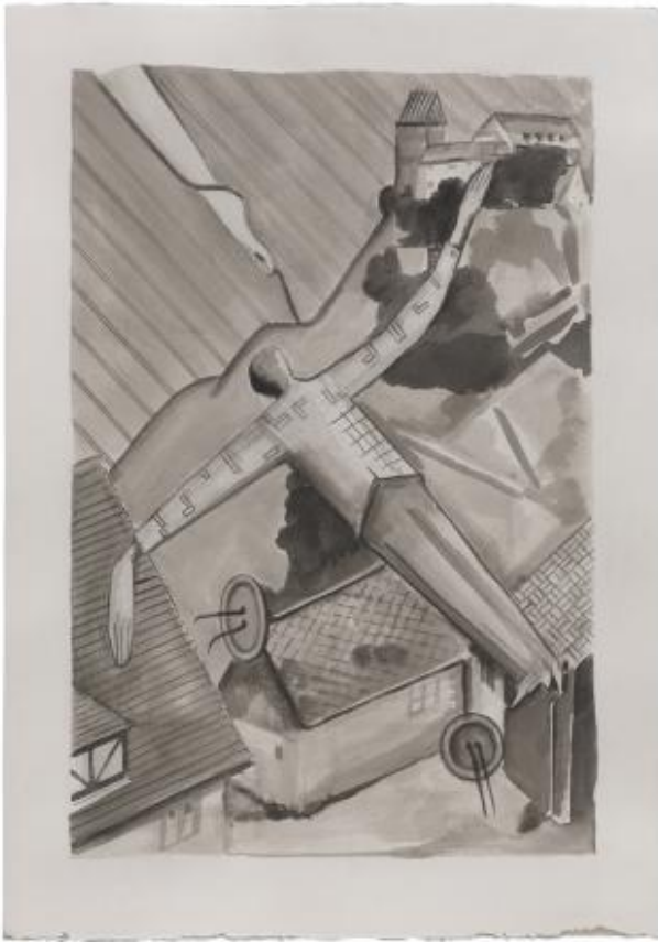
Intermezzo (II), 2020 inkt, 70 x 51 cm