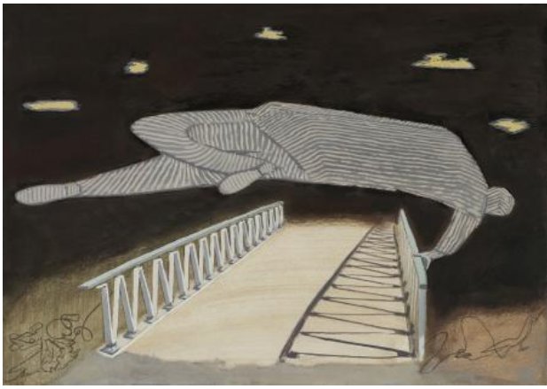
Elf Brüder (I), 2019 gouache, 30 x 48 cm