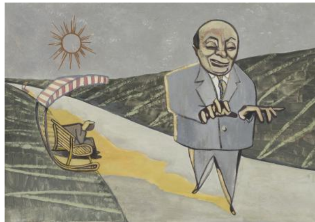
Elf Brüder (III), 2019 gouache, 30 x 48 cm