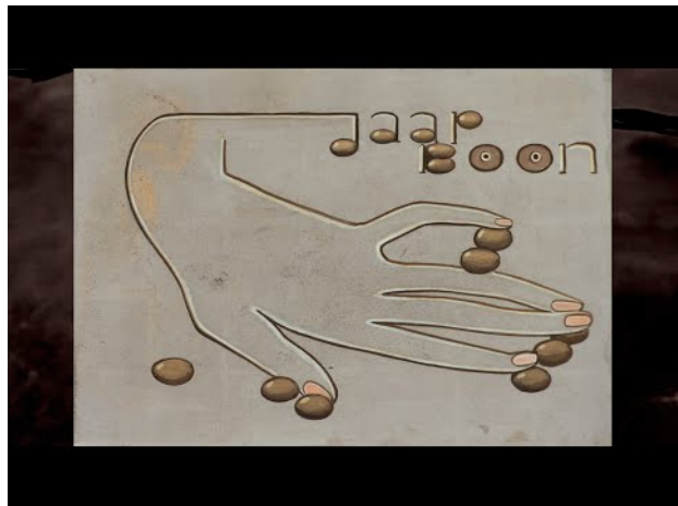
Jaap Boon, 2020 29:55