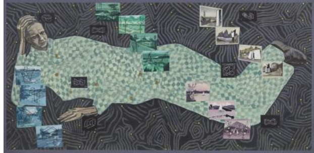
Mon Frère, 2021 acryl op papier, 300 x 150 cm