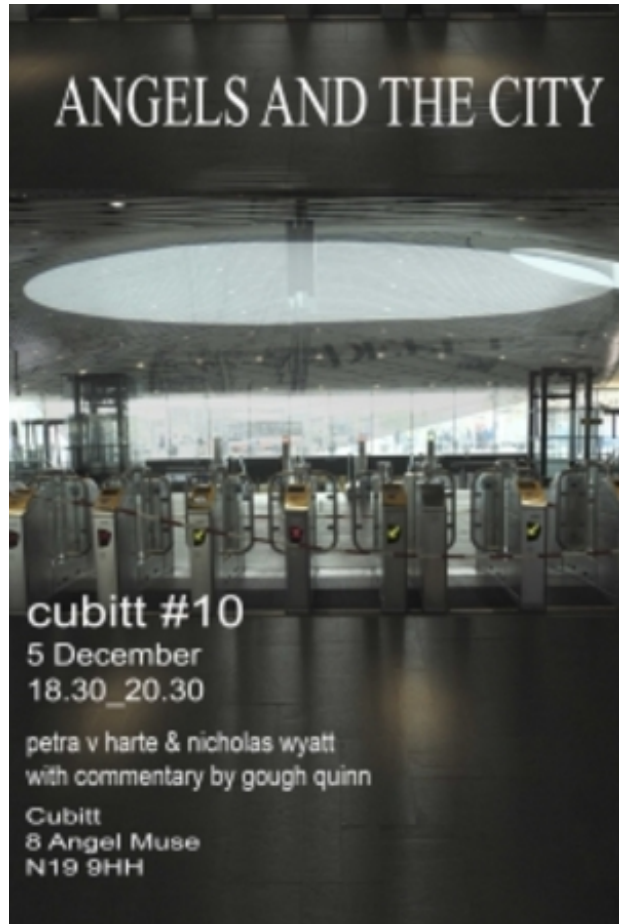
ANGELS and THE CITY at CUBITT LONDON, 2020 fotos