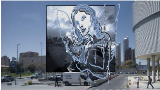
as above so below, 2022 C print, 100cmx69cm