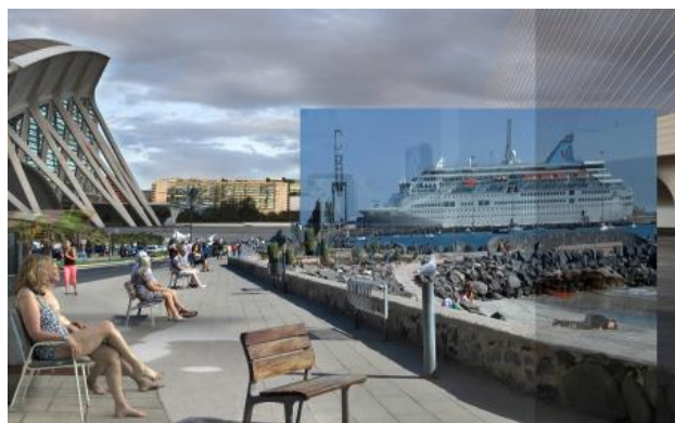
Boot, 2021 C print, 157x100cm