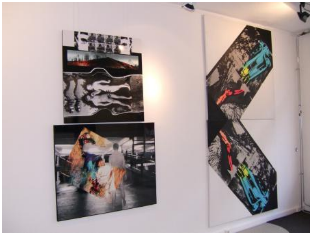
tentoonstelling, 2021 C print zeefdruk, 3 x 15