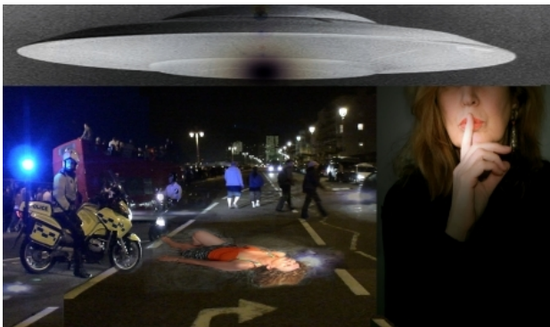
Scene from tomorrow, 2019 C print