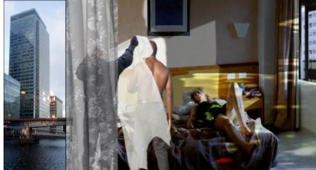
Dog Day, 2022 C print, 140 x 80