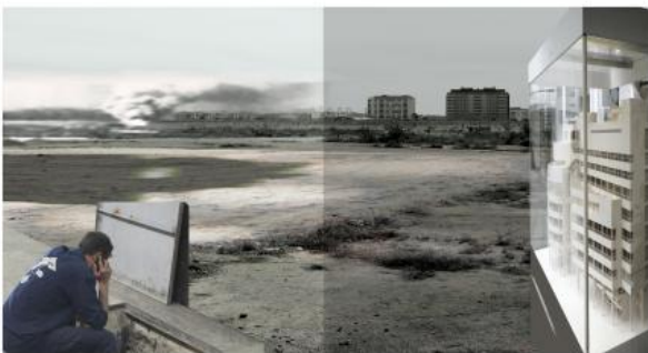
the grand view, 2021 C-PRINT, 100x140