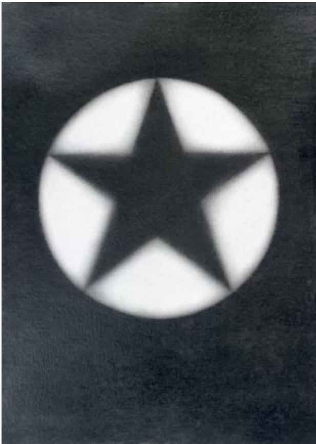
z.t., 2022 0,3 mm potlood op papier, 30 x 21 cm.