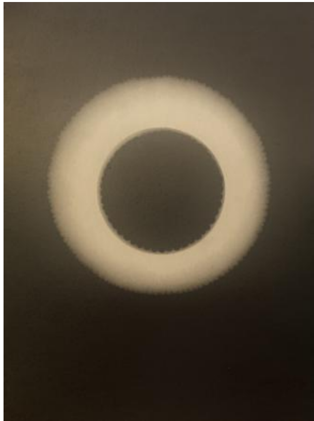
'from 27.08.2008 till 17.02.2022- left side', 2022 0,3 mm potlood op papier, 30 x 21 cm.