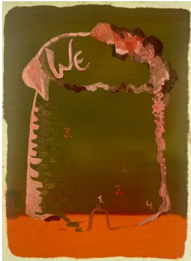
interieur - exterieur serie-no: , 2022 olieverf op papier, 21 x 14,8 cm.