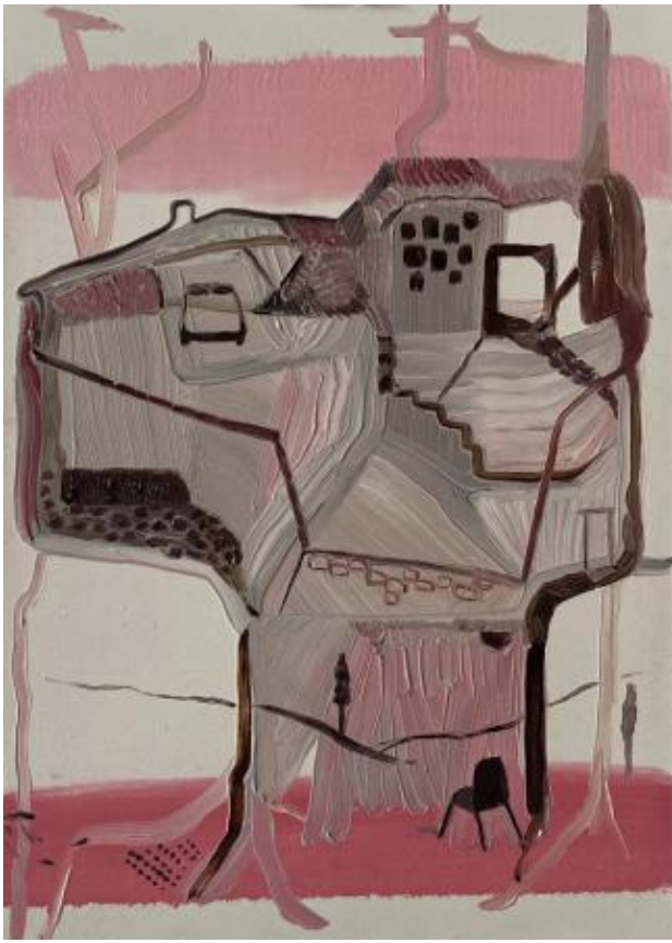
interieur - exterieur serie-no: , 2022 olieverf op papier, 21 x 14,8 cm