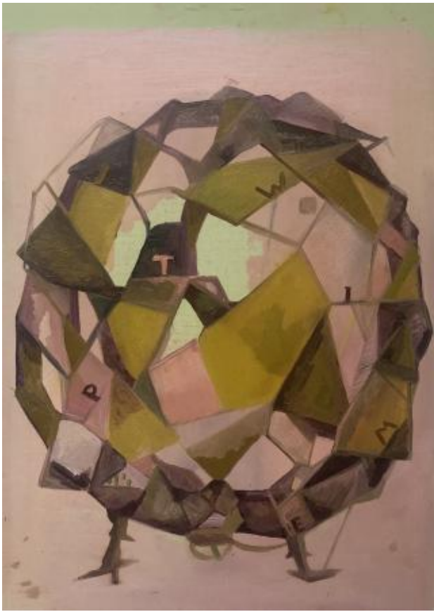
interieur - exterieur serie-no: , 2022 olieverf op papier, 21 x 14,8 cm.