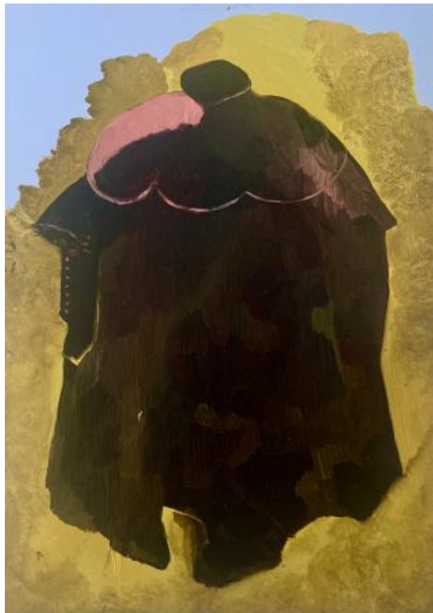
interieur - exterieur serie-no: , 2022 olieverf op papier, 21 x 14,8 cm.