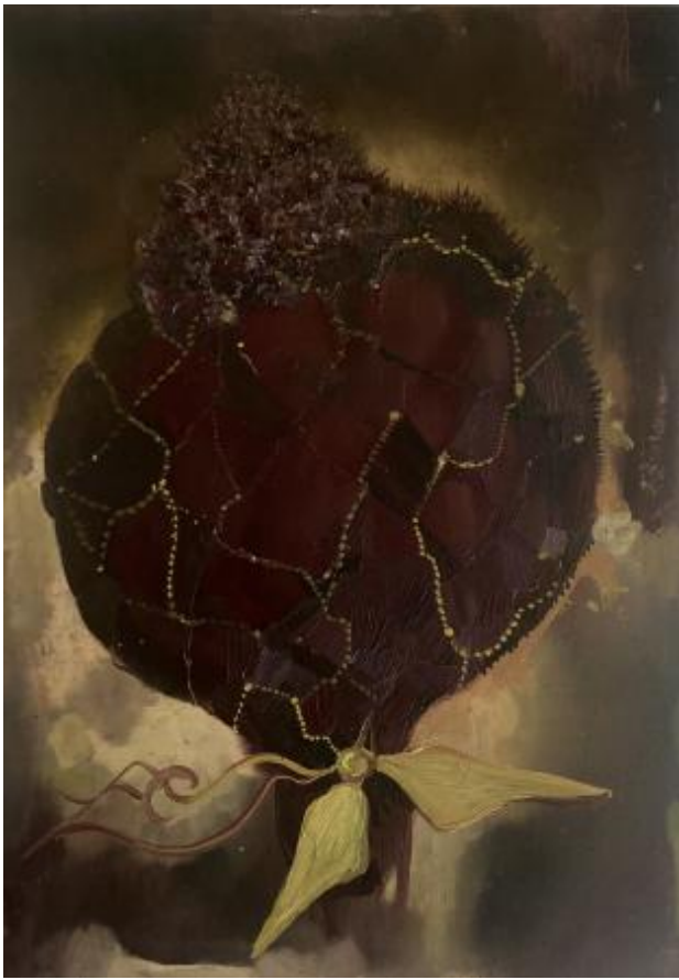
z.t., 2022 olieverf op papier, 21 x 14,8 cm.