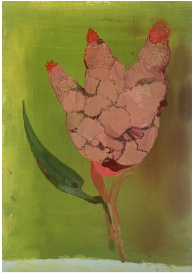
z.t., 2022 olieverf op papier, 21 x 14,8 cm.