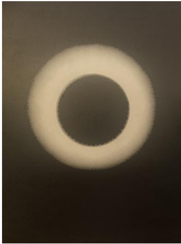
'from 27.08.2008 till 17.02.2022- left side', 2022 0,3 mm potlood op papier, 30 x 21 cm.