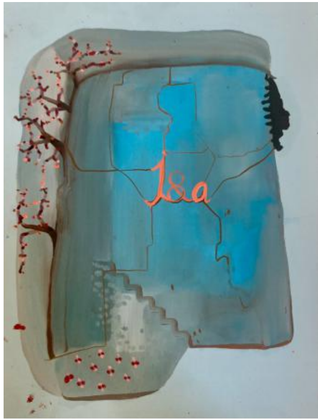
interieur - exterieur serie-no: , 2022 olieverf op papier, 21 x 14,8 cm.