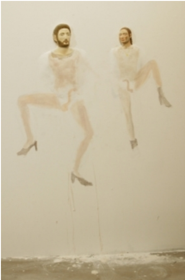
untitled, 2012 hout, gips, oil color, dimensions of the