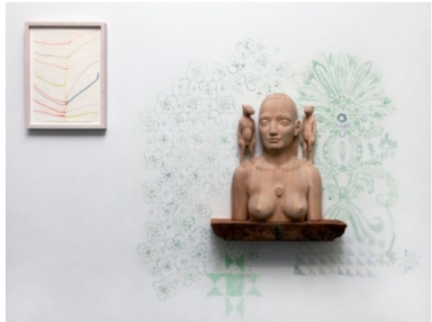
if you were coming in the fall, 2012 linden hout, acryl op de muur