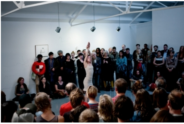
the restless gods, 2014 performance