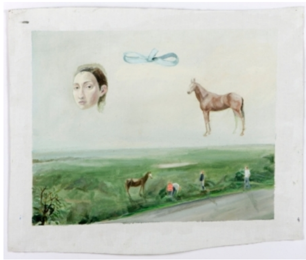
untitled, 2013 olieverf op linnen