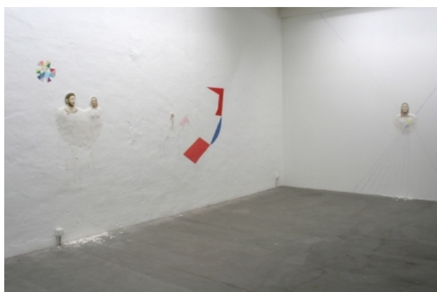
the seven joys of mary, 2010