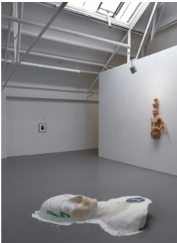
and live is over there, 2014