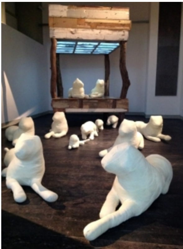
Allegory Splinter Revisited, 2016 Mixed Media, 3,2 x 6 m