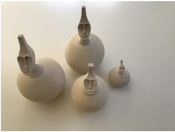
African Nuptials, 2023 Ceramic Clay, 0,4 m x 0,3 m