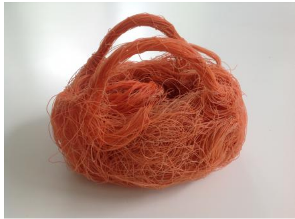
Luxury Nature Goodie Bag, 2020 Garbage material, 0,3 x 0,4 m