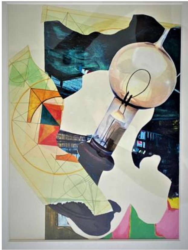
Wolfram I, 2023 pencil mixed technics, 0,4 x 0,25 m