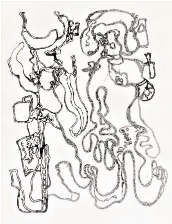
Healer I, 2022 Oilpainting on acrylic foil, 1,2 x 0,8 m