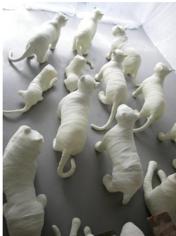
Heaven Revisited, 2016 Video Installation, 1,8 x 2,8 m