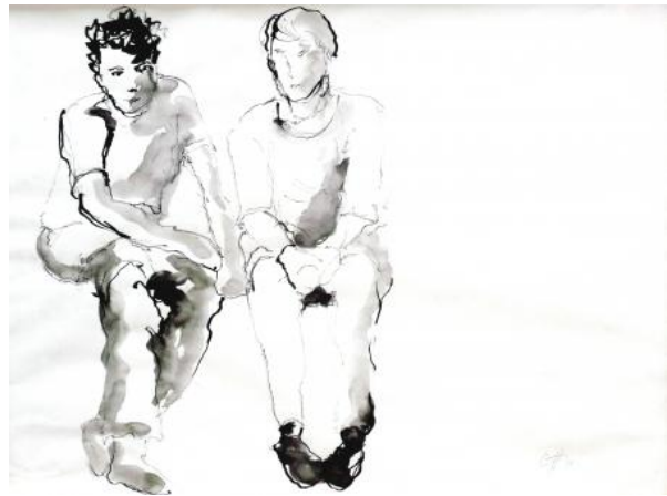
Not about You, 2016 Ink, 0,6 x 0,8 m