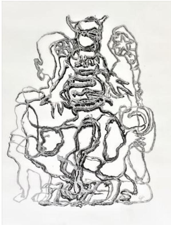
Healer III, 2022 Oilpainting on acrylic foil, 1,2 m x 0,8