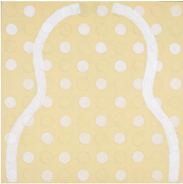
ZT, 2022 Acryl op paneel, 30 x 30 cm