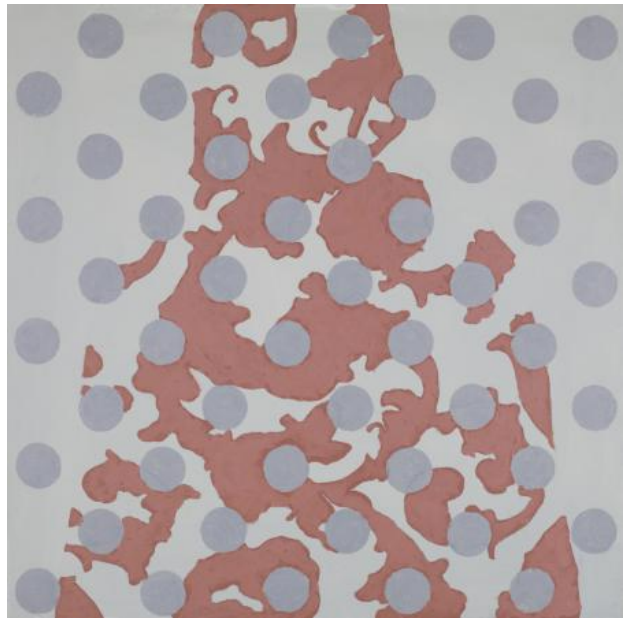
ZT, 2022 Acryl op paneel, 30 x 30 cm