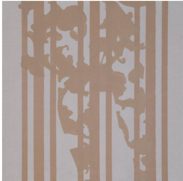
ZT, 2022 Acryl op paneel, 30 x 30 cm