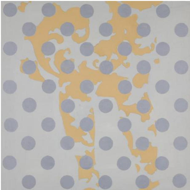
ZT, 2022 Acryl op paneel, 30 x 30 cm