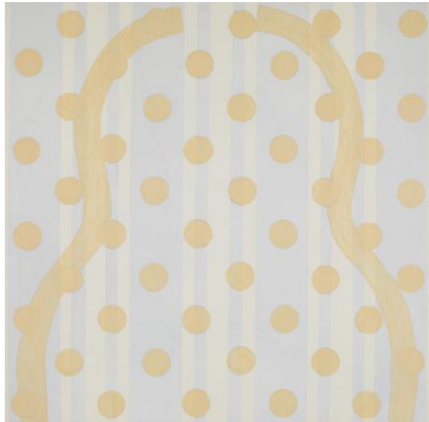
ZT, 2022 Acryl op paneel, 30 x 30 cm