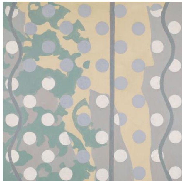
ZT, 2022 Acryl op paneel, 30 x 30 cm