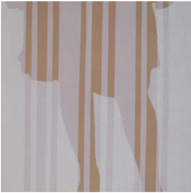
ZT, 2022 Acryl op paneel, 30 x 30 cm