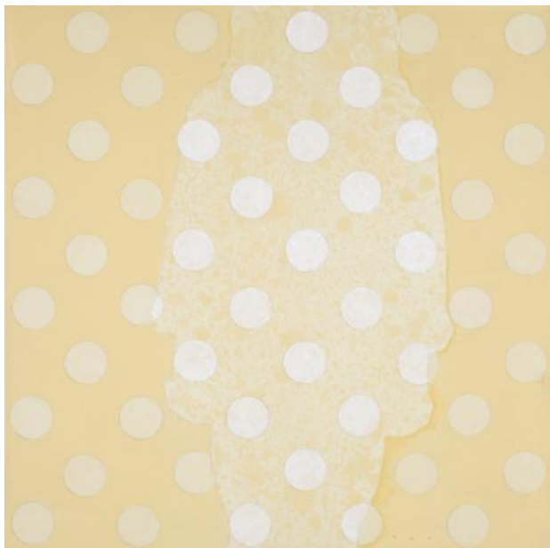
ZT, 2022 Acryl op paneel, 30 x 30 cm