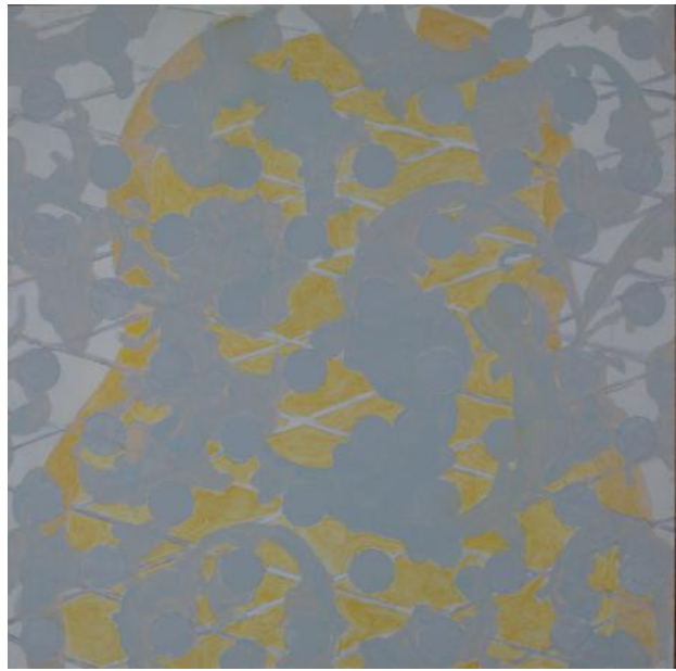
ZT, 2022 Acryl op paneel, 30 x 30 cm