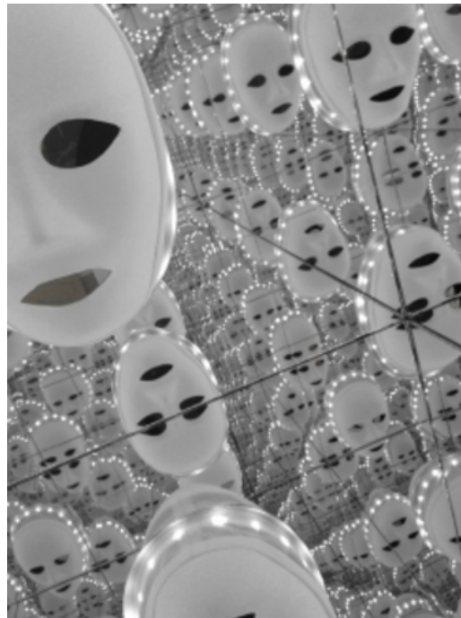
Ik heb zo wa-wa-wa-waanzinnig gedroomd, 2017 Gemengde techniek, 50 x 50 x 50 cm