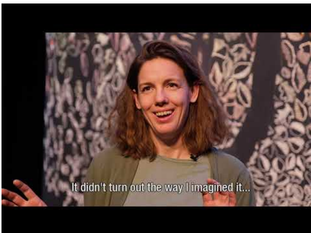
Honderdduizend bomen en een bos van draad, 2021 00:17:21