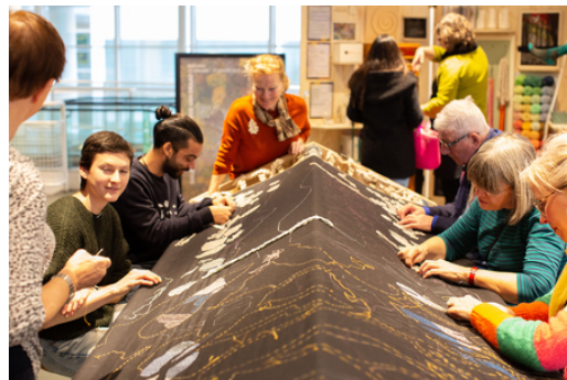
Honderdduizend bomen en een bos van draad, 2020 borduurwerk, 30 x 4 meter