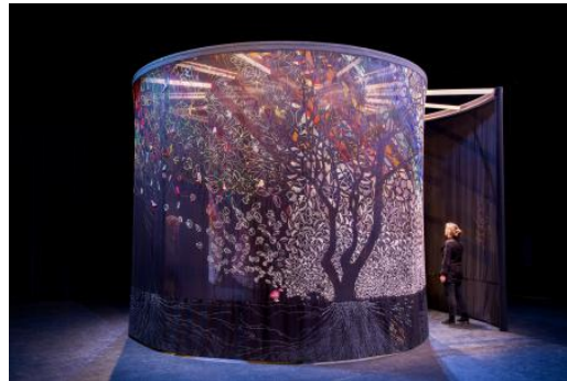
Honderdduizend bomen en een bos van draad, 2021