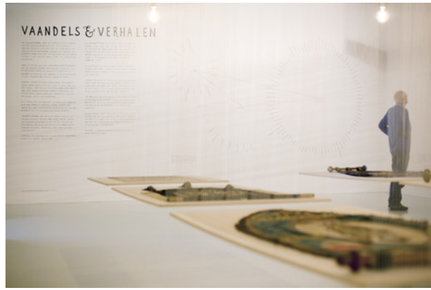
Vaandels en Verhalen, 2017 Gemengde techniek, twee museumzalen vol