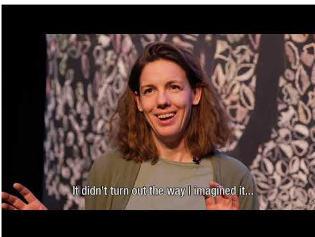
Honderdduizend bomen en een bos van draad, 2021 00:17:21