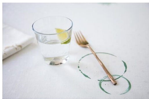
SUSTAINED, 2019 machinaal borduurwerk en handmatige zeefdruk, divers