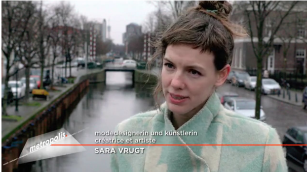
Metropolis Den Haag, 2017 11 min.