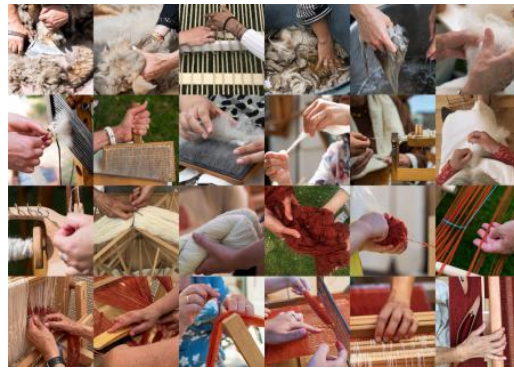
Van Kade tot Zelfkant, 2022 Diverse technieken, 69 x 944 cm