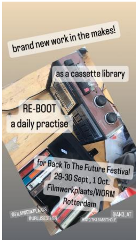
Re-Boot , the cassette library, 2023 tapes/installatie