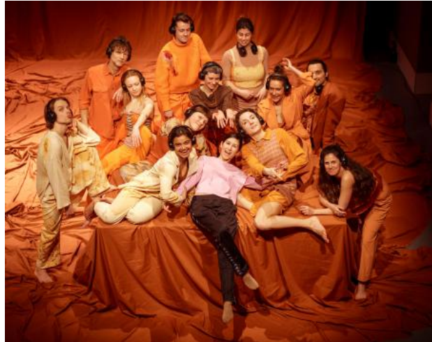
I never wanne dance again, 2024 performance