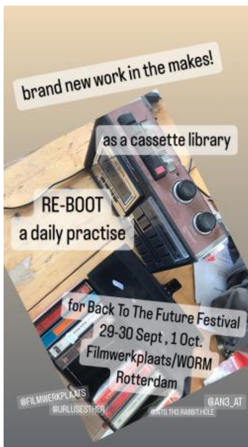
Re-Boot , the cassette library, 2023 tapes/installatie