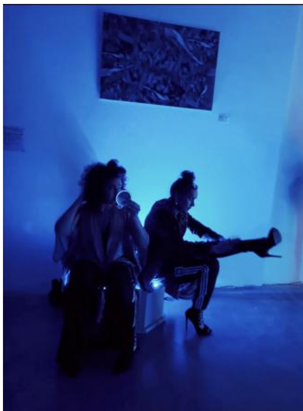
Serendipity, 2023 performance