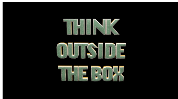
Think outside the Box, 2022 08min40sec