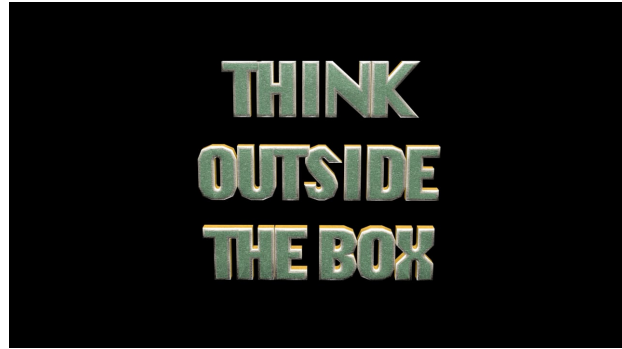
Think outside the Box, 2022 08min40sec