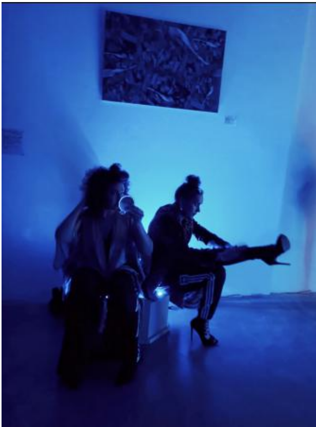
Serendipity, 2023 performance