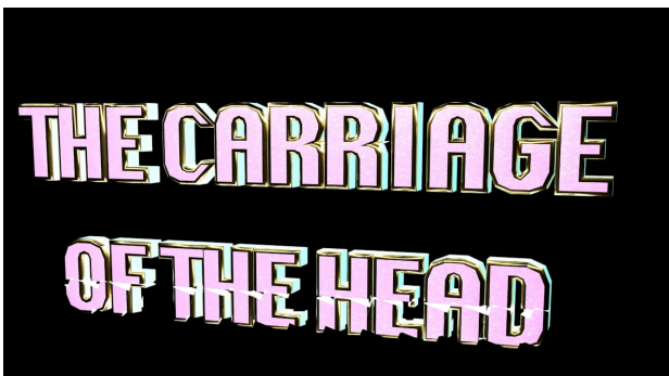
int0.th3.rabbit.h0le, 2022 10-15 min.