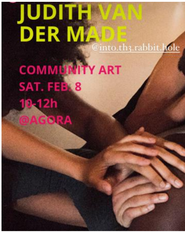
what if we redefine words by experiencing them with our bodies , 2025 community art