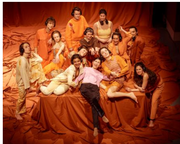
I never wanne dance again, 2024 performance