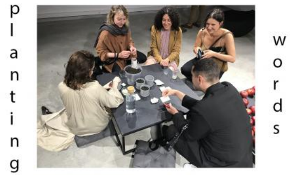
Planting Words, 2022