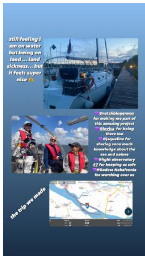
Light Observatory #8, 2023