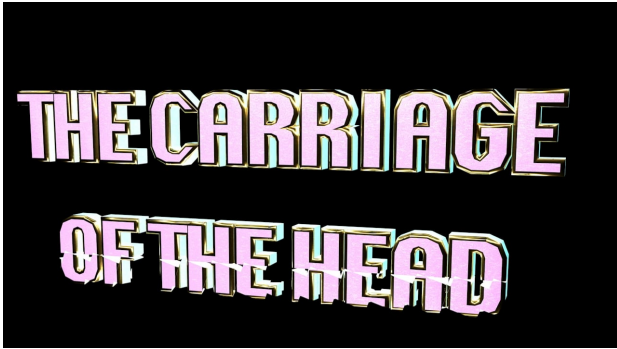
int0.th3.rabbit.h0le, 2022 10-15 min.