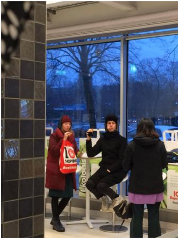
LUDIC, 2022 foto, A0