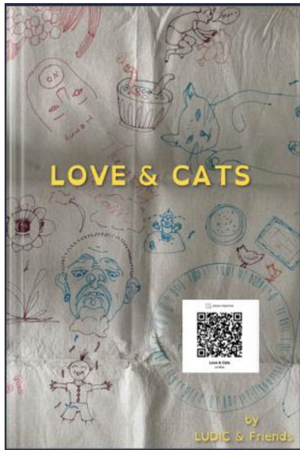
Love & Cats, 2024 online audio visual book, online audio visual book