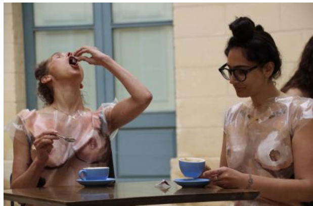
My Body (is)/(not) Your Business Card, 2023 performance