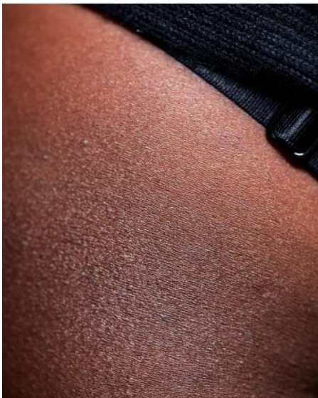
COLOUR, 2024 digitale fotografie, materiaal variabel, variabel