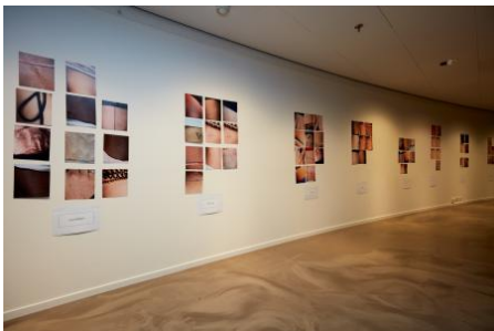
Workshop algoritmisch denken met fotografie, 2024