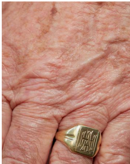
COLOUR, 2024 digitale fotografie, materiaal variabel, variabel