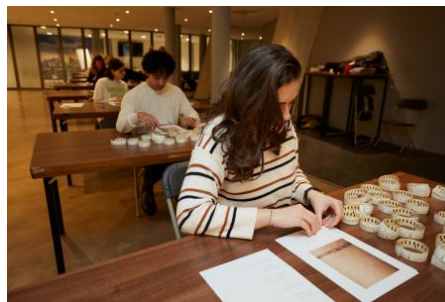
Workshop algoritmisch denken met fotografie, 2024