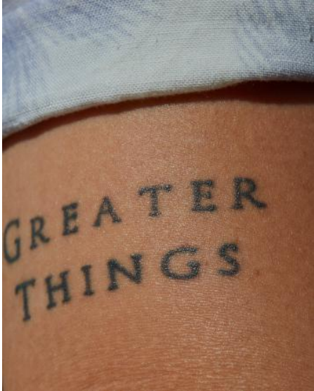
COLOUR, 2024 digitale fotografie, materiaal variabel, variabel