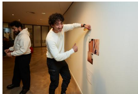
Workshop algoritmisch denken met fotografie, 2024