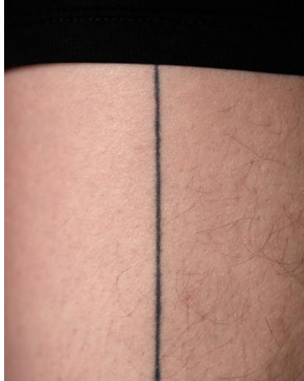
COLOUR, 2024 digitale fotografie, materiaal variabel, variabel