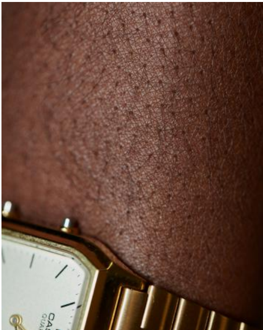
COLOUR, 2024 digitale fotografie, materiaal variabel, variabel