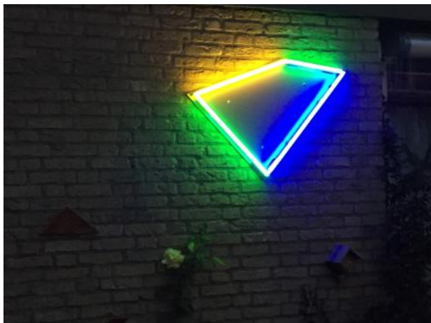
Four corners , 2020 Neon kunststof , 90x90x10