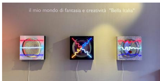
Bella Italia , 2021