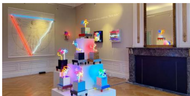
Il mio mondo di fantasia e creativit. , 2021