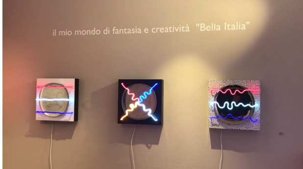
trim.1C353BB7-0831-4F92-B9D7-1D2069721083, 2021 3.15