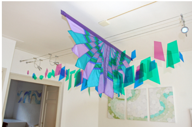
Fandance, 2014 Mixed media