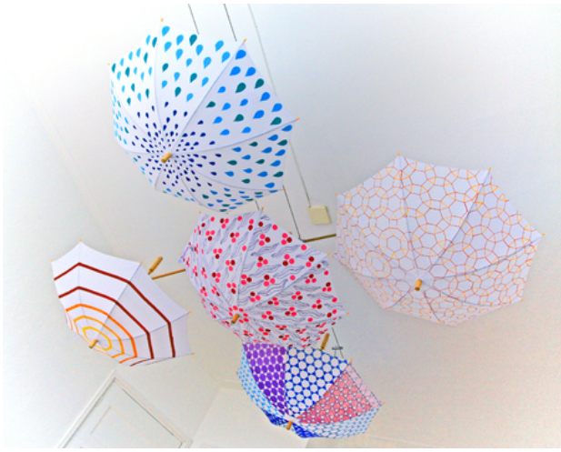
Installatie, 2018 Mixed media