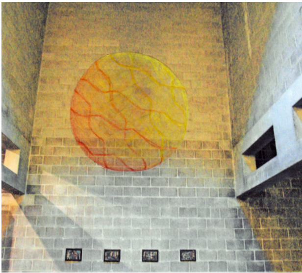
Ontwerp voor muurschildering, 2014 Acryl verf op baksteen, 2.70x2.70 m