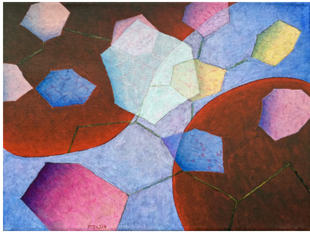
'Flying Out of a Pattern I'. , 2014 Acrylic on canvas. , 30x40 cm