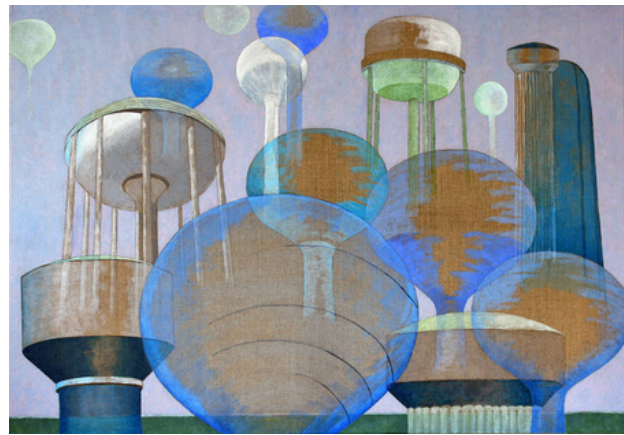
'Water Towers USA', 2015 Acrylic on canvas. , 95x65 cm