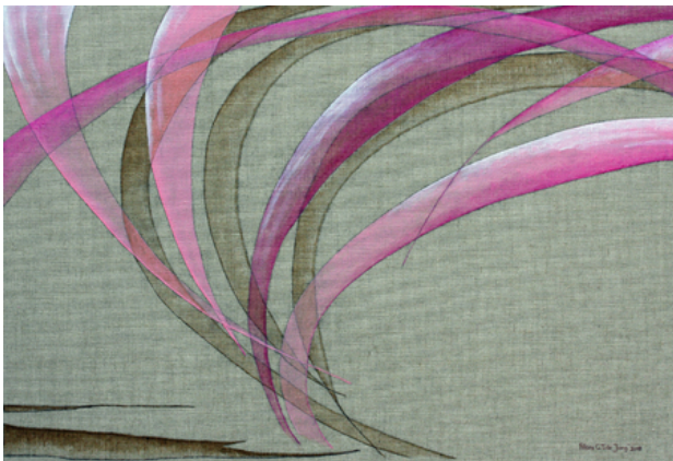
'My Japanese Cherry', 2018 Acrylic on canvas., 65x95 cm