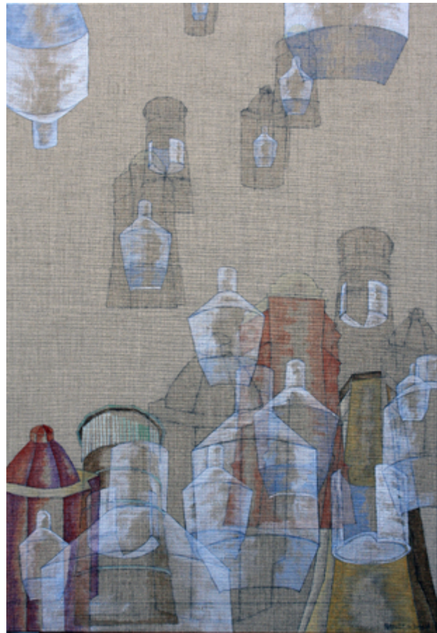
'Water Towers Holland', 2016 Acrylic on canvas. , 95x65 cm