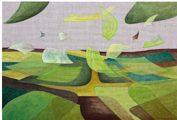
'Flying Out of a Pattern III', 2018 Acrylic on canvas. , 65x95 cm