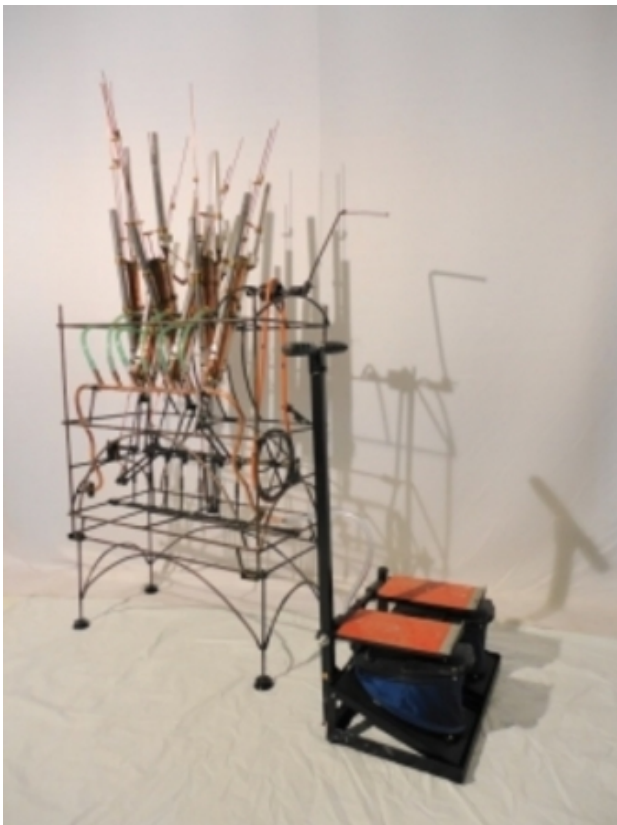
fluitconcert, 2013 kinetisch werk, 175 x 120 x 40