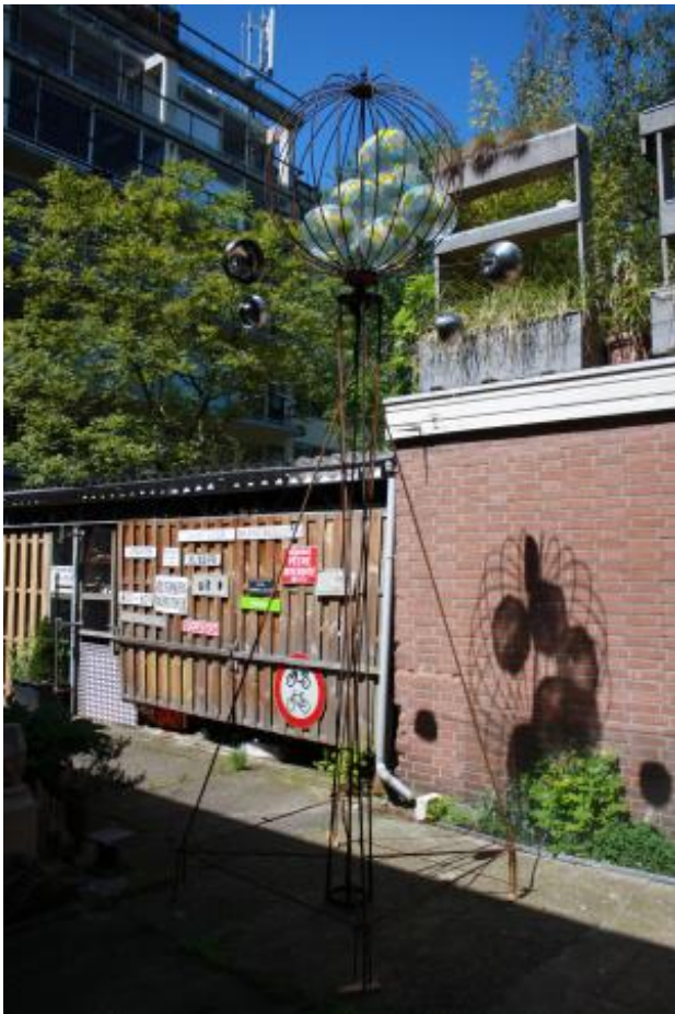
Amechtige aarde, 2021 kinetisch werk, 450x 120 x 120 cm.