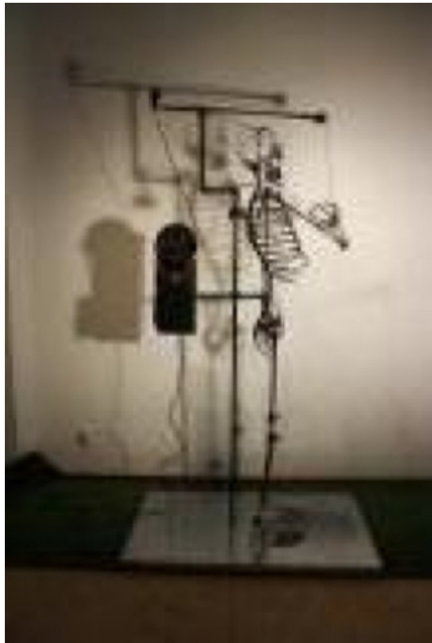
Eva eet de appel a.d.2011, 2011 kinetisch werk, 220x 100x60