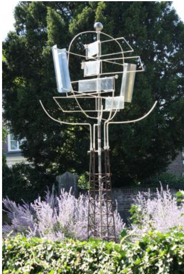
ontmoeting der winden, 2016 kinetisch werk, 100x100x350