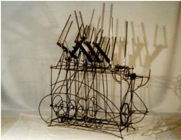
't Orgel, 1991 Kinetisch. Werk, 160 x 150 x 70 cm