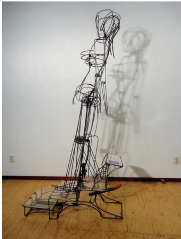
Nude decendent un escalier, 2017 kinetsch werk, 100 x 50 x 200 cm.