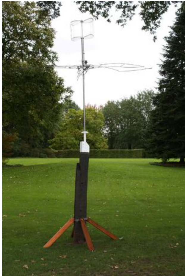
Albatros, 2019 kinetisch werk, 400 x 100 x 75 cm.