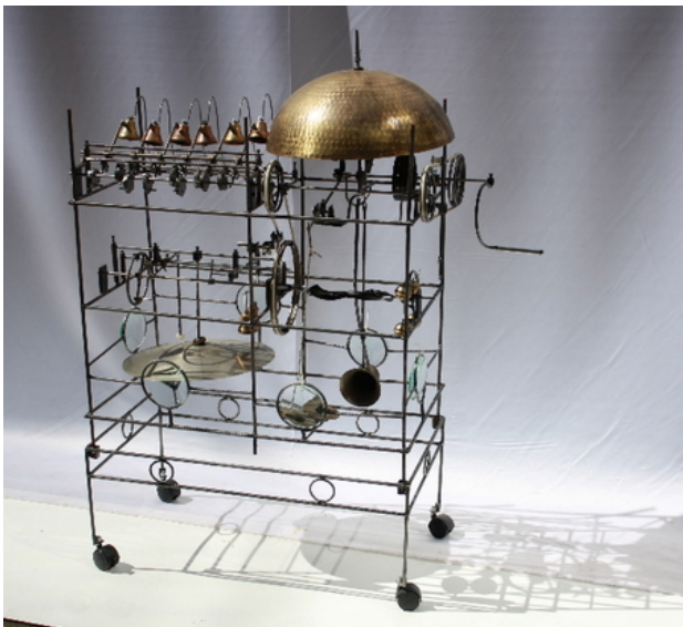
On Sonne, 2019 Kinetisch. Werk, 110 x 40 x 100 cm.