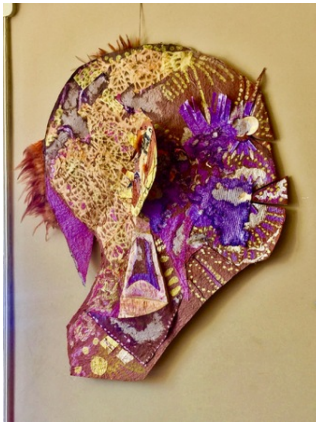
Geld heeft geen oren maar het hoort, geen benen maar het loopt, flat ears, 2019 papier gemengde technieken, 60x90cm