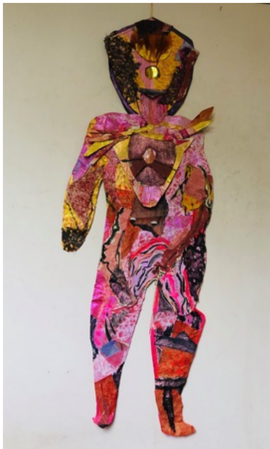
I came to say goodbye, 2019 handmade paper gemengde techniek, 57x 140 cm