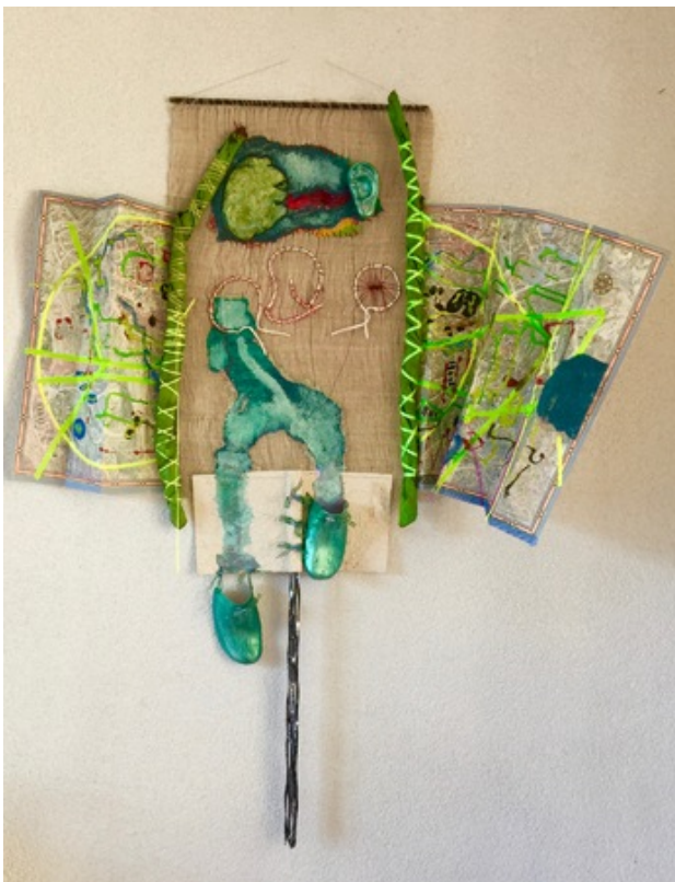
duurzame stad, 2019 gemengde technieken met papier en shifu, 75cmx90 cm