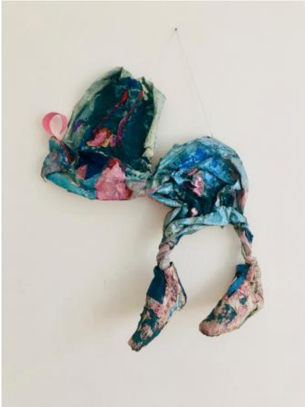
opgroeien in Niemandsland, 2021 Japanse papier technieken, 50x75 cm

1999 - onderzoek naar oude papier technieken in 2019 Centraal Azie Loopt nog