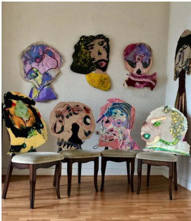
A meeting discussing the future of paper, 2018 hand made paper, 2 meter x3 meter geïnstalleerd op stoelen en aan de muur