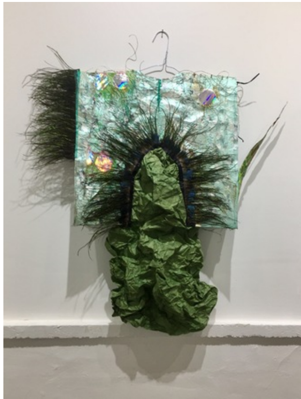
De natuur houdt van recycling, 2017 hand gemaakt papier +gemengde technieken, 64x 87 cm