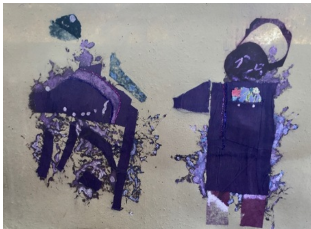
Dit was een huis, 2019 papier schilderij, 100x140cm