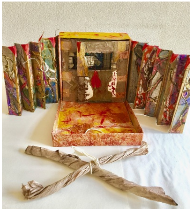
walls are crumbling, 2018 stand on table, artist book, 80x 70cm