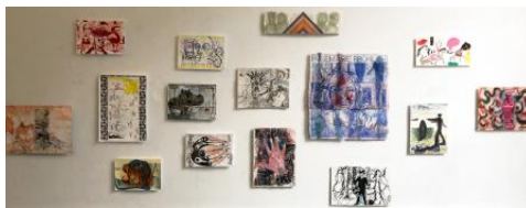
TATO(A)GE expo, 2023 werken op papier, verschillend