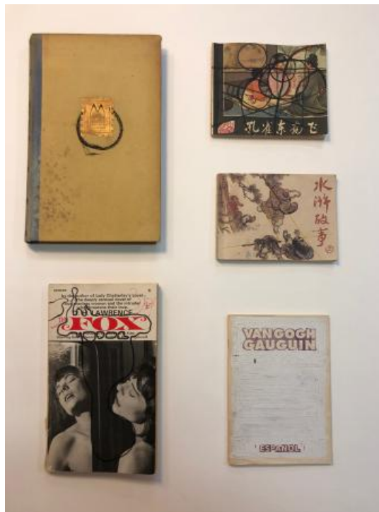
5 kunstenaarsboeken, 2022 inkt en tip-pex in/op boeken, various