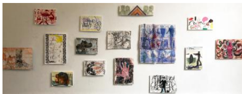
TATO(A)GE expo, 2023 werken op papier, verschillend