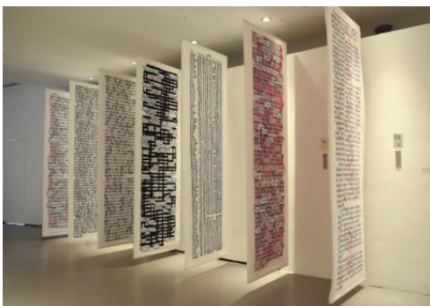
Read the Image, 2022 ink and print on paper, 12 x 3 m