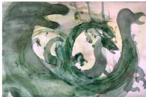
Untitled (dragons), 2022 aquarel, 62 x 48 cm