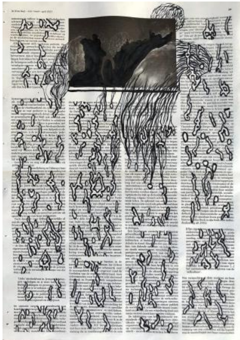
Mininter, 2023 inkt on magazine page, 42 x 30 cm