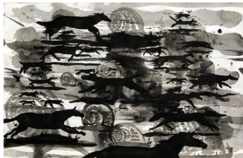
Untitled (race), 2023 Oostindische inkt op papier, 32 x 50 cm