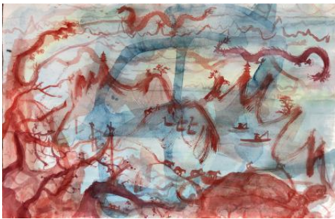
Untitled (Chinese landscape), 2022 aquarel, 54 x 38 cm