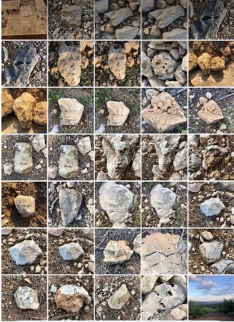
Piedras series, 2023 fotografie