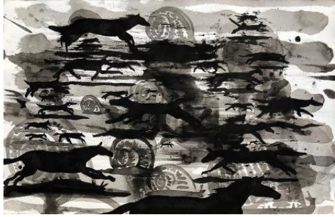
Untitled (race), 2023 Oostindische inkt op papier, 32 x 50 cm