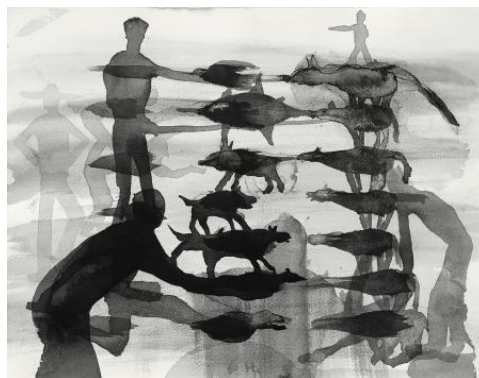
Untitled (animals), 2021 oostindische inkt op papier, 25 x 32 cm