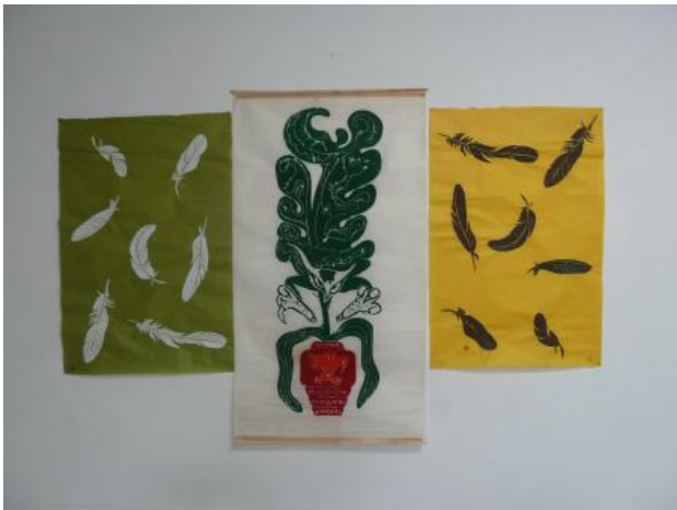
Attack, 2022 coloured woodcut's on Hanji paper, 150 x 200