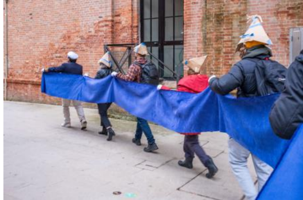
'Celestial Salutations', 2024 Costume Performance guided by march music