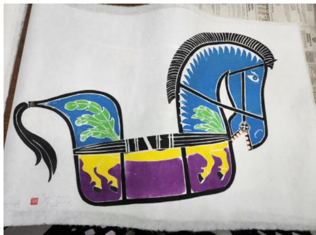
Jaran Kepang/Kuda Lumping, 2023 Kleuren Houtsnede op Koreaans Hanji papier, 90x70 cm