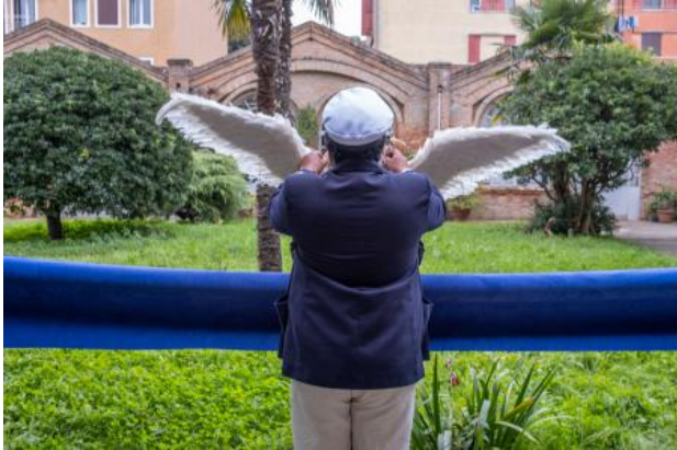
'Celestial Salutations', 2024 Costume Performance

1991 - -- Voorzitter stichting B 141 ateliercomplex in Den Haag Loopt nog