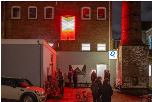
St. Andreas waakt over ons, 2024 Licht en geluidsinstallatie, Gevel Quartair gebouw