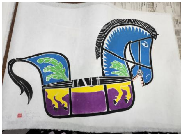
Jaran Kepang/Kuda Lumping, 2023 Kleuren Houtsnede op Koreaans Hanji papier, 90x70 cm