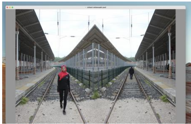
'On the right track', 2024 foto print op kunstzijde, 200cm x 130cm