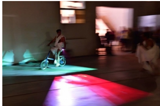
Hot Sand, 2018 video-performance, nvt