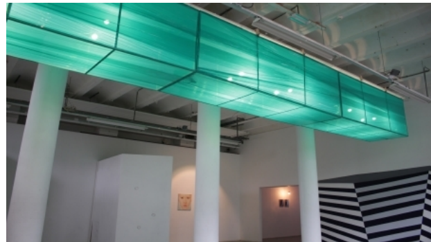
Verlichte Gracht Bovenlangs, 2018 licht installatie, 10x1x1 meter