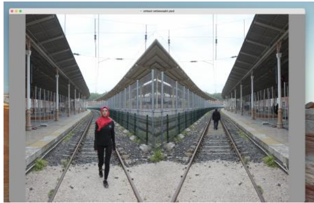
'On the right track', 2024 foto print op kunstzijde, 200cm x 130cm