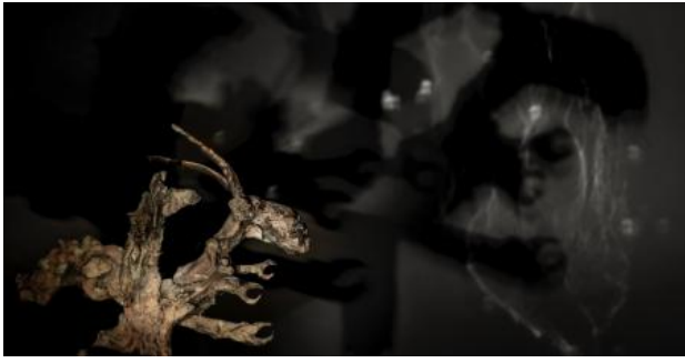
Blinded by the light, 2023 brons en licht, 2.00 x 2.00 x 2.00