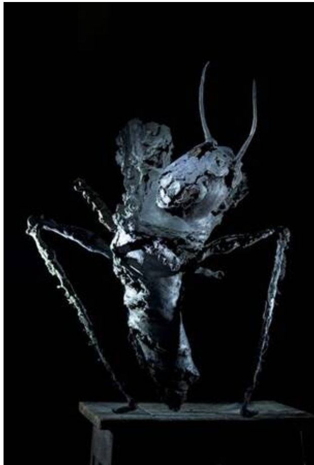
Grasshopper, 2018 brons, 100 x 80 cm.