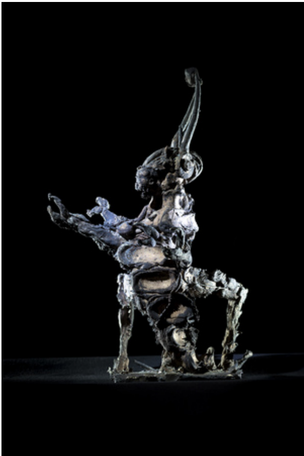
Locust, 2019 brons