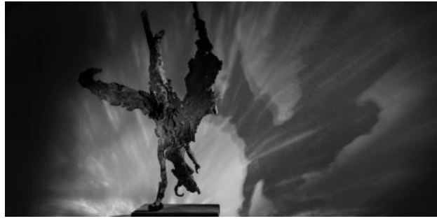
Blinded by the light, 2020 brons, 40/45 cm