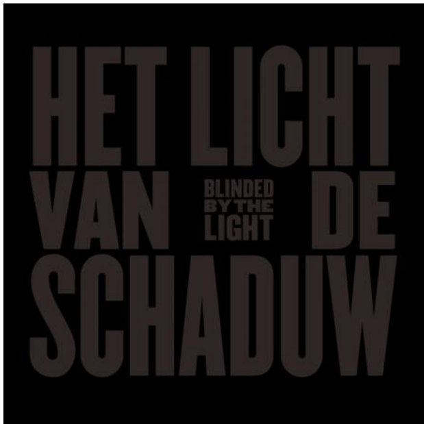
Blinded by the light (het licht van de schaduw), 2024

1994 - -- Bestuurslid Hope Foundation, Den Haag