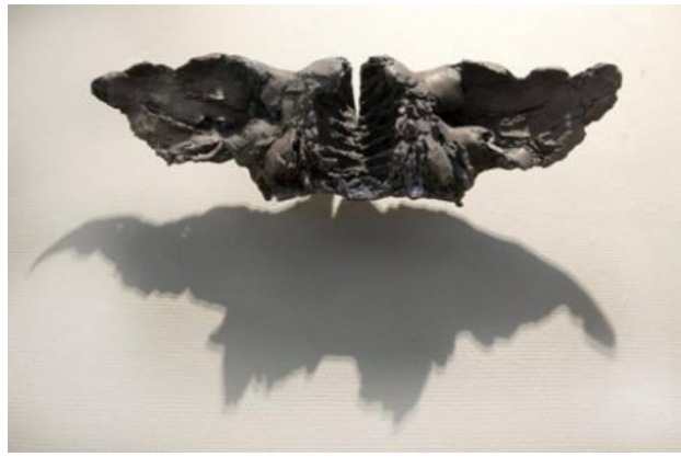
spare-rib-fabriekje, 2018 Brons, 30 x 70 x 25 cm.