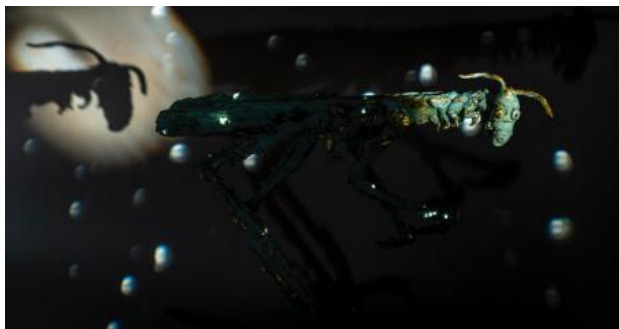
Horizontale sprinkhaan, 2023 brons en goud, 60/60 cm