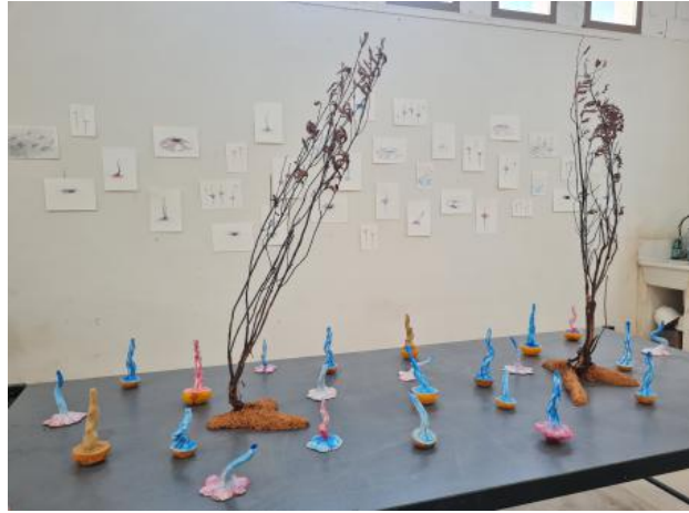
Arteventura, 2023 aquarel, klei, divers