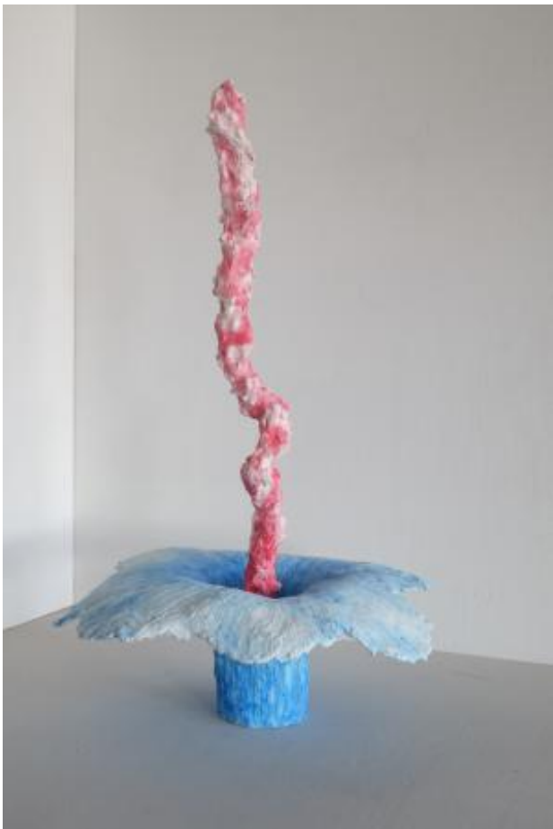
Grow 3, 2024 staal,gips,aquqrelverf,was , 30x30x50 cm