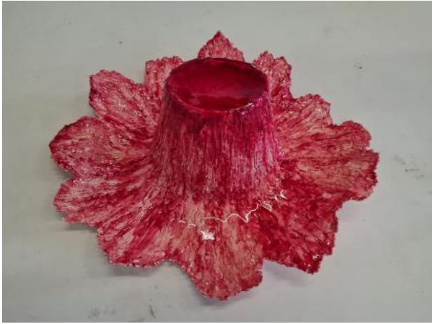
Hatscale 4, 2023 gips,aquarel,epoxyhars, 70x60x30 cm