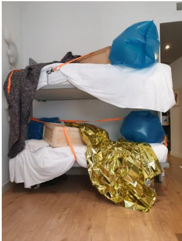
Con Alma, 2022 hout, textiel, spanbanden, plasticzakken, variabel