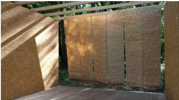
still video voor Wormhole, 2022