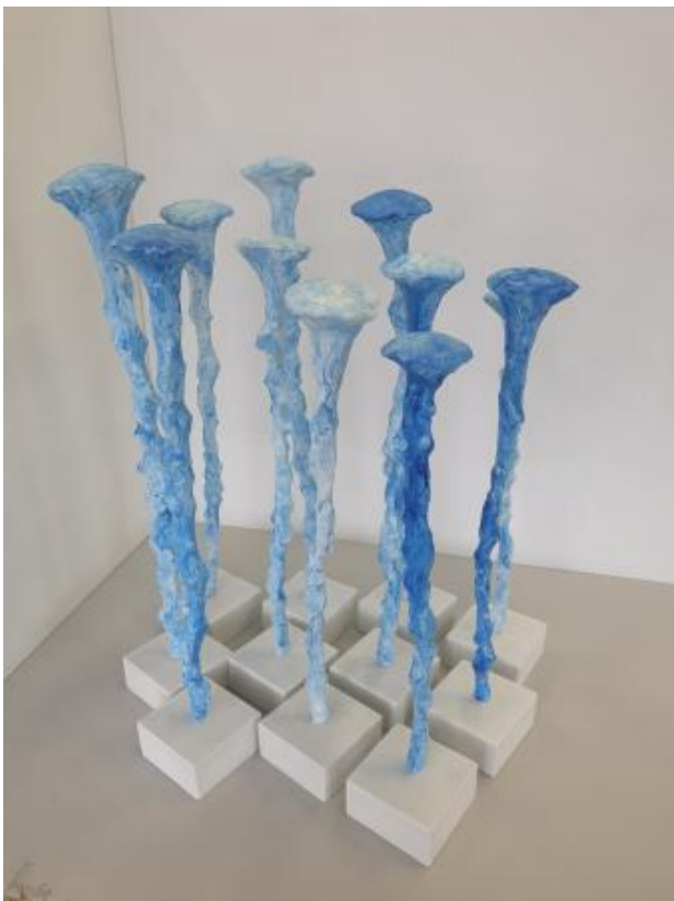
Jellyblue, 2022 gips,aquarel,epoxyhars, variabel, hoogte 40 cm