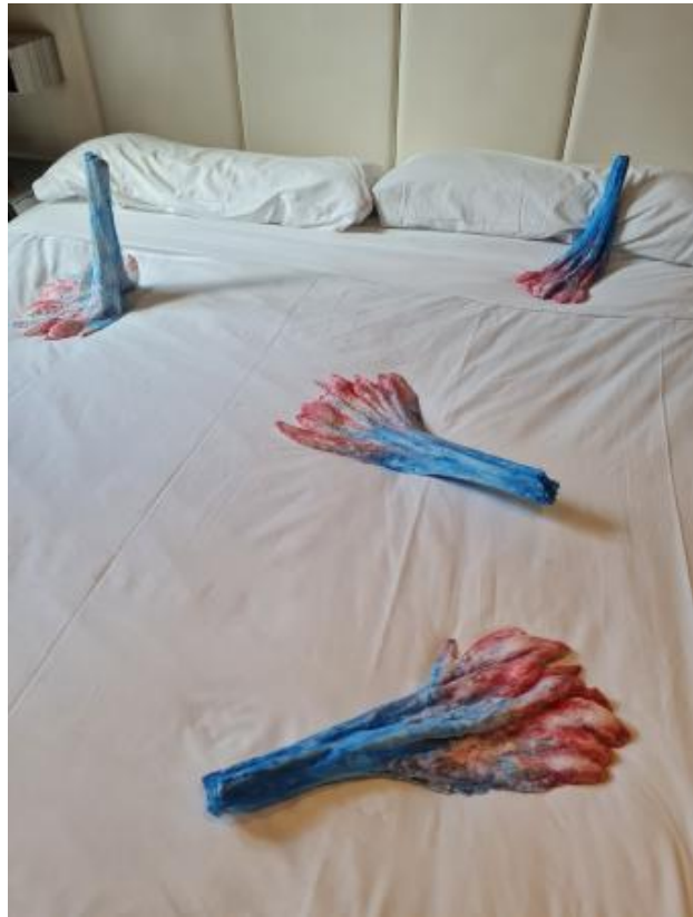
Flowerfoot, Madrid, 2024 gips,aquarelverf,was, divers