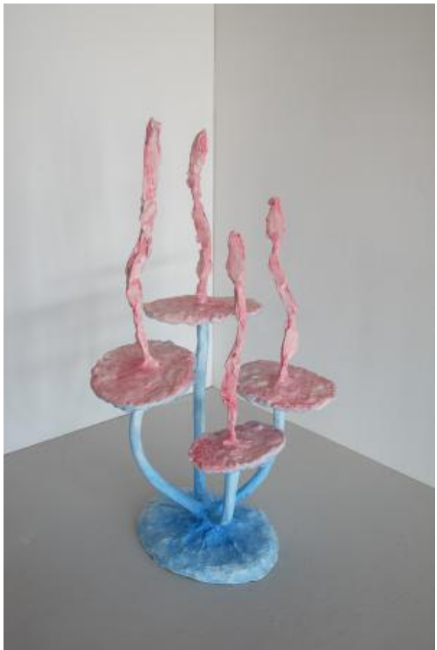
FourFive, 2024 staal, gips, aquarelverf, was, 25x25x40