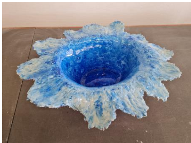
Hatscale 1, 2022 gips,aquarel,epoxyhars, 50x40x25 cm