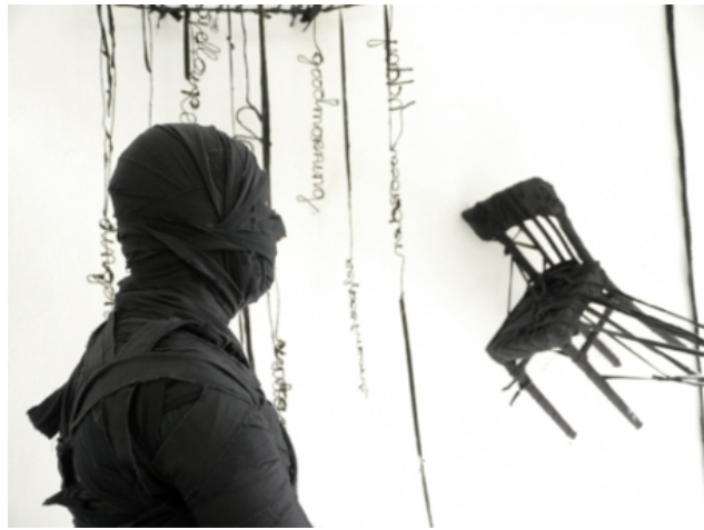
Gevallen kamers video, 2014 video, 3,5 minuten.