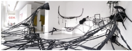
Gevallen kamers #2, 2014 diverse ruimtelijk, 6mx8m