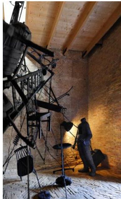
Er brandt licht in de toren, 2022 computertekeningen/print, n.v.t.