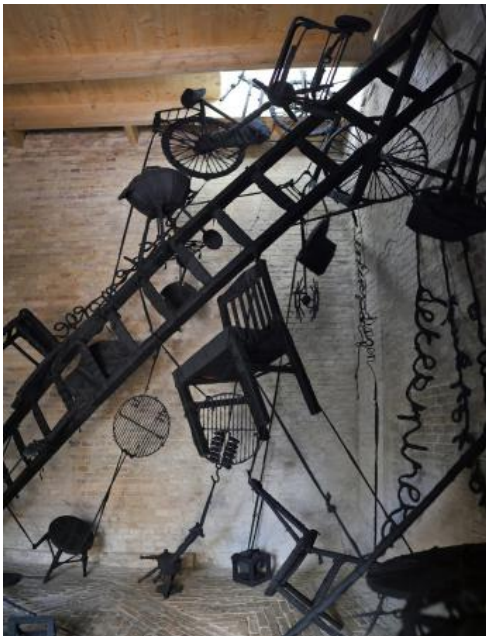
Gevallen Kamers 3, 2022 objecten omwikkeld met stof, gehangen, aan elkaar geknoopt, speciale inrichting., Torenruimte 4m x4m x 4m