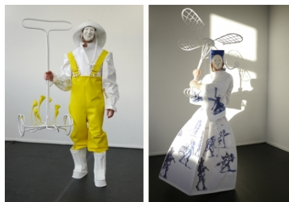
7 verschijningen, 2017 performance, 75 min.