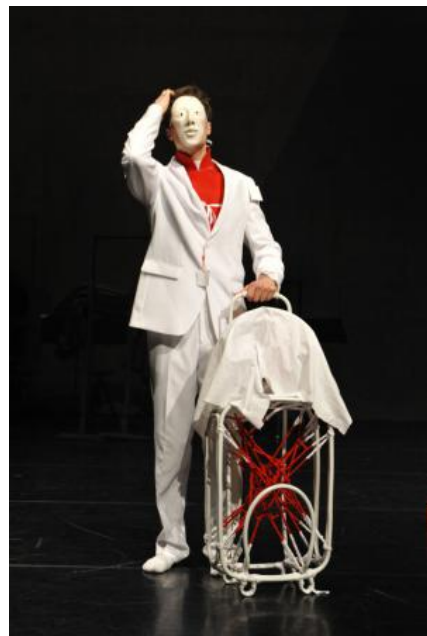
De Optocht, 2018 verschilende technieken beeld en beweging