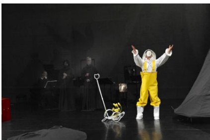
De optocht, 2018