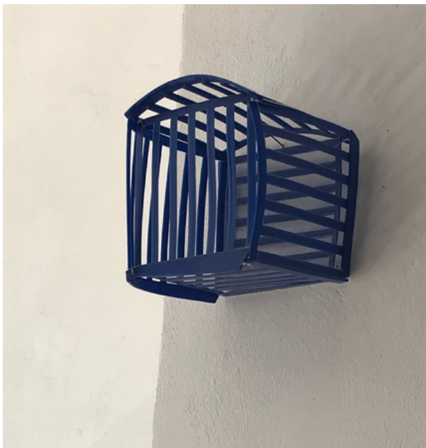
z.t., 2014 assemblage, 12 x 12 x 12 cm