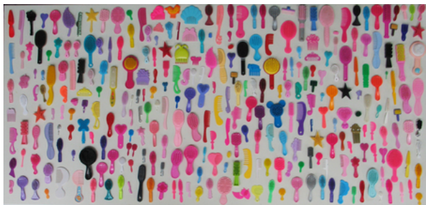
kammetjes, 2014 verzameling, 70 x 140 cm