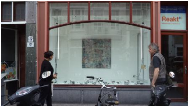
Malrador Galerie, 2021 Mix media, 21x21

2011 - Vitrine van Vertoon (HKK) concept 2013 bedacht en proces begeleid in 2011 en 2012