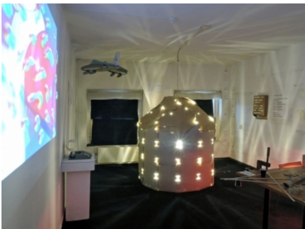
idem, later in de bovenkamers, HKK, 2015 idem, idem