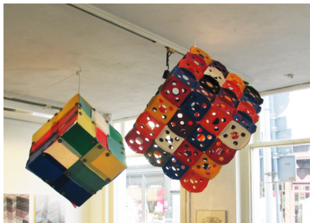
kubus, 2015 assemblage, 32 cm 3