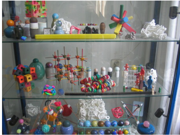
HOME, 2019 n v t , 70 x 90 x 40 cm