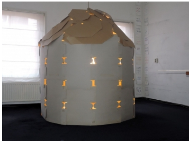
lamp, 2015 assemblage, h 180 cm