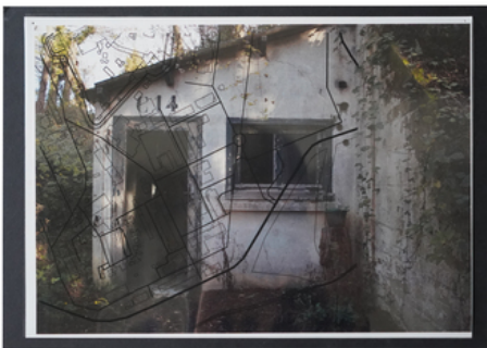
Testing Site, 2019 gemengde techniek, 30 x 20cm