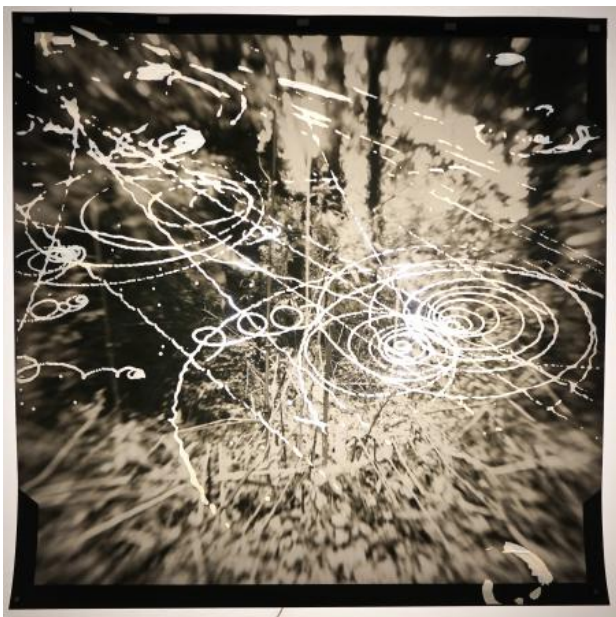
Exposed landscape, 2023 foto op papier met toegevoegde cloudchamber middels lasercutter, neon licht, 80x80 cm