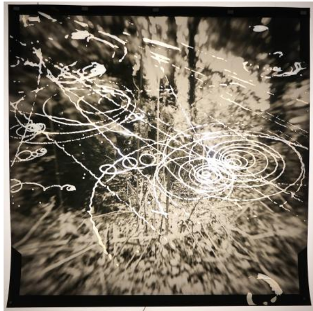
Exposed landscape, 2023 foto op papier met toegevoegde cloudchamber middels lasercutter, neon licht, 80x80 cm