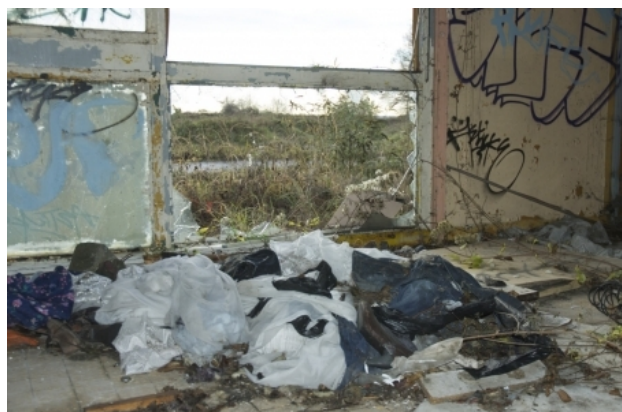
Vaujourn, 2015 photographie, 45x30cm