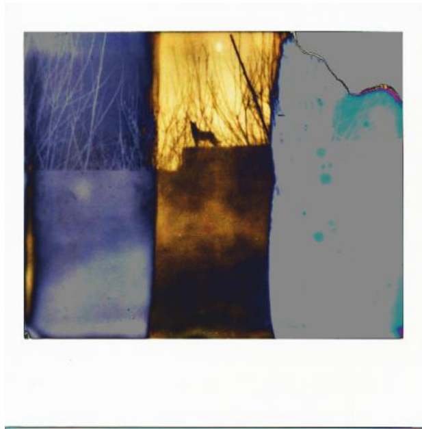
z.t., 2024 print, 40x40 cm