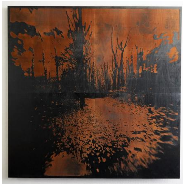
Unsettling landscape, 2022 fotografie en lasercutter, 150x150 cm