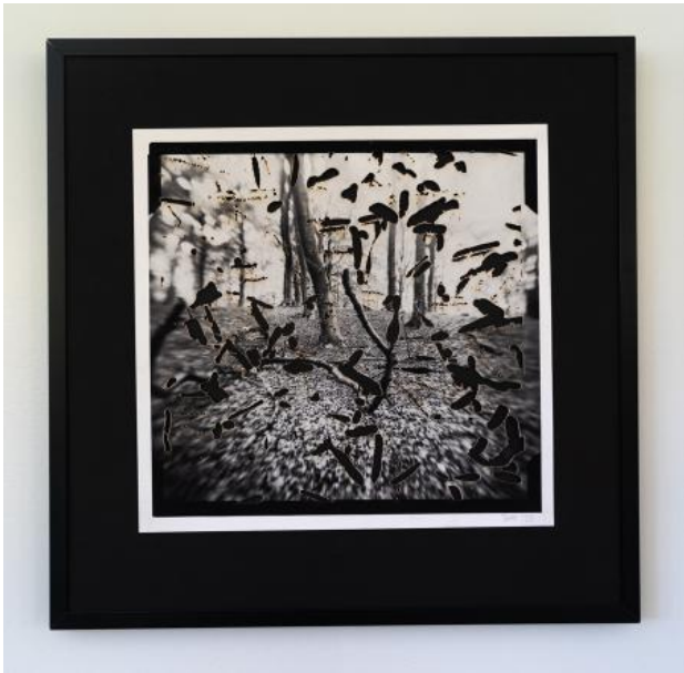
cloudchamber#3, 2023 foto op barietpapier, bewerkt met lasercutter, 30x30 cm