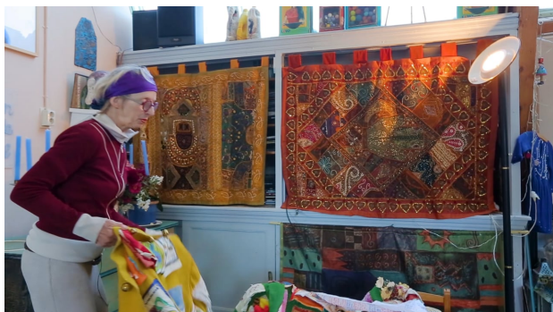
video Klei(n)schaligheid door Tasfilms, 2020 0