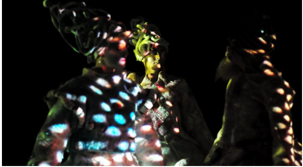
Tribe of Senses, 2016