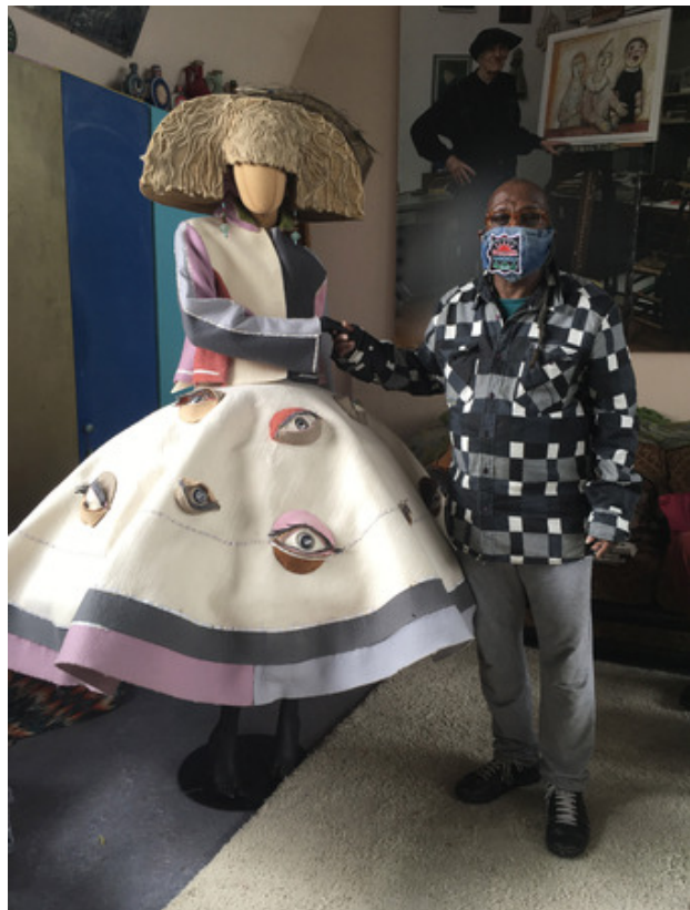
S D dress Eye on you, 2018 gemengde techniek op vilt met smoorkap, 3 m omvang