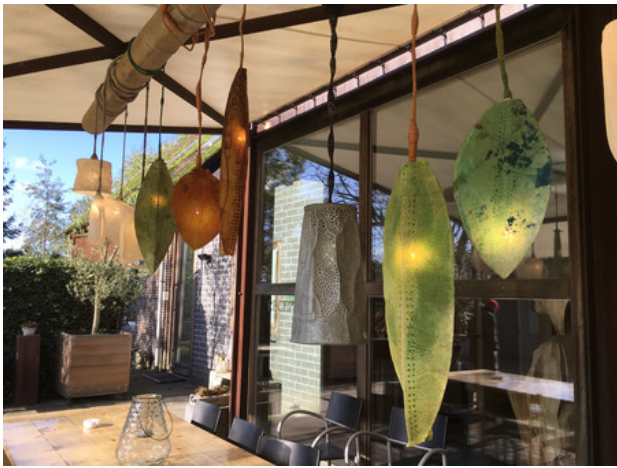
Droomluchter , 2019 gegympte snoeren en geperforeerde vormen met ledverlichting, L 10 m