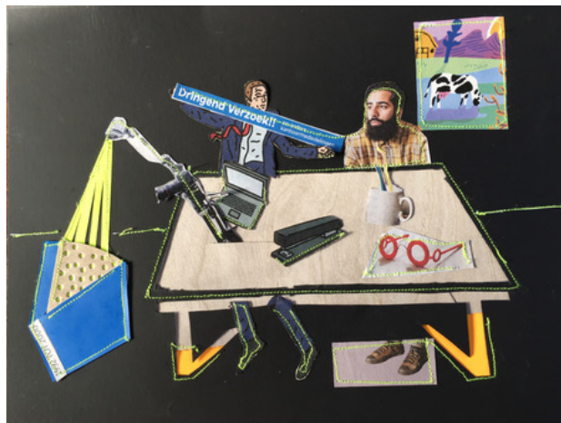
Licht op de zaak, 2020 gemengde techniek op papier, A3