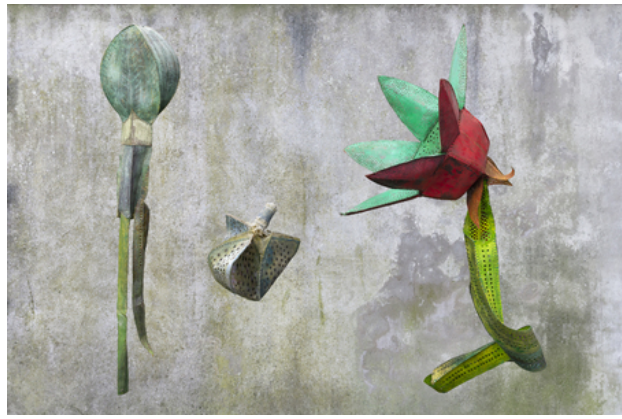
BLOEMEN, 2019 Aan elkaar genaaid vormen in lompenpapier met was, diverse formaten tot 1 m L