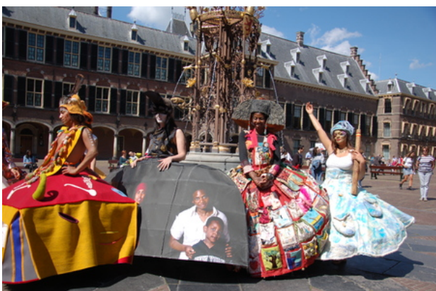
GUN FOR PEACE, 2017 recycled perforated plastic bottle in or, L 400cm