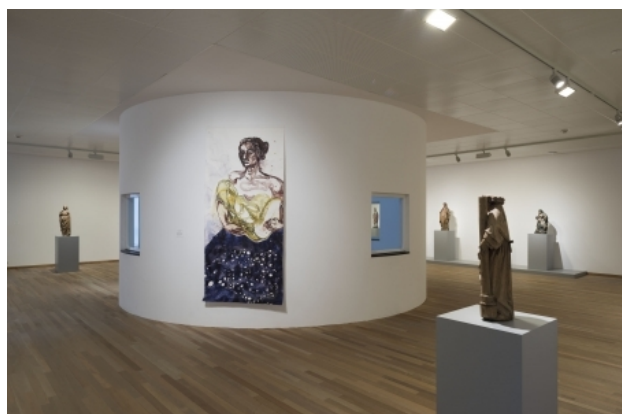
Bonnefantenmuseum, 2015 aquarel/potlood/papier