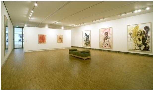
De Ideale Moslimvrouw, 2006