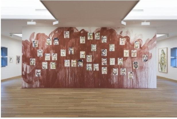
Quarantaine, 2014 pigment/aquarel/papier