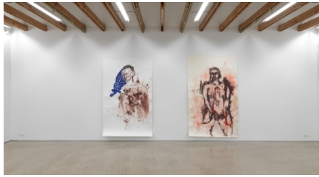
Je suis toi-tu es moi, 2017 aquarel op papier, 255 x 152