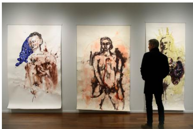
RAUW , 2022