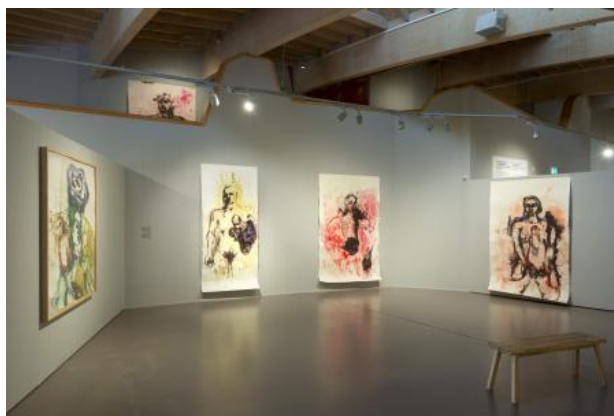
The wound is the place where the light enters you, 2021