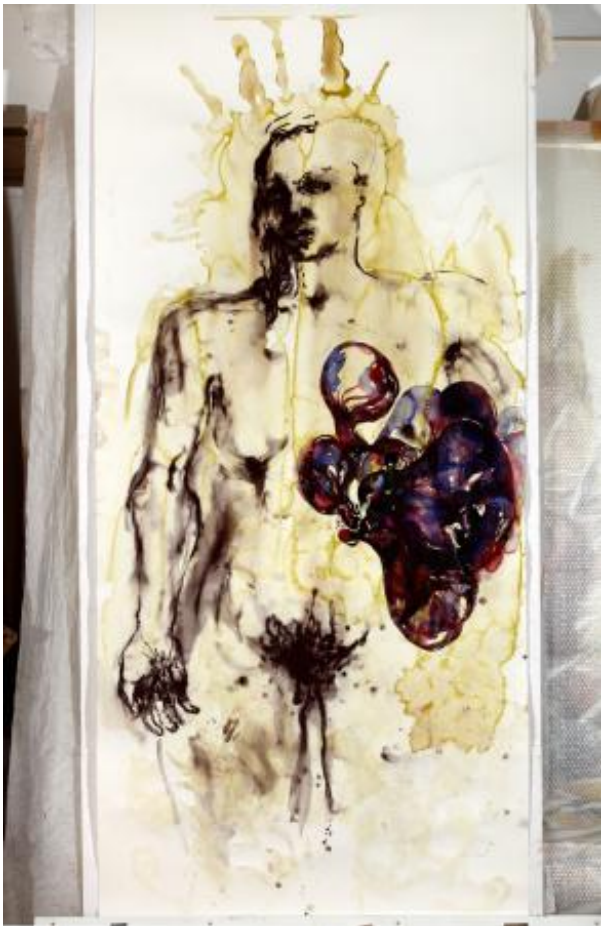
, 2020 watercolour on paper, 245 x 114 cm