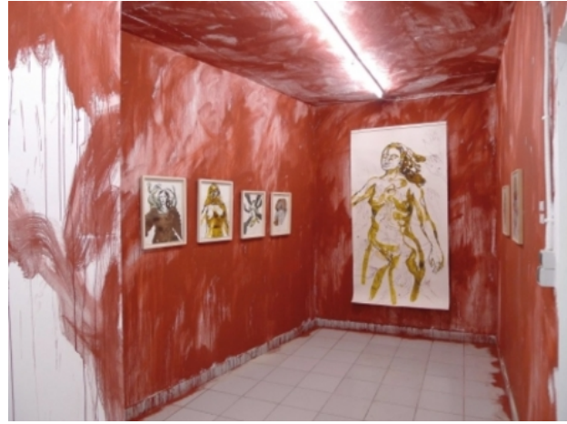
, 2010 pigment / aquarellen