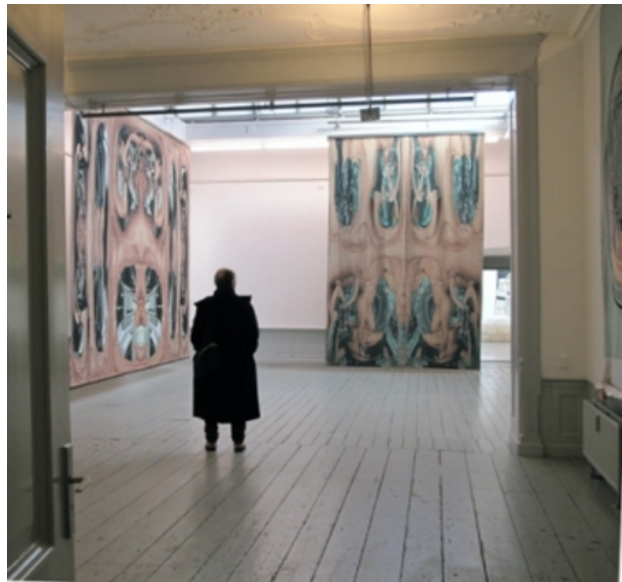
installatie in Pictura, Dordrecht, 2011 digitale tapisserie