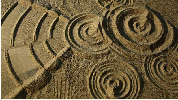
Documentary Steen in water-HD, 2019