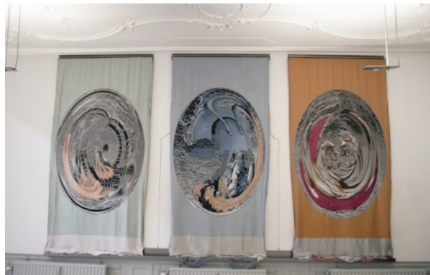
'huiselijke bezigheden', 2010 digitale tapisserie, 550 x340 cm