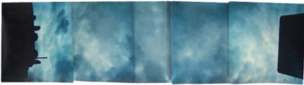
Sky between Rue Benoit and Rue de Renne, 1978 Foto collage, 50x20 cm