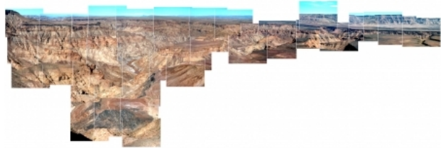
Fish River Canyon, 2005 digital images, 500x160 cm