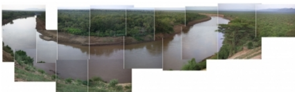
Bend in the Omo River, 2006 digital images, 200x80 cm