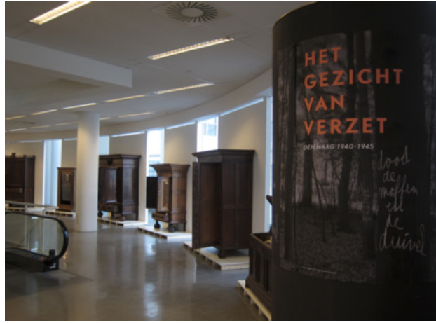
Het gezicht van verzet, 2018 Installatie