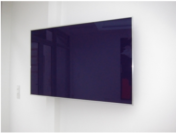
As straight as a die, 2013 hout, alcydverf, glas, messing, aluminium, 87 x 117 x 30 cm