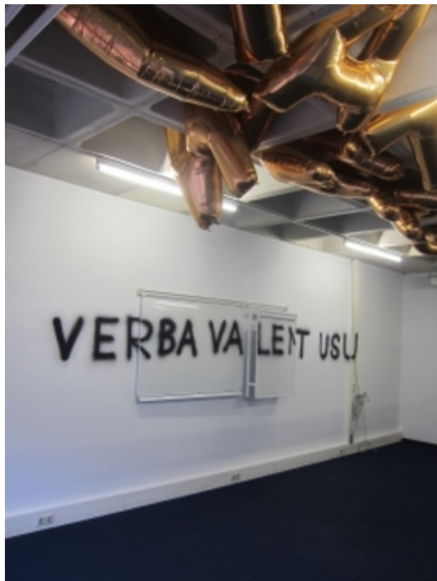
VERBA VALENT USU (I&II), 2016 ballonnen, helium, spray paint, site specific