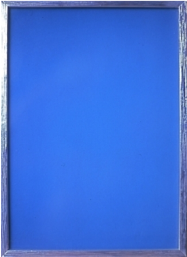
Idiosyncratic, 2019 kleurenfoto, verzilverde lijst, 18,2 x 13,2 cm