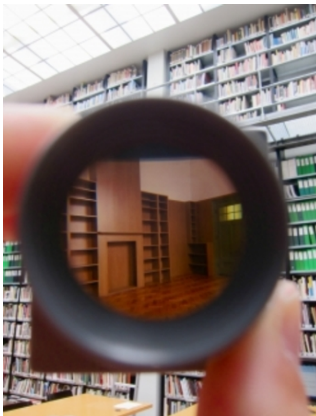
Reader's digest, 2013 dia, dia viewer, 55 x 55 x 60 mm