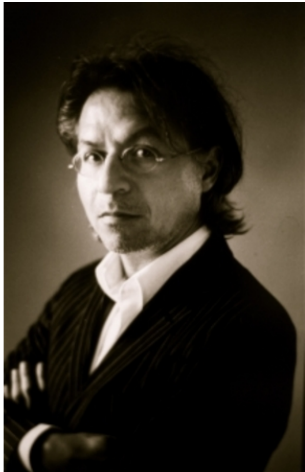
PIM VOORNEMAN, 2010 barietafdruk in eiken gefineerde lijst, 42 x 32 cm