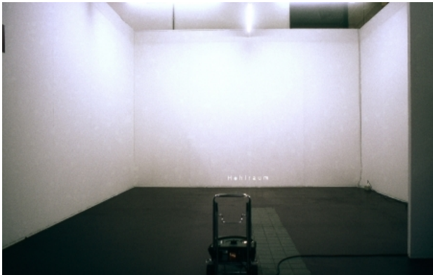
Hohlraum, 2006 diaprojectie