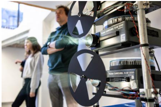
Grantangi Plant Medicine, 2024 Film installation