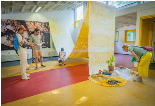
The Holy Color of Turmeric, the sunlit spice, 2024 Kurkuma sunlight anthotype prints on paper and textile