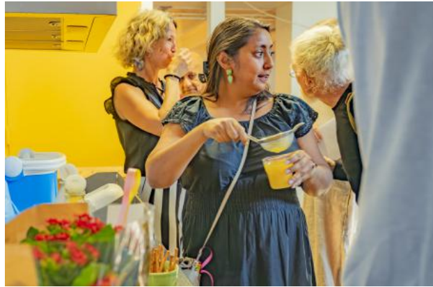
The Holy Color of Turmeric, the sunlit spice, 2024 fresh apple, turmeric, ginger, and lemon juice