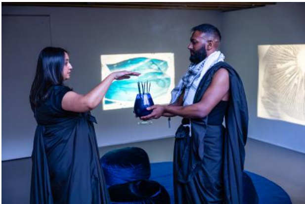
Welcome/Opening ritual Grantangi Plant Medicine, 2024 Ritual with selfmade incense