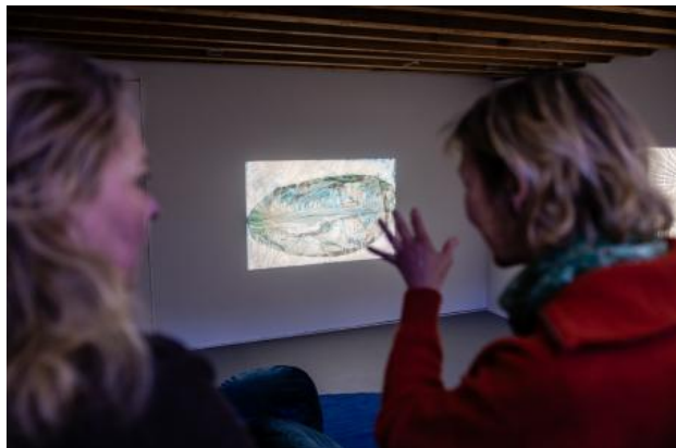
Grantangi Plant Medicine, 2024