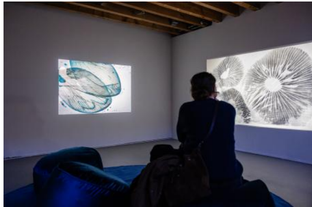
Grantangi Plant Medicine, 2024 Film installation