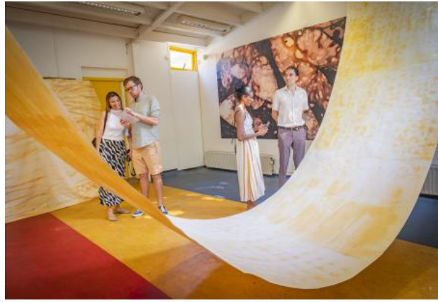
The Holy Color of Turmeric, the sunlit spice, 2024 Kurkuma sunlight anthotype prints on paper and textile