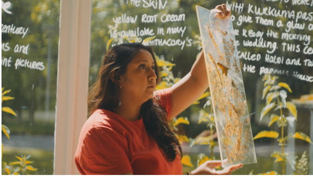
2011, 2024 4