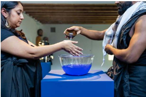
Welcome/Opening ritual Grantangi Plant Medicine, 2024 Ritual with selfmade incense