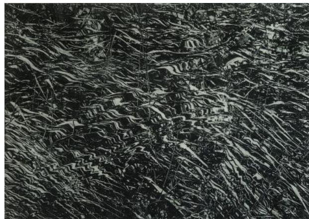
Waterkant, 2020 polymeerets, 38 x 55 cm