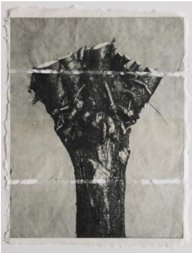
Wilg, 2019 polymeerets op kozopapier, 30 x 38 cm