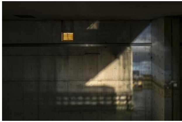
Inside, 2019 fotografie