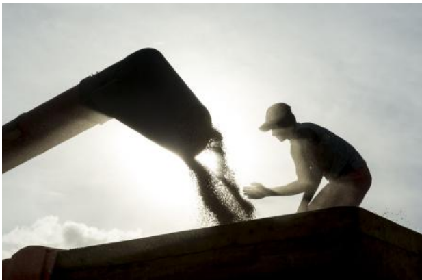
Soy, 2018 fotografie