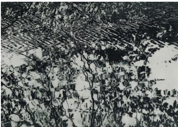
Waterkant, 2020 polymeerets, 38 x 55 cm