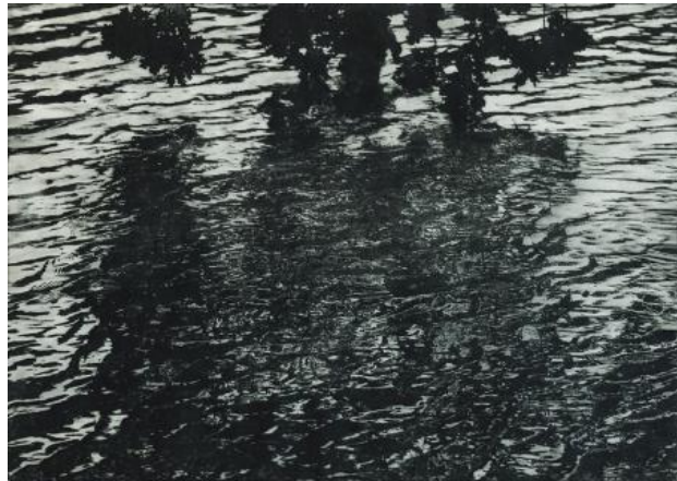
Waterkant, 2020 polymeerets, 38 x 55 cm