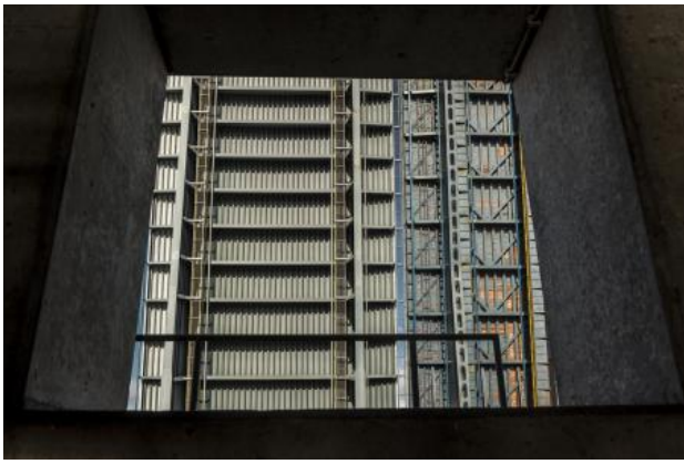
Inside, 2019 fotografie