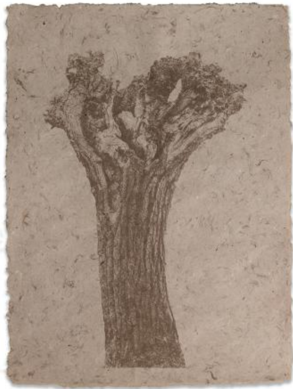
Wilg, 2019 zeefdruk met wilgpigment op wilgpapier, 70 x 100 cm