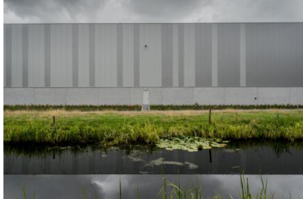
Ergens in Nederland, 2020 fotografie