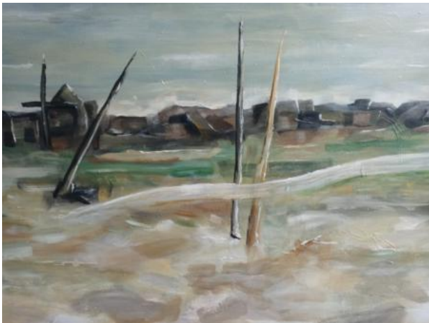
The choir, 2020 acryl, 100x150