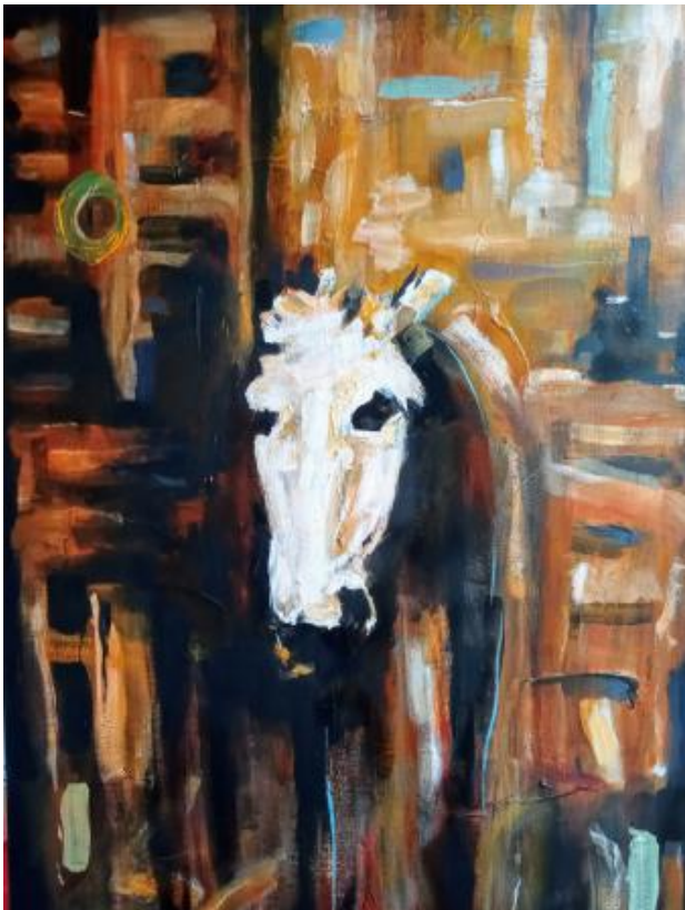
Paard van Troje, 2020 acryl, 100x150