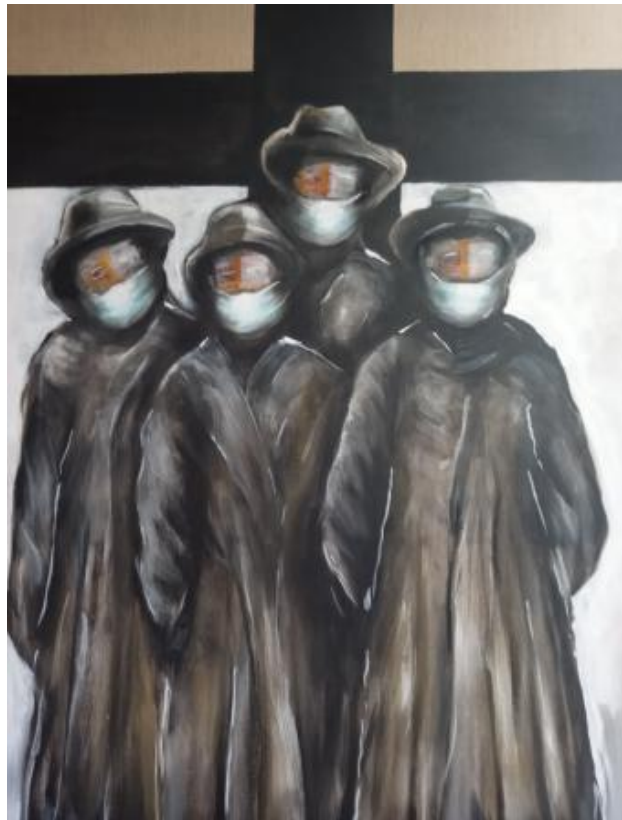
The Watch, 2020 acryl, 100x150