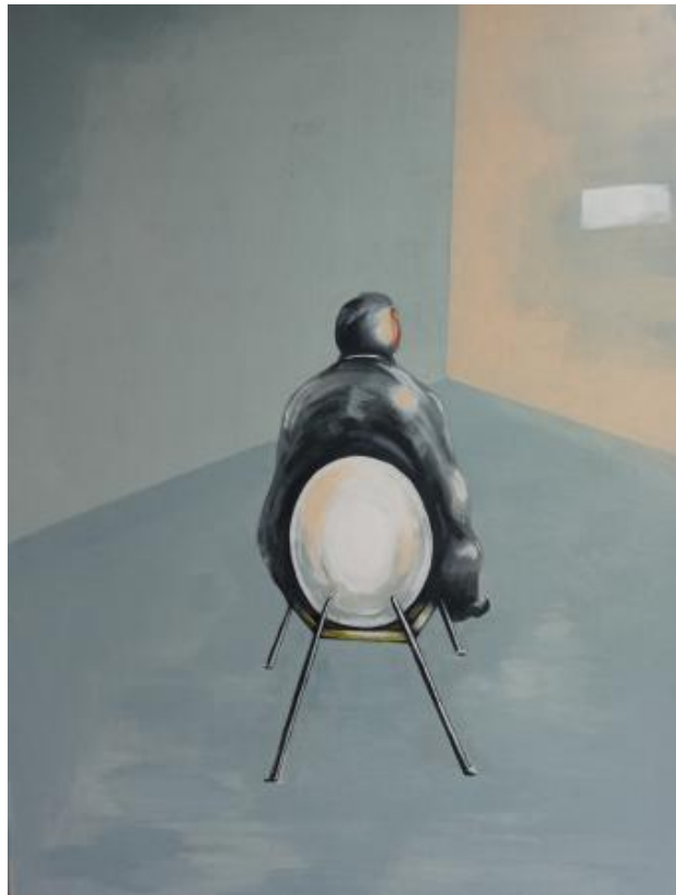
Isolation, 2020 acryl, 100x150