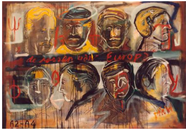
Rassen van Europa, 2020 acryl, 150x200