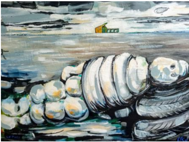
Le Pneu, 2020 acryl, 100x150