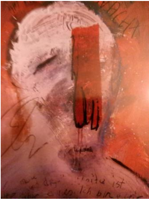
Glove, 2020 acryl, 100x150