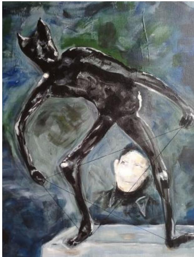
Beeld aan zee, 2020 acryl, 150x100