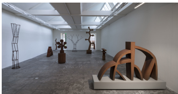
zt, 2020 staal