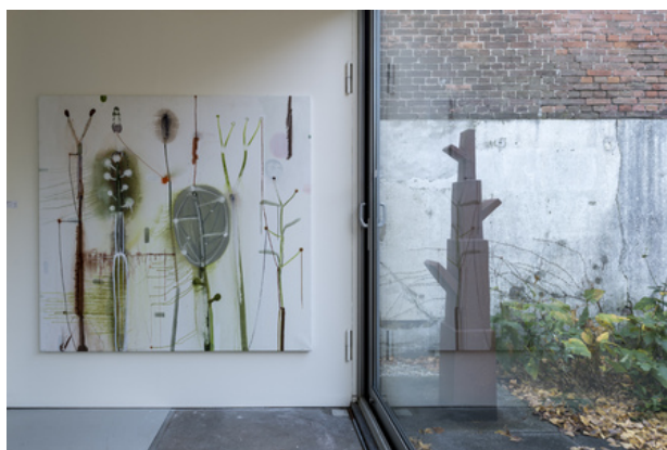
zt, 2020 acryl op doek, 150x140 cm