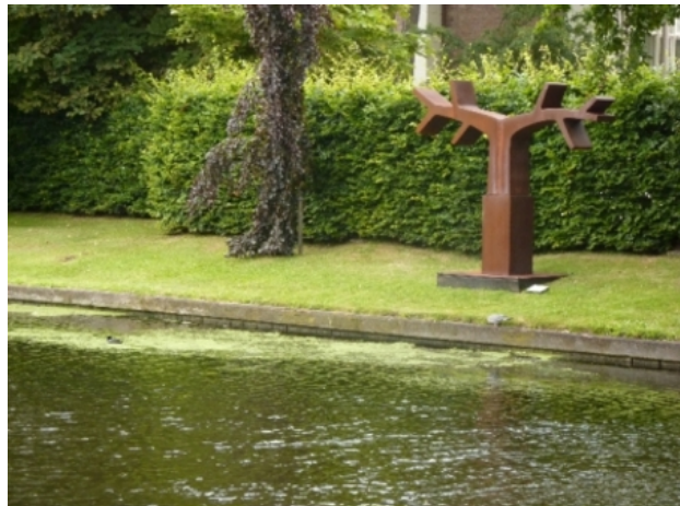
Himalayan Spring, 2009 cortenstaal, 242 x 294 x 50 cm