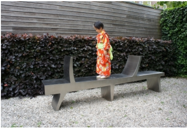
horizontaal III, 2013 rvs, 87 x 270 x 40 cm