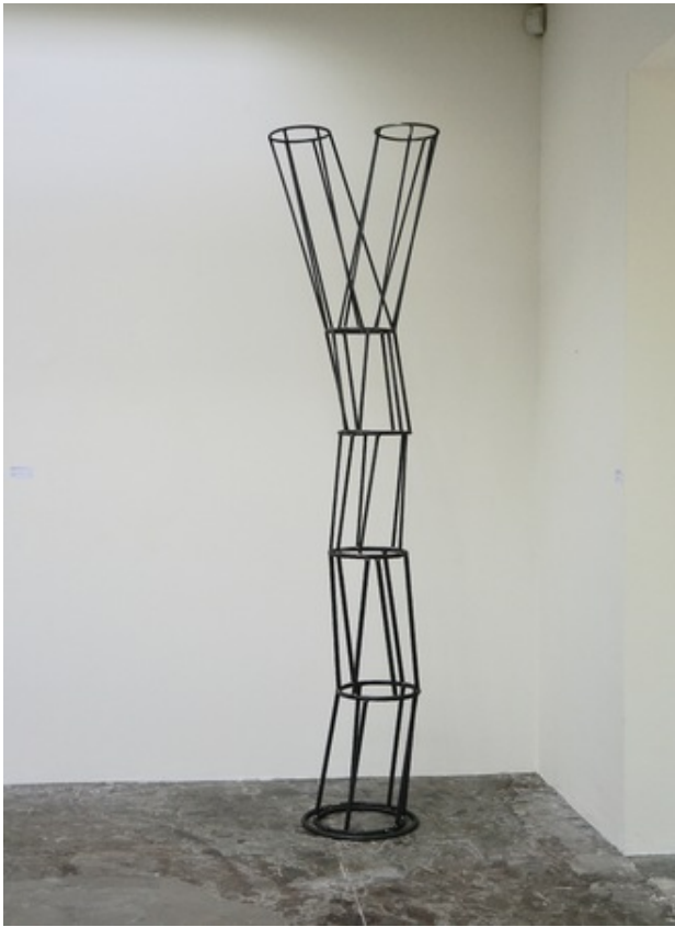
van een naar vier, 2019 staal gelast, 41x60x242