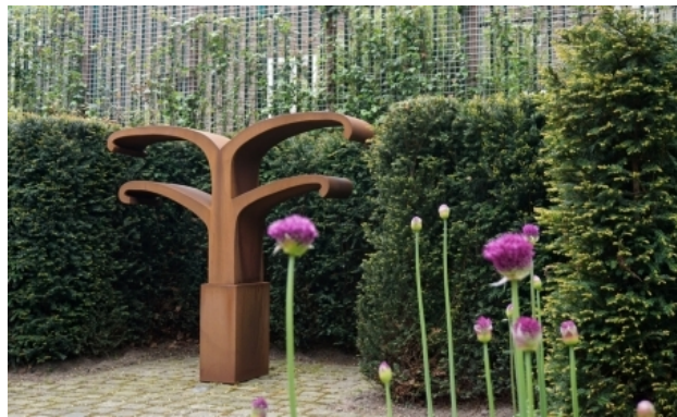
Shelter, 2016 cortenstaal, 180 x 191 x 40