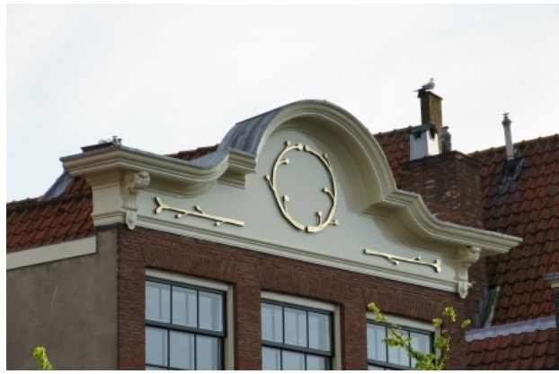
zonder titel, 2013 brons bladverguld, 550 x 90 x 5 cm