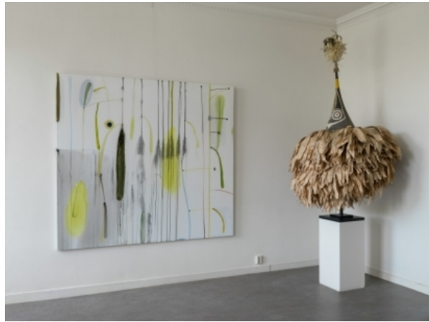
Hangende tuinen, 2017 acryl op doek, 180 x 200