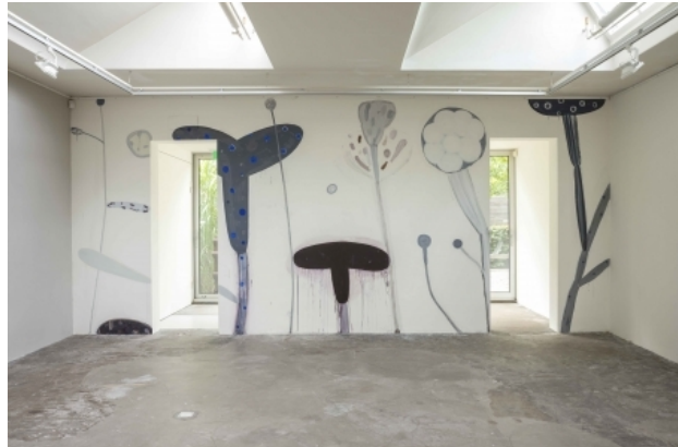
zonder titel, 2014 acrylverf op wand, 330 x 750 cm