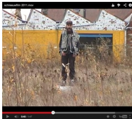
Screamingplaces (Gent), 2012 video and map