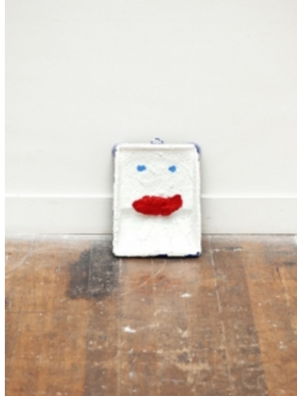
paint tray with clay, 2011 tray, acryl, clay, 20x30 cm