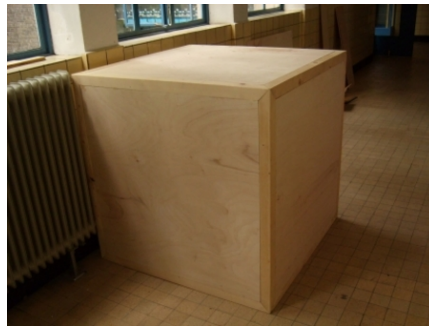
Kubus, 2011 wood and text, 1.50x1.50x1.50 mtr