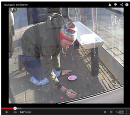
painting chewing gum, 2010 video/performance