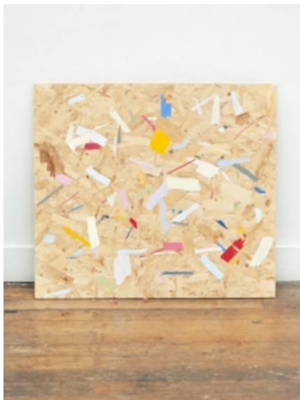
chip wood with colour, 2012 chip wood, acryl, 77x69 cm