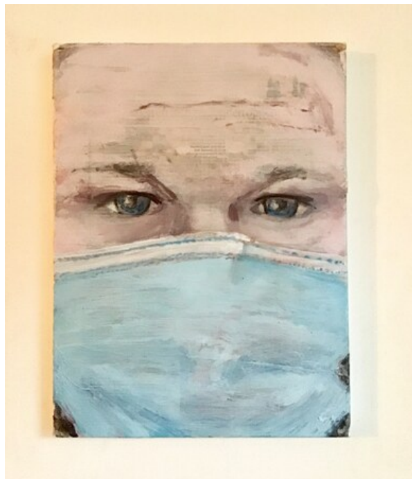
, 2020 Gemengde techniek op doek, 40 x 30 cm