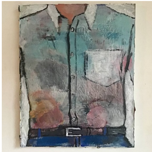
, 2020 Gemengde techniek op doek, 50 x 40 cm