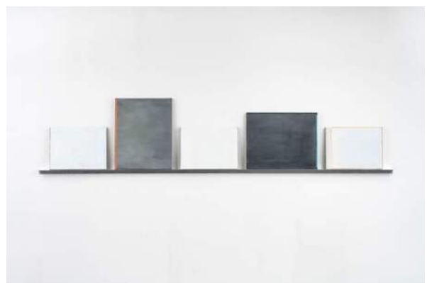
Made in Vietnam, 2019 installatie, olieverf op doek, 50 x 250 x 5 cm