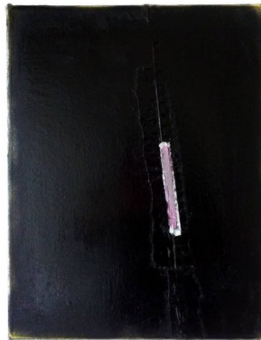
, 2020 Gemengde techniek op doek, 45 x 35 cm