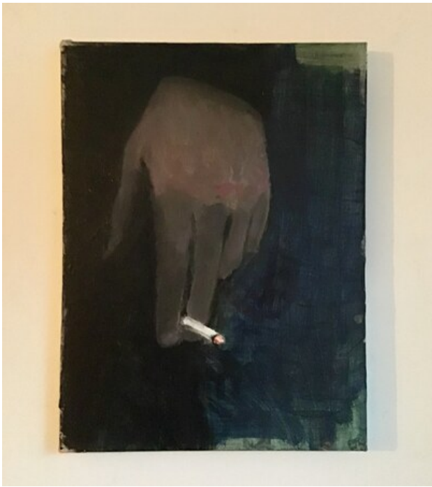
, 2020 Gemengde techniek op doek, 40 x 30 cm