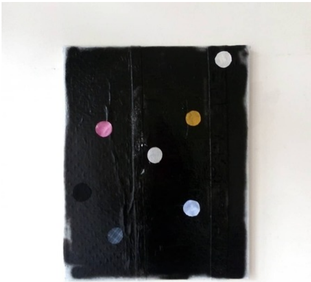
, 2020 Gemengde techniek op doek, 50 x 40 cm