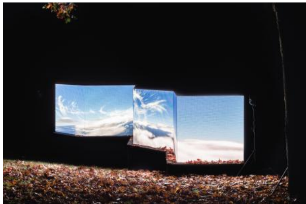
Airborne Landscapes, 2022