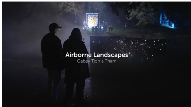
Airborne Landscapes, 2022 02:14