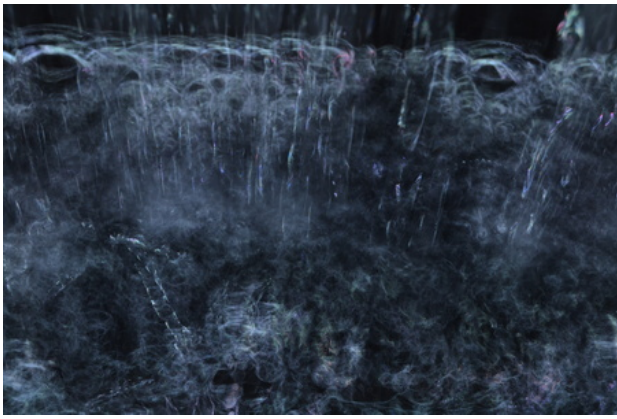
Loss of Unity , 2020