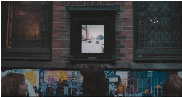
Vec4(red,green,blue,alpha), 2024 02.56