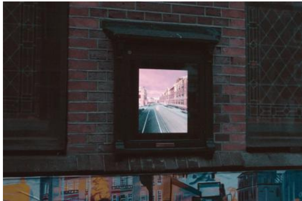
Vec4(red,green,blue,alpha), 2024 Generatieve virtuele 3D omgeving op scherm, 41 x 33 x 4 cm