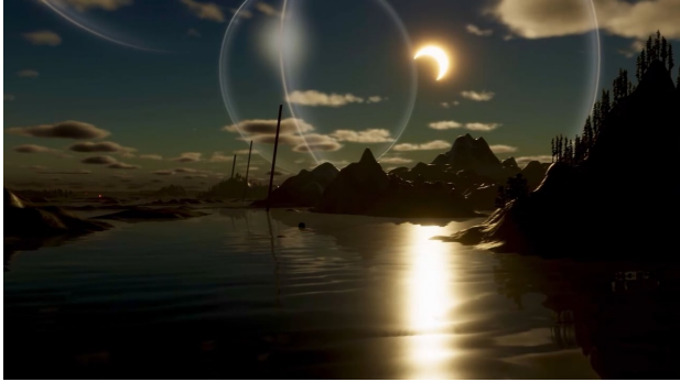
Flowing Grounds | Stockholm, 2022 01:48