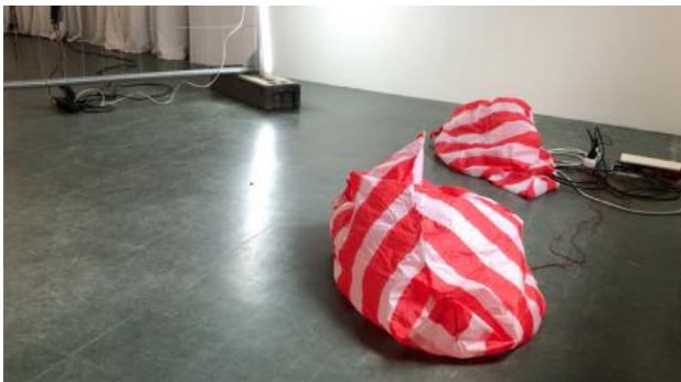
Symbiotic Spaces | Stockholm, 2021