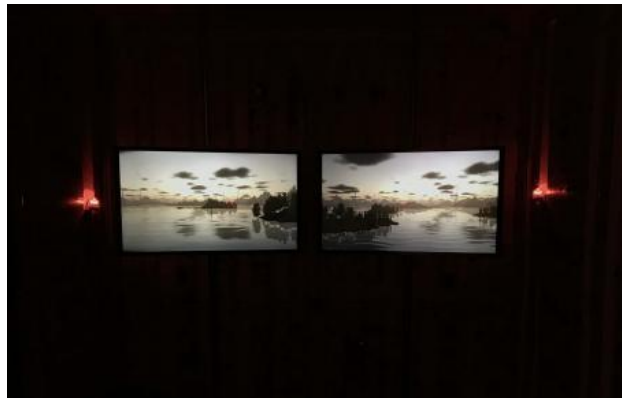
Flowing Grounds | Stockholm, 2022 Installation - 2 channel video, multichannel audio, tactile transducers, signal lights