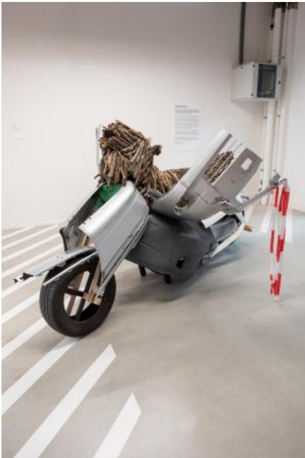
no title, 2021 3d autonoom, 350x100x180