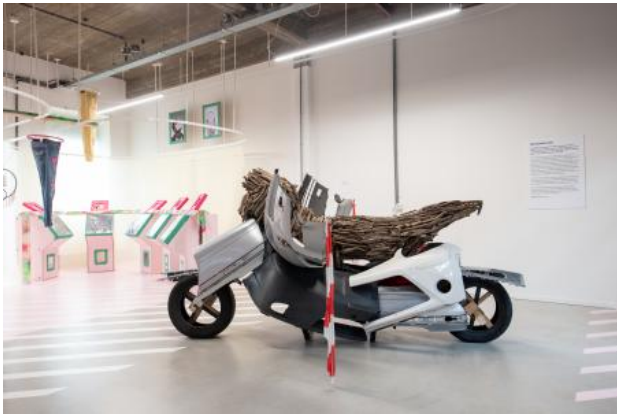
no title, 2021 3d autonoom, 350x100x180