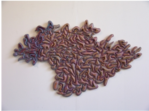
transposition of the direct, 2017 beeldhouwer, 122x122