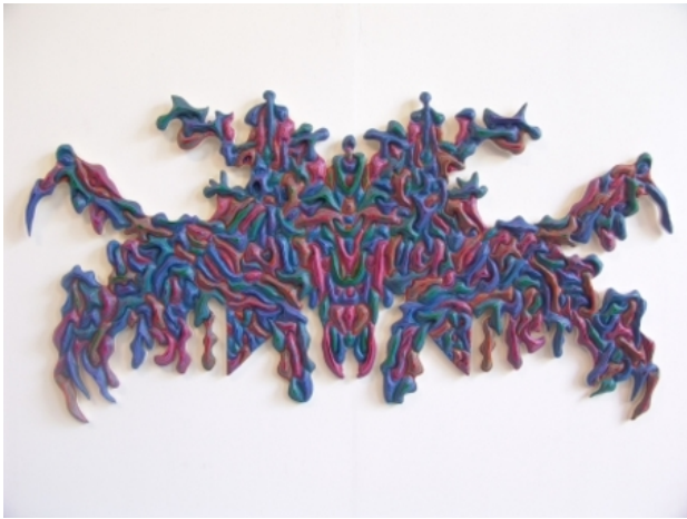
modern complex, 2017 beeldhouwer, 122x122