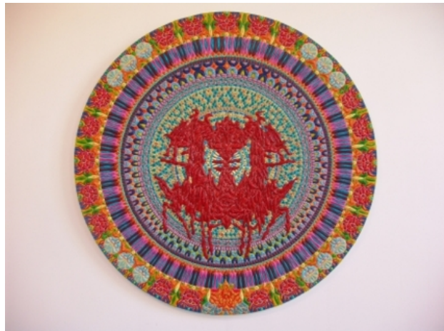
freedom of plastic association, 2017 beeldhouwer, 122x122