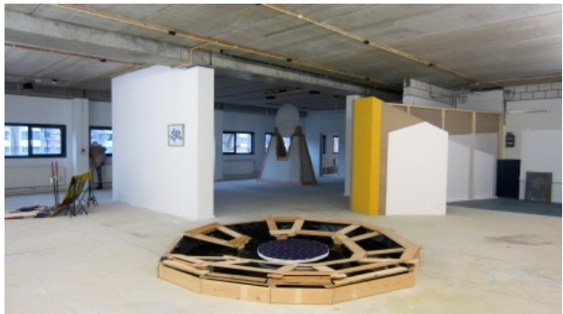
Installation view Blue Billytown, 2015 Mixed media