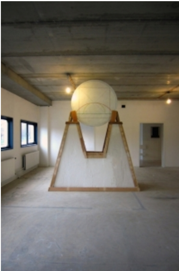
Monument IV : Sun set, Sun rise, 2015 Mixed media, 420