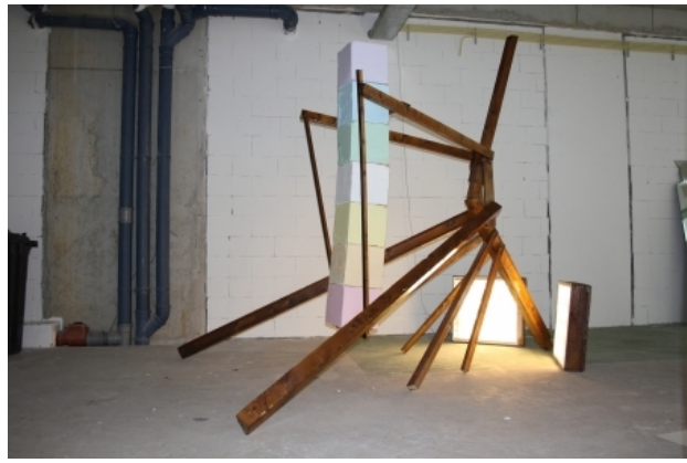
The beauty of whirling squares, 2015 Mixed Media., 300