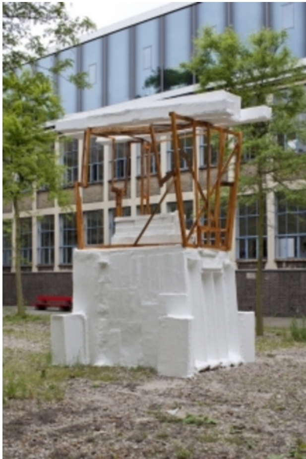
Monument I, 2013 Mixed Media