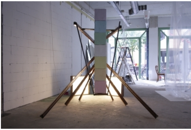
The beauty of whirling squares, 2015 Mixed Media