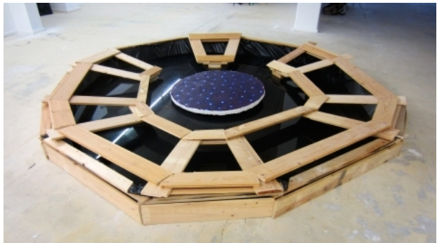
Mirrored sky_1, 2015 Mixed media, 300