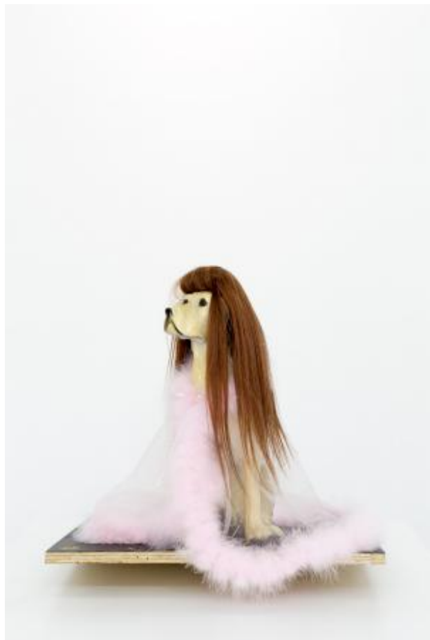
Suzie, formerly known as Guus, 2019 keramiek, mensenhaar, veren en tule, 50 x 50 x 50 cm