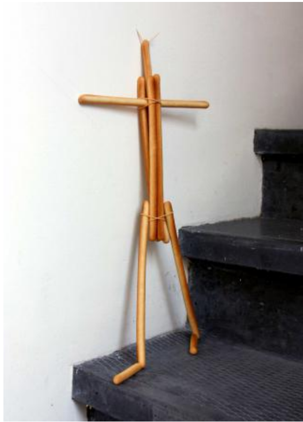
Oh Henry!, 2021 soepstengels en rubber elastiekjes, 3 x 30 x 40 cm