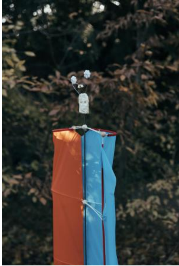
Vogelverschrikker, 2021 textiel, metaal, klei, hout, 40 x 70 x 140 cm