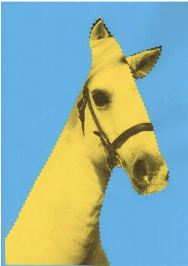
Paard, 2021 collage, 29,7 x 21 cm