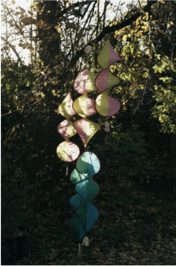
Vogelverschrikkers, 2021 textiel, metaal, klei, 40 x 80 x 200 cm

2016 - Instructeur Fabric Station, Willem de 2019 Koning Academie Loopt nog