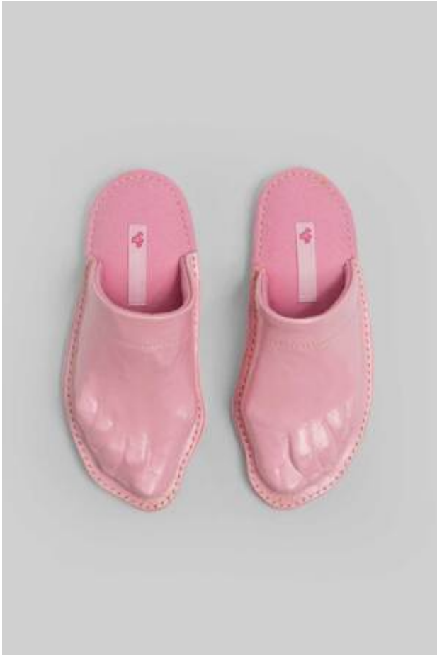
Ze doen me denken aan mijn vader, 2018 leer en vilt, 30 x 15 x 8 cm