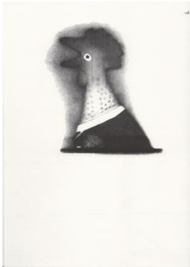
Chicken Referee Sinks in Hole, 2021 riso print, 29,7 x 21 cm