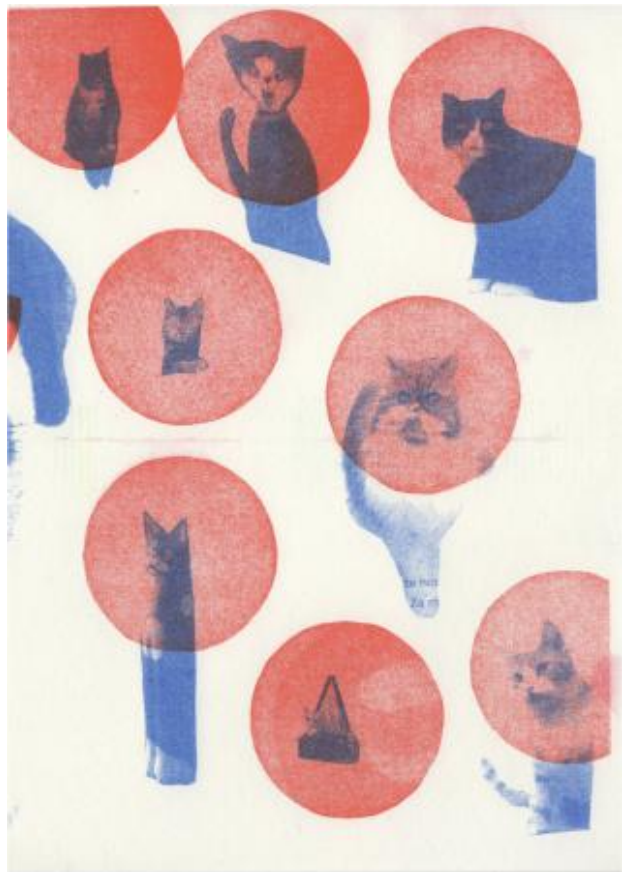
Cats that have appeared in magazines, 2021 riso print, 14,8 x 21 cm