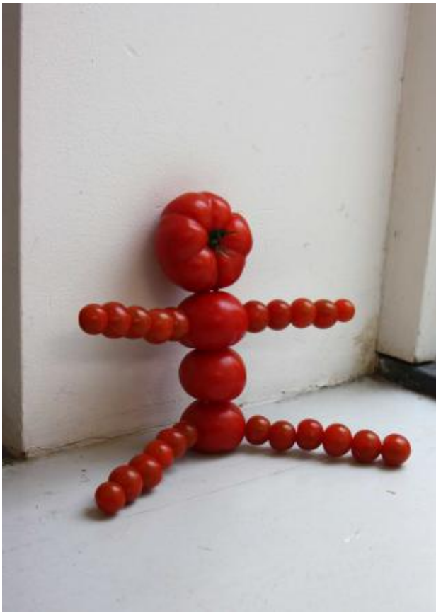
Oh Henry!, 2021 verschillende tomaten en sateprikkers, 40x40x30 cm