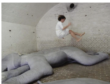
Come to me when thou hast seen the elephants dance, 2018 Katoen, Pigment, Schuim, Drie maal 340x240x60cm