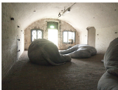
Come to me when thou hast seen the elephants dance, 2018 Katoen, Pigment, Schuim, Drie maal 340x240x60cm