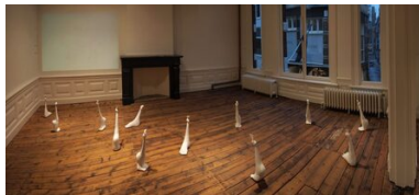
Van de weeromstuit gelukkig zijn, 2015 Katoen, Gips, Twaalf maal circa 30x15x50