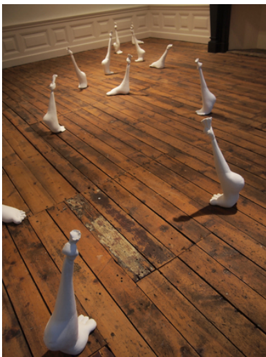
Van de weeromstuit gelukkig zijn, 2015 Katoen, Gips, Twaalf maal circa 30x15x50