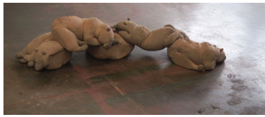
Daer hi vant den meesten stroom, 2016 Beton, Pigment, 160x50x45