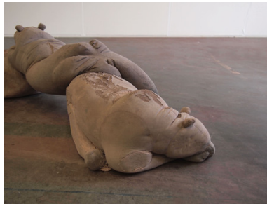
Daer hi vant den meesten stroom (detail), 2016 Beton, Pigment, 160x50x45