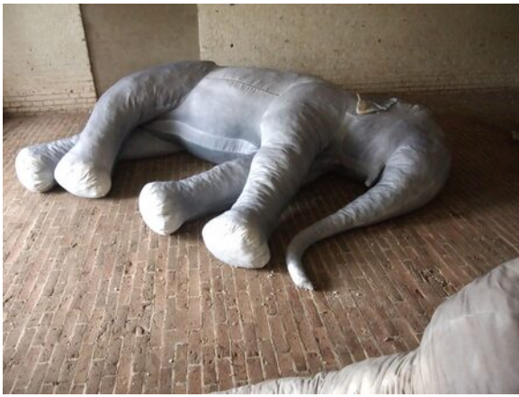
Come to me when thou hast seen the elephants dance, 2018 Katoen, Pigment, Schuim, Drie maal 340x240x60cm