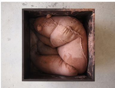
Des Coninx Bode, 2016 Beton, Pigment, Hout, Lak, 45X45X35