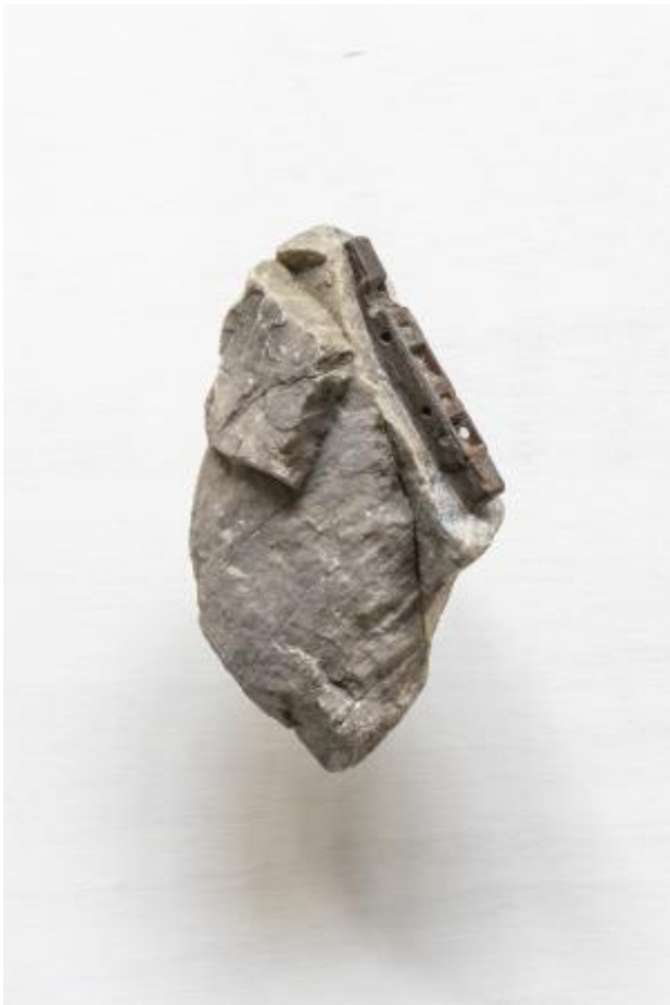
Ci 26 (Civilite), 2024 Sculptuur, 20cm x 12cm x 15cm