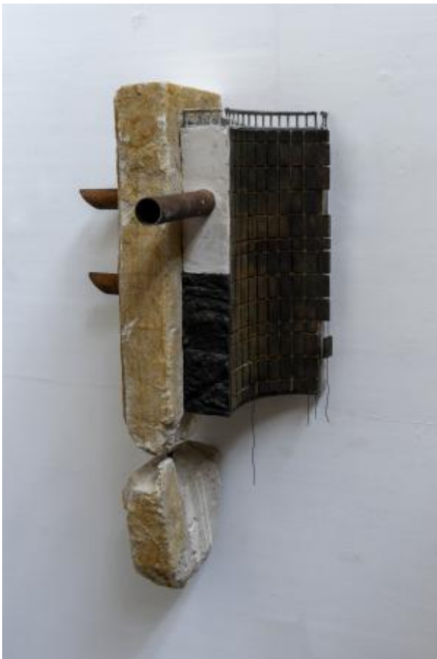
Memorism 4, 2024 Sculptuur, 100cm x 46cm x 39cm

2015 - Kunsteducatief programma Stroom 2016 Den Haag / Madurodam