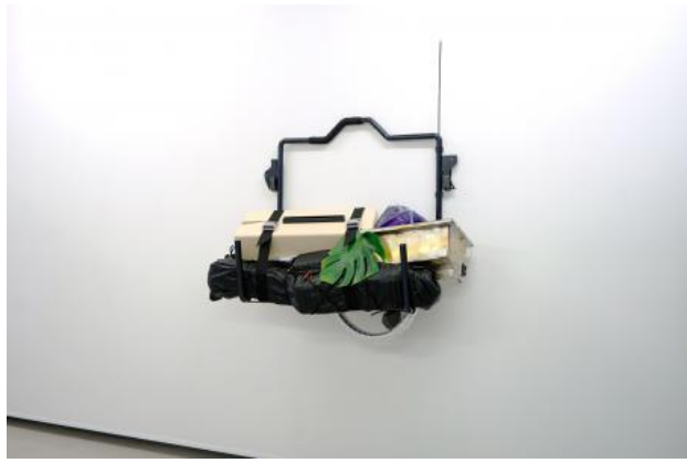
Memorism 2 , 2022 Sculpture, 40 x 101 x 114 cm