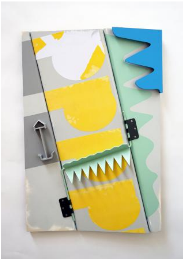
Hinter dem Platz, 2022 Wandpaneel, 17 x 51 x 75