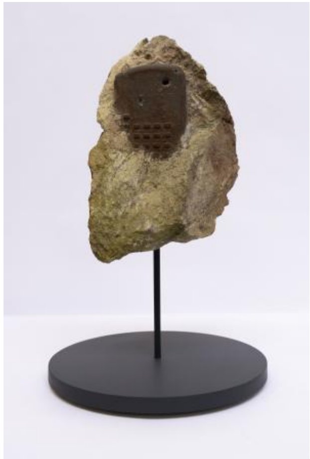
Ci 11 (Civilite), 2023 Sculpture, 32cm x 20cm x 20cm