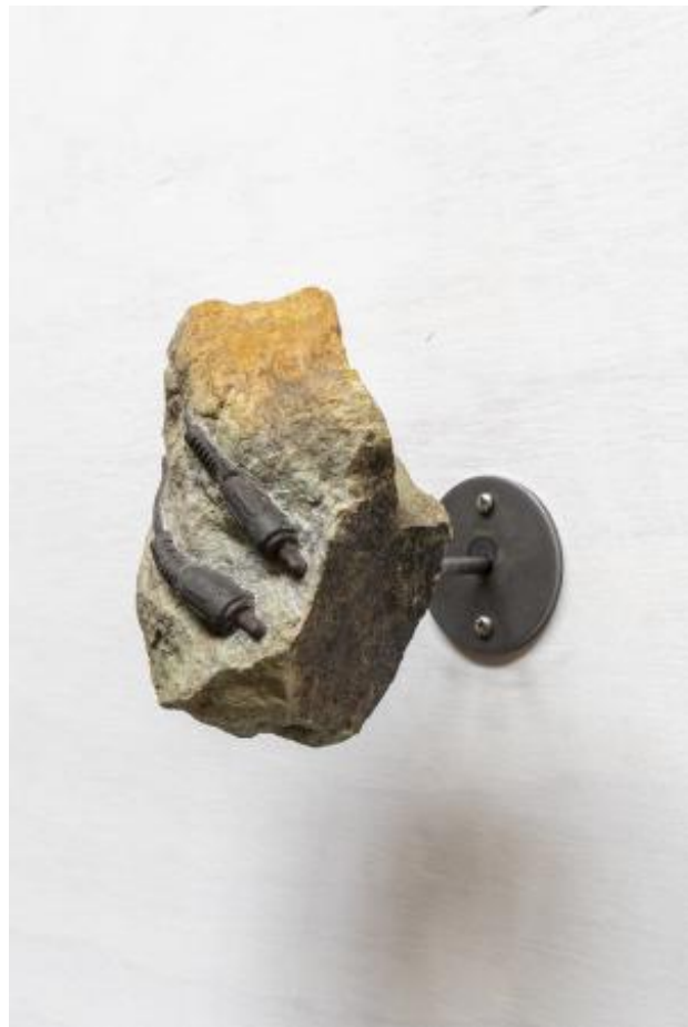
Ci 08 (Civillite), 2024 Sculptuur, 13cm x11cm x13cm