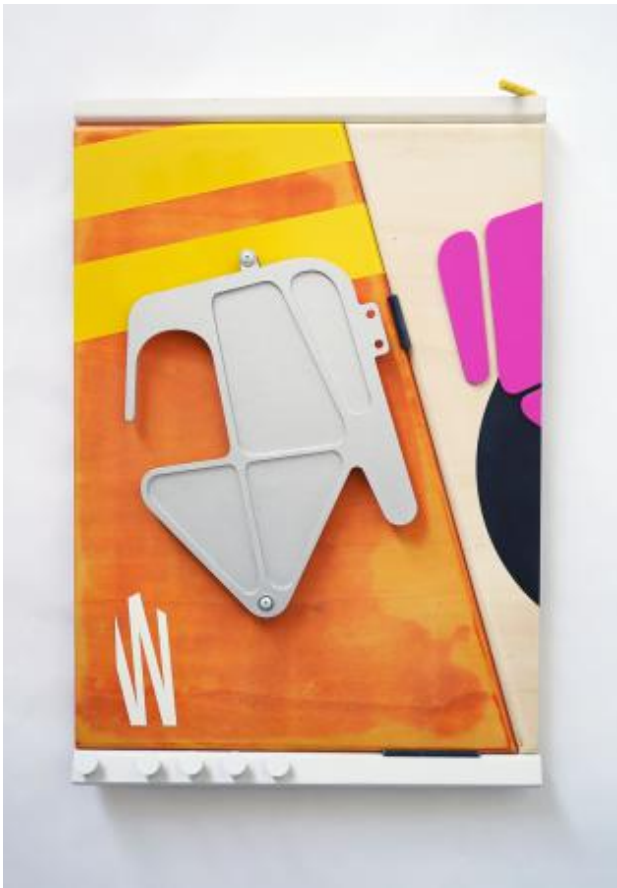
In Orbit, 2022 Wandpaneel, 9 x 51 x 75 cm