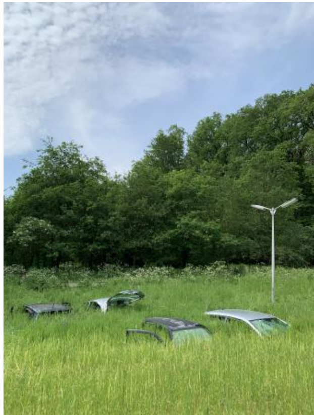
P, 2024 Installatie, 800 x 2000 x 380 cm