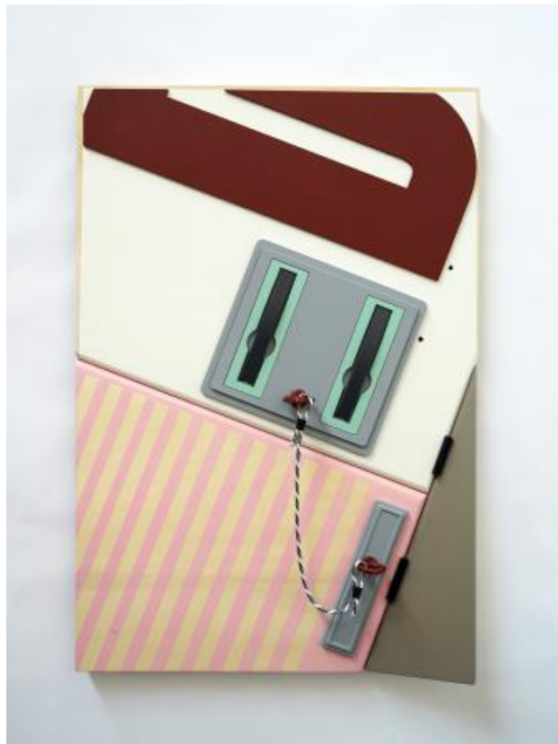
Sotto il D.I.S., 2022 Wandpaneel, 7 x 51 x 75