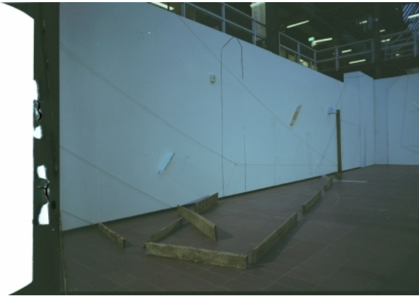
No Title, 2011 analoge fotografie, hout, touw, houtskoo, 2500x5500x2500/25x30