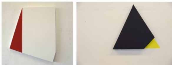
No Title/ No Title, 2012 acryl op canvas, 120x150/ 35/35