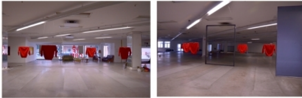
Leegte, 2012 verschillende technieken, 1200x600x300

2013 S.ART Enschede, Nederland aan de hand van interviews van de mensen van Twekkelo over hoe het leven daar is een werk maken voor in een weiland dat een jaar moet blijven staan dit gebeurde aan de hand van stemmen je moest met je idee aan komen en zes mensen werden uitgekozen Uitgevoerd