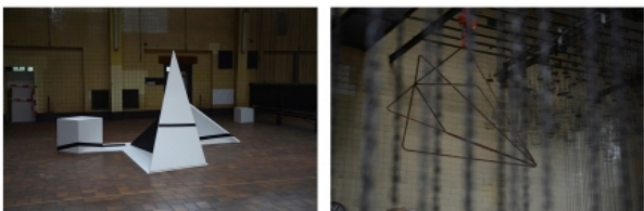
No Title/ No Title, 2012 hout , zwarte en witte acryl/ staal, 400x500x220/ 300x200x200