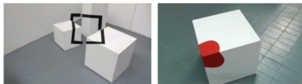
Kube/Play [videostils], 2012 video, tijd 00:40/0137