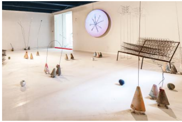
Your Playground, 2021