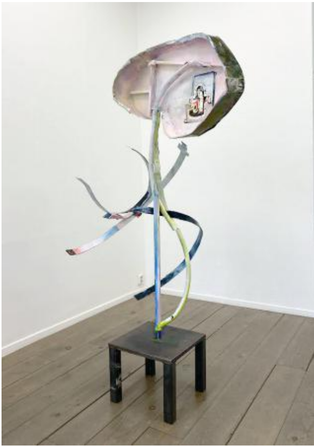
macro micro macro, 2023 metaal papier verf, 80X80X210 cm