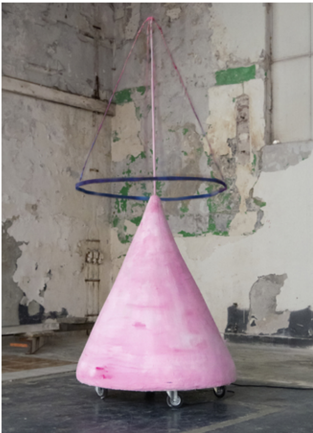
01, 2019 Gips, metaal, touw, wol, wielen, motor, Diameter 120 cm, hoogte 250 cm