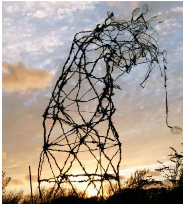
Veranderende herinnering 4, 2020