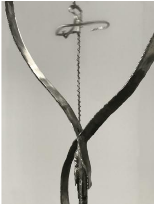
02, 2021 metaal, electro motor, 70 x 100 x 220cm