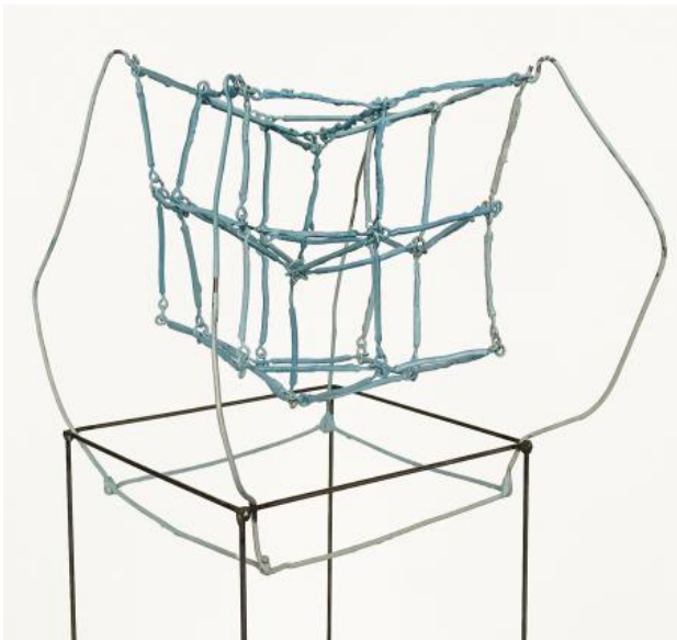
Aarddraad, 2021 metaal, 22 x 22 x 155cm