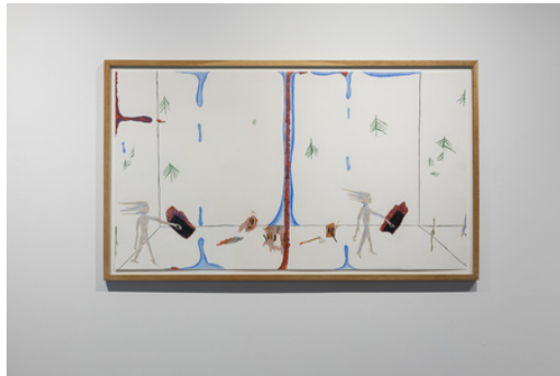
Hello Echo , 2020