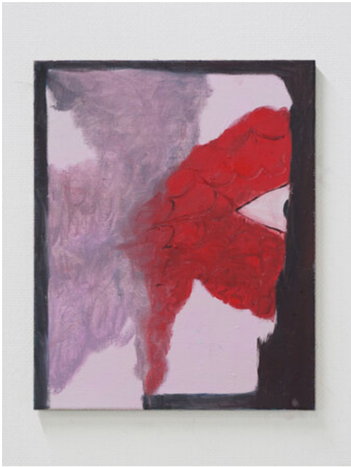
Spidey me 4, 2020