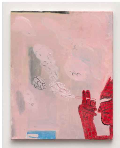
Spidey me 3, 2019