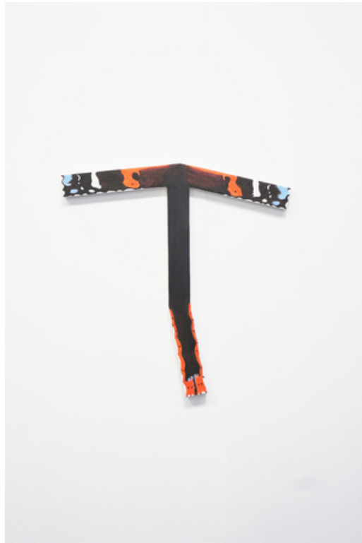
If it is true that I am someone I want to be an Atalanta, 2020