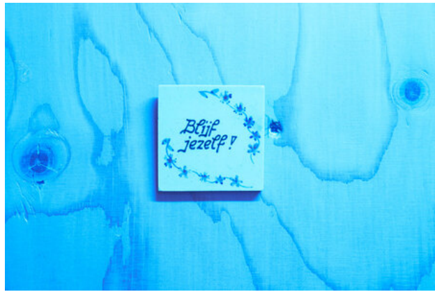
Blijf jezelf, 2019

If it is true that I am someone I want to be a cardboard box , 2019