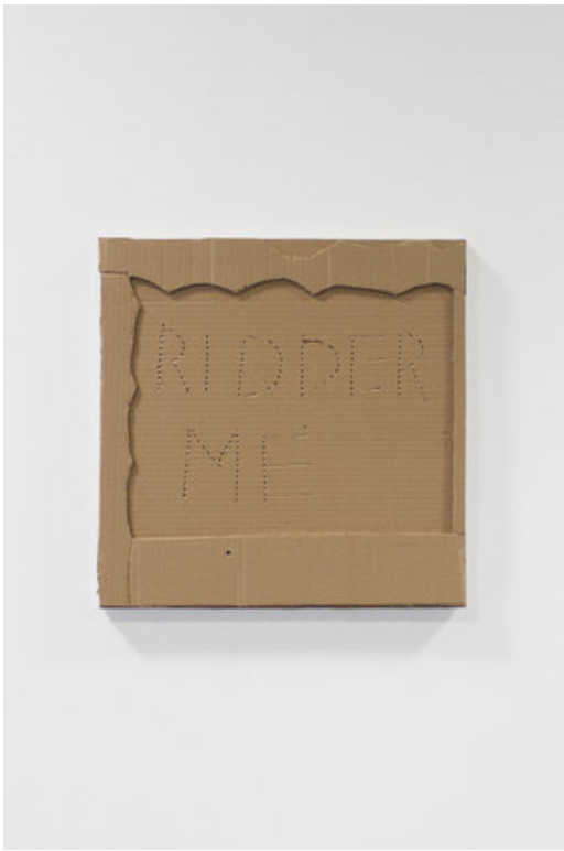
Ridder me, 2020