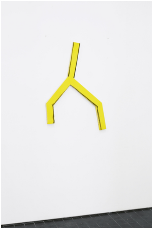
If it is true that I am someone I want to be Uma Thurman , 2020