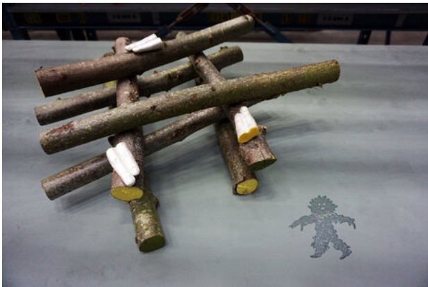
Xochipilli, 2019 Wood, Gouache Paint, Gips Molds, Felt, Varnish