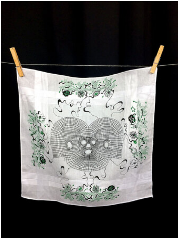
Ecology of Selves, 2018 Silk Screen on textile