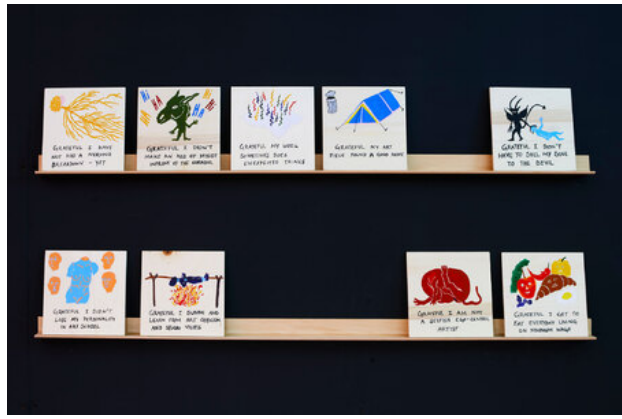
Artist Miracles (Series), 2018 Wood, Gouache Paint, Varnish, 15 x 15