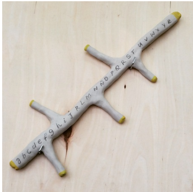
The Branch, 2019