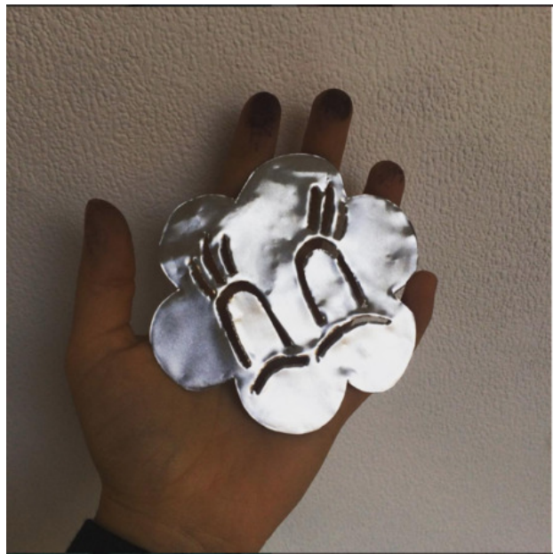
, 2018 Aluminium