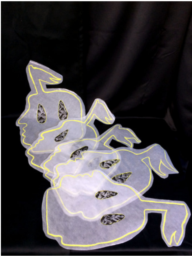
Conquest Kites, 2019