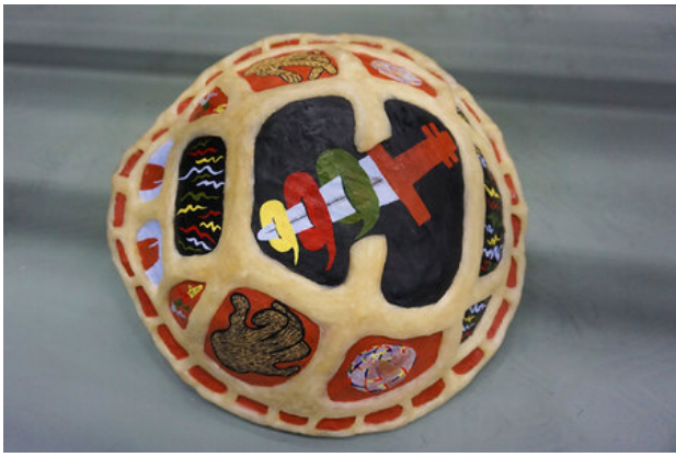
Caparuzón, 2019 Ceramic, Bee's Wax, Gouache Paint, Varnish