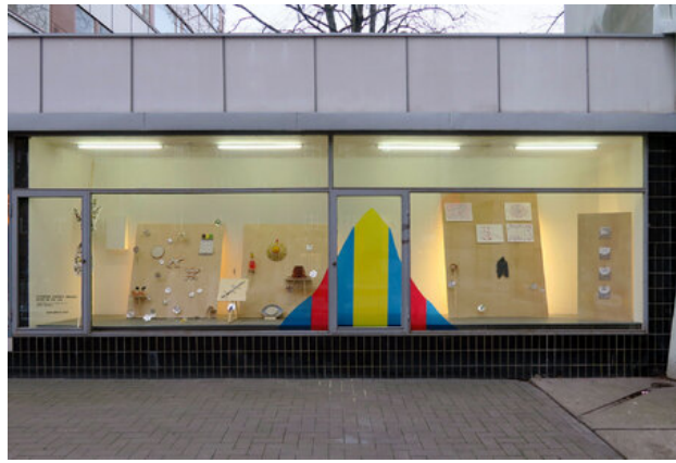
Water op de Zon, 2018